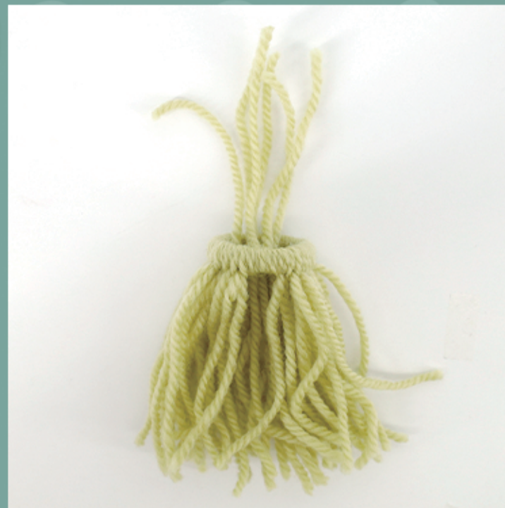
毛糸の先を輪っかの内側から上に出す