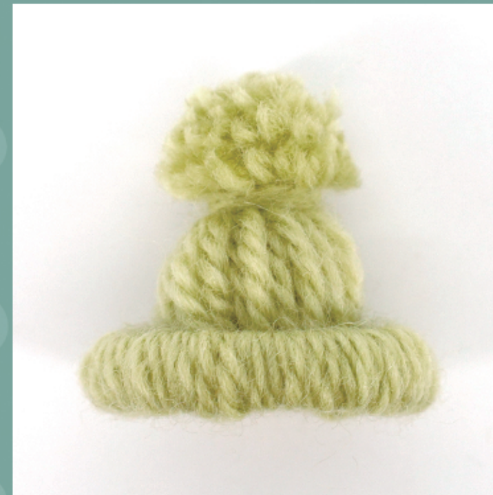
余分な毛を切って完成