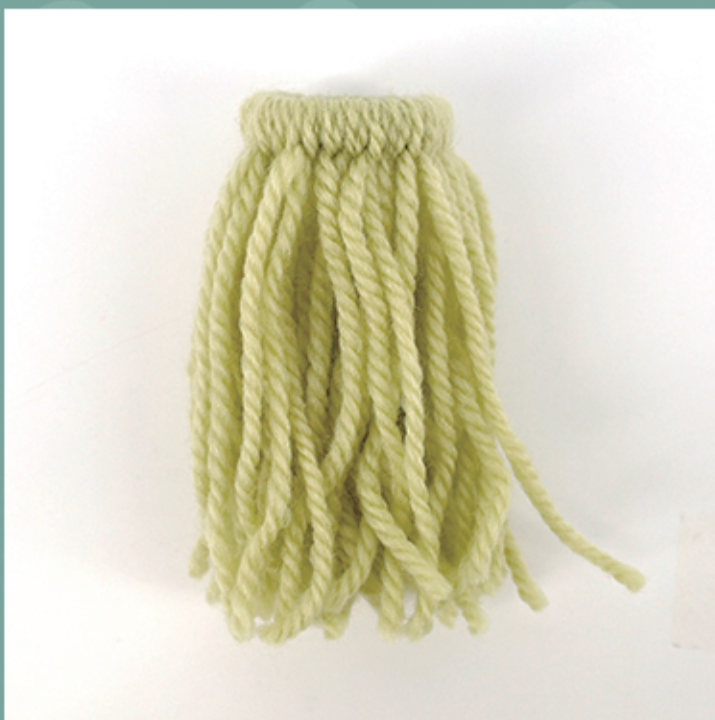
一周結んだところ