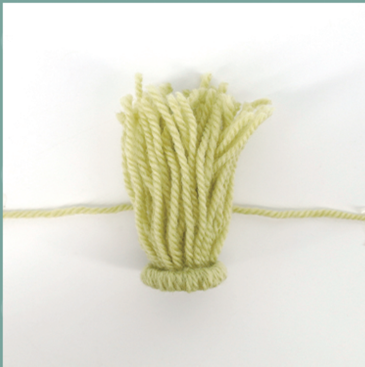
頂点にしたい部分で結ぶ