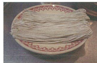
このまま電子レンジへ