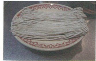
このまま電子レンジへ

※ 2人前の場合 200W(解凍モード) で3分間、1人前の場合1分30秒です。