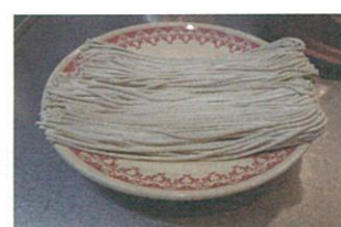
このまま電子レンジへ