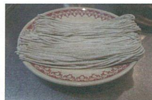
このまま電子レンジへ

※ 2人前の場合は 200W(解凍モード) で3分間、1人前の場合1分30秒です。