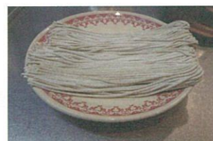
このまま電子レンジへ