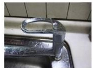
ハンドルレバー部分