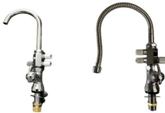
(左：スワンタイプ／右：ジャバラタイプ)