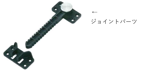
← ジョイントパーツ