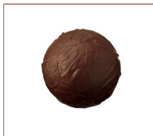
トリュフ・フォンダン コクのあるスイートチョコレートガナッシュ