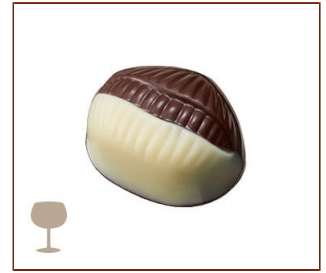
マロン ラム酒風味のマロンガナッシュ