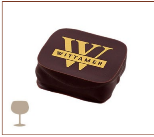
ヴィタメール V.S.O.Pコニャックを使ったガナッシュ

丁寧に型どられた艶やかなシヨコラは、ひとつずつ味わいの違うまろやかなガナッシュ。ヴィタメールが誇る繊細な味わいをお楽しみください。