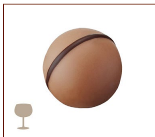
トリュフ・キルシュ ローマジパンとバターを使ったキルシュ風味のガナッシュ