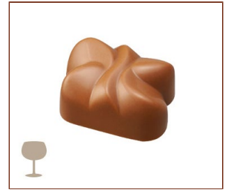
マティニオン ラムレーズン入りのホワイトとミルクチョコレートのガナッシュ