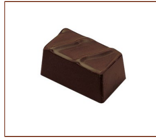
ダンドミディ アーモンド風味のジャンドイヤ