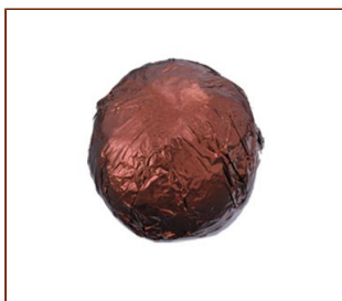
トリュフ・モンブラン キャラメルソースを使ったガナッシュ