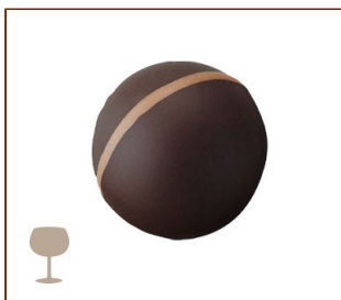
トリュフ・コニャック ローマジパンとバターを使ったコニャック風味のガナッシュ

コクのあるガナッシュとコーティングしたクーベルチュールがひとつになり、チョコレートのおいしさを引き出します。気品ある、味わい豊かなトリュフの数々。