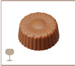
キュラソー オレンジピール入りコアントロー風味のガナッシュ