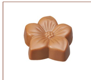
マロー キャラメルソースとモカ風味の口当たりのよいガナッシュ