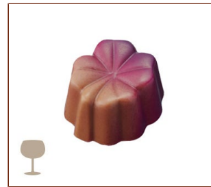
ミルティュー ブルーベリーソースとガナッシュをミルクチョコレートで包みました