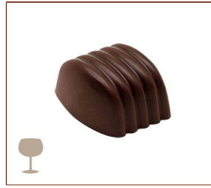
アイリッシュ・カフェ アイリッシュウイスキー風味のコーヒーガナッシュ