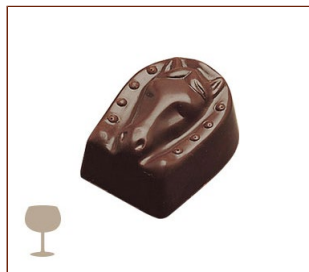
バニラ・フォンダン スイートとミルクチョコレートのガナッシュに、グラマンニエで香りづけ