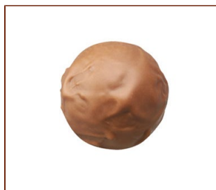
トリュフ・レイ コクのあるミルクチョコレートガナッシュ