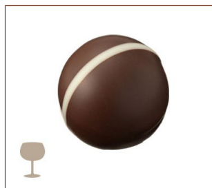
トリュフ・コアントロー ローマジパンとバターを使ったコアントロー風味のガナッシュ