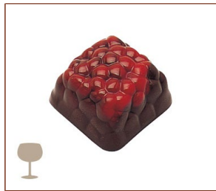
フランボワーズ フランボワーズソースとキルシュ風味のガナッシュ