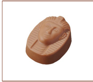
ダイヤモンド キャラメルソースをミルクチョコレートで包みました