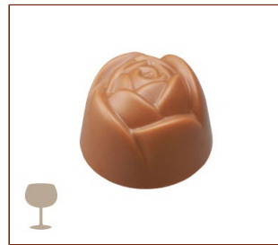
ホスピタリーヌ 赤ワイン風味のホワイトチョコレートのガナッシュ