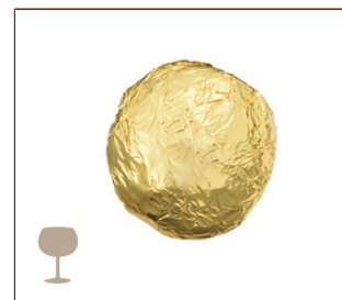
トリュフ・シャンパン シャンパン風味のまろやかなガナッシュ