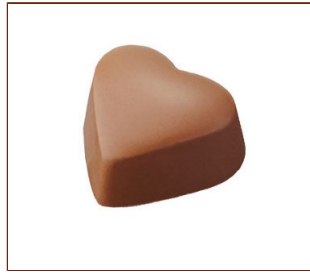
クール・レイ 香ばしいヘーゼルナッツ入りのジャンドイヤ