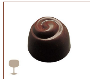
キルシュ キルシュ風味のフォンダンにグリオット（チェリー）※外側のチョコレートを割ると中の洋酒が流れ出ることがあります