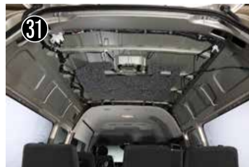
31 ブラケットを大きく切り欠いている方（車両前側）から通していきます。