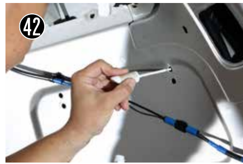
42 穴を開けた場所は、タッチアップなどでサビ止めをして下さい。