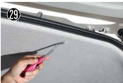
29 天井のクリップをすべて外します。