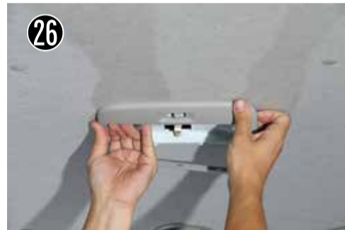
26 ルームランプの枠を引っ張り外します。