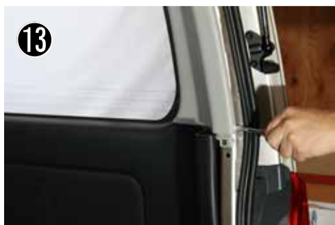
E ピラー下部のクリップを外します。