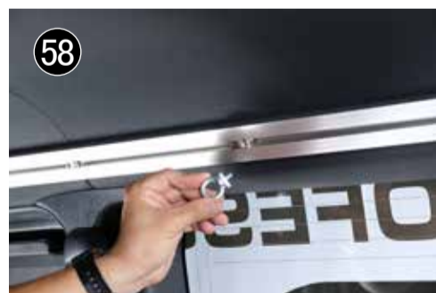
58 アイボルトにジュラコンワッシャーを取り付けし、移動ナットに取り付けて下さい。