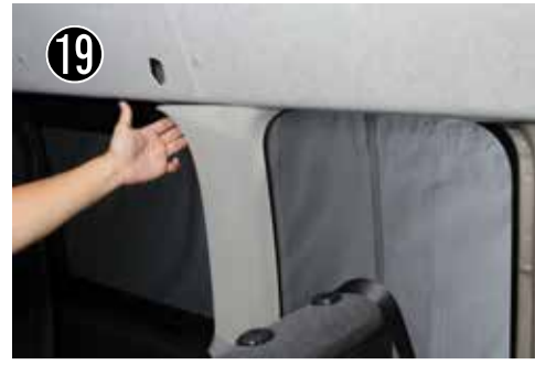
19 Cピラー上部を引っ張りクリップを外します。