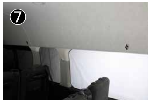
右側を取り外した後、左側も同じ方法で取り外します。