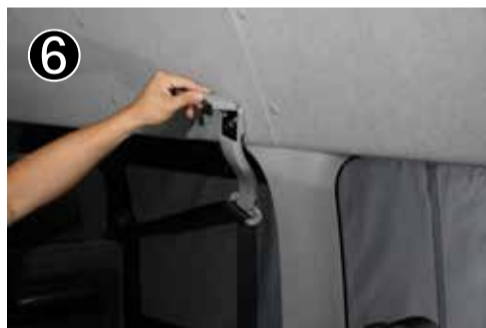
2 列目シートベルト本体を②③と同じ方法で外します。