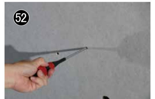
52 穴が見つかったら穴を広げます。