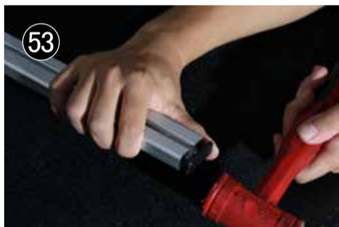
53 エンドキャップを打ち込みます。