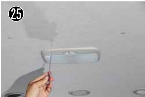
25 ルームランプのレンズを細いマイナスドライバーなどで外します。