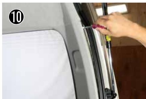
E ピラー上部のクリップを外します。