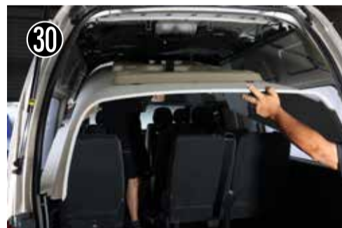
30 天井を車外に取り出します。