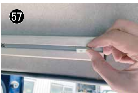
57 移動ナットを取り付けて下さい。