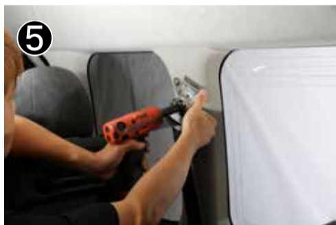
14mm ボルトを緩めてシートベルト本体を外します。