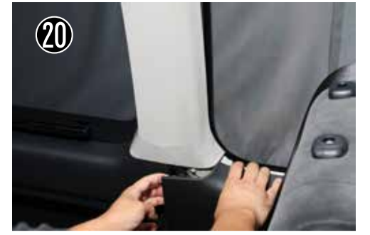
20 下部後ろのクォーターパネルを浮かせて、前側のサイドパネルを引っ張りながらピラーを抜き取ります。