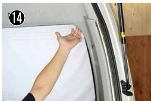
E ピラー前側ピラーを手前に引っ張り外します。