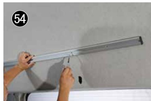
54 ⑤2の位置に極低頭 6 x 20 を使用して固定します。