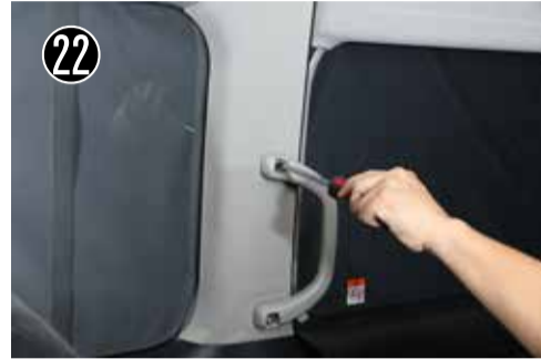
22 3番のプラスドライバーで上下のボルトを外し本体を外します。