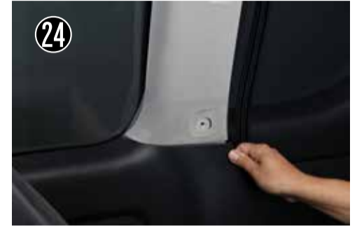
24 Cピラー上部を引っ張り、クリップを外しクォーターパネルを浮かしながらピラーを外します。