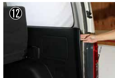
クォーターパネルを少し浮かせます。