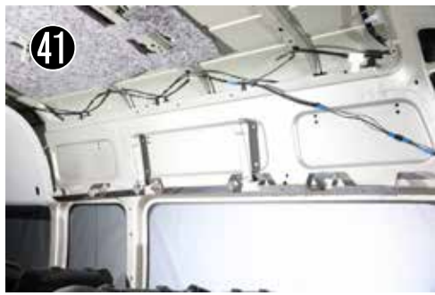
41 左右すべての穴を9mmに広げます。