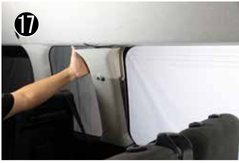
17 Dピラー上部を引っ張りクリップを外します。