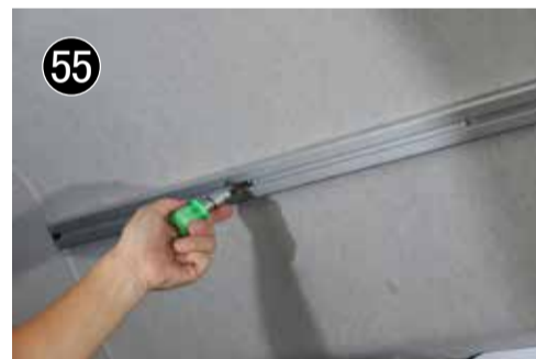
55 ⑤4の位置を基準にして他の位置を出し、極低頭 6 x 20 固定します。