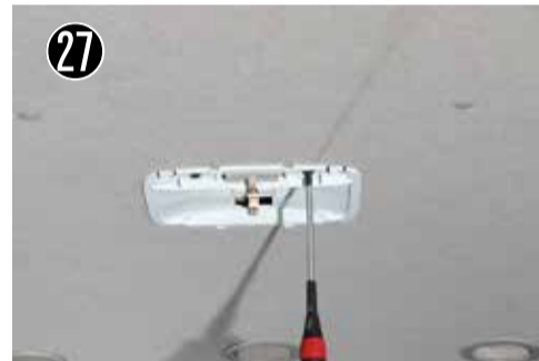
27 本体についている2番プラスビスを2本外します。