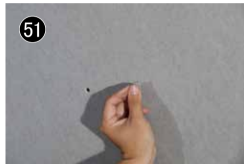
51 小さい針で探ります。