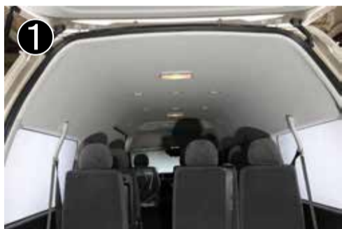
4 列目のシートベルトカバーを開けます。