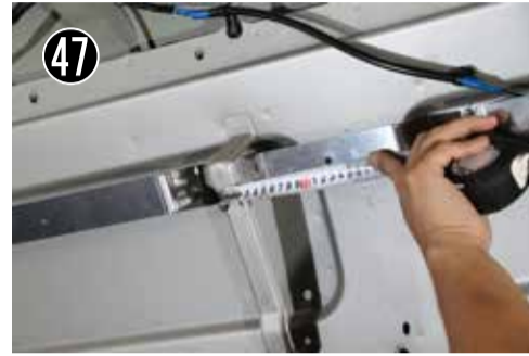
47 天井クリップステーからアルミスライドバー取付穴までの距離を計っておいて下さい。 * mm 単位まで計測して下さい。