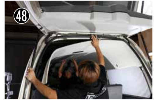
48 天井を元に戻します。