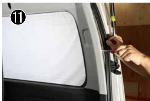
E ピラー中央のクリップを外します。