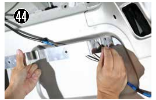
44 M5 x 25 のボルトでアルミスライドバーを固定します。