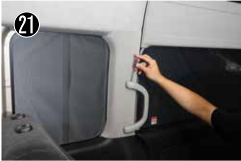
21 左側 Cピラーのアシストグリップのボルトキャップを細いマイナスドライバーなどで外します。