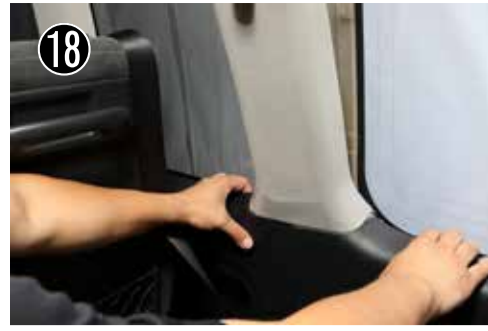
18 下部の前後クォーターパネルを引っ張りながらピラーを抜き取ります。