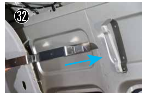
32 大きい切り欠きを図のように合わせて位置を出します。