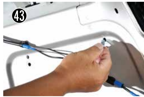
43 M5 ターンナットをすべての穴に入れてください。