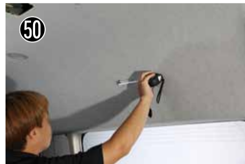
50 ④7で計測した数値でブラケットの穴を探します。