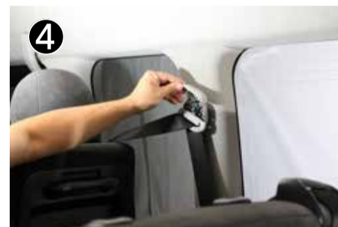
3 列目シートカバーを開けます。