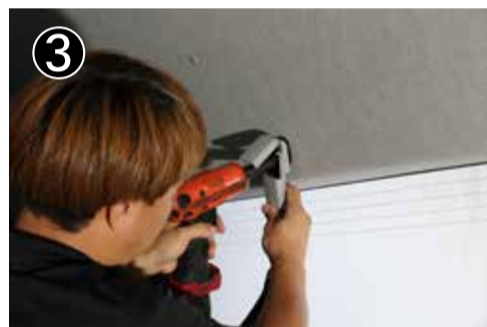
14mm ボルトを緩めてシートベルト本体を外します。