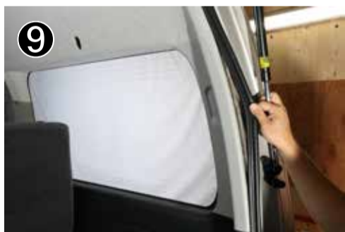
E ピラーのウェザーストリップを浮かせます。