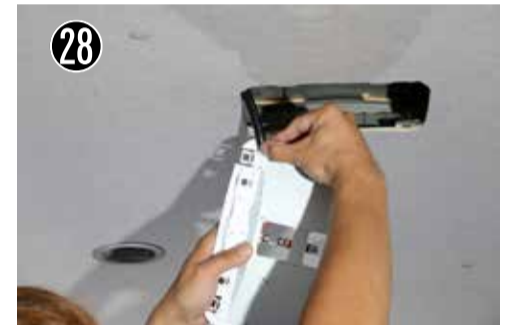
28 カプラーを抜き本体を外します。