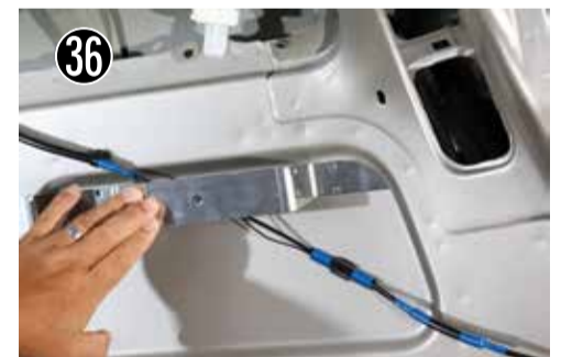
36 大きい切り欠きを図のように合わせて位置を出します。