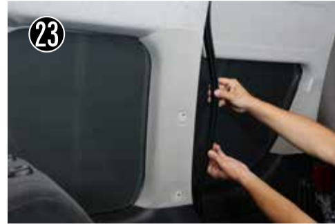
23 ウェザーストリップを浮かします。