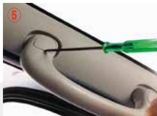
⑤ 小さなドライバーでボルトカバーを取り外して下さい。傷つきやすいので注意して下さい。