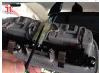
⑪ マップランプのコネクターを取り外して下さい。