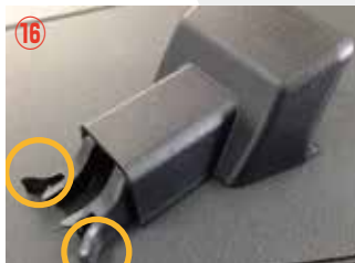
⑯ ○の箇所を押して外します。