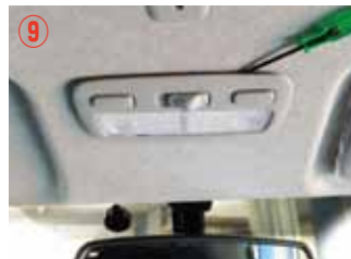
⑨ 小さなドライバーを挟み、ゆっくり外して下さい。