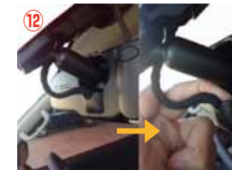
⑫ ルームミラー裏側のコネクターを取り外して下さい。