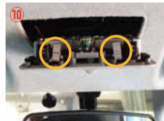
⑩ ○の位置にピンがありますので押さえずながら外して下さい。無理やり外すとピンが折れやすいので注意して下さい。