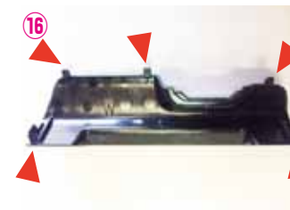
⑯ ⑮のピンを折らないように取り外して下さい。