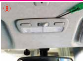
⑨ 小さなドライバーを挟み、ゆっくり外して下さい。