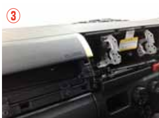
③ Instrumentパネルを取り外した状態です。