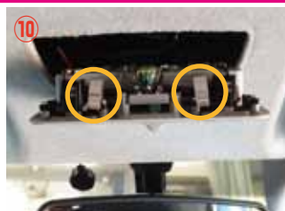
⑩ ○の位置にピンがありますので押さえながら外して下さい。無理やり外すとピンが折れやすいので注意して下さい。