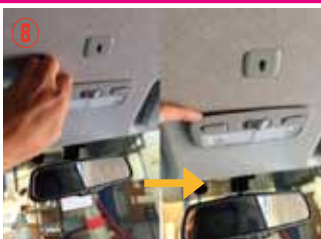
⑧ マップランプのカバーに爪を入れて少し浮かせて下さい。