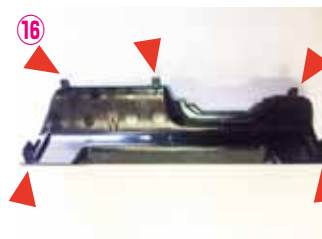
⑯ ▶のピンを折らないように取り外して下さい。