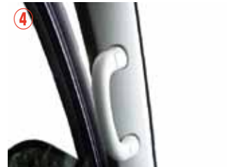
④ 左側 A ピラーを取り外してきます。