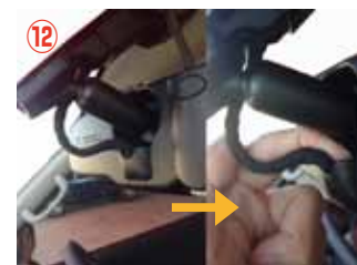
⑫ ルームミラー裏側のコネクターを取り外して下さい。