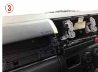
③ Instrumentパネルを取り外した状態です。