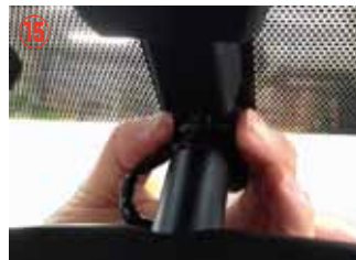
⑮ ラインカバーを取り外して下さい。