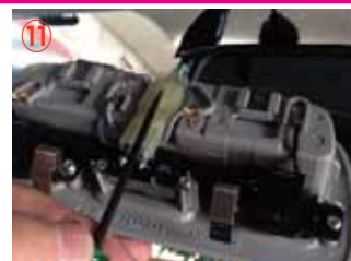
⑪ マップランプのコネクターを取り外して下さい。