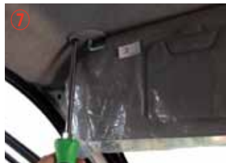
⑦ プラスドライバー#3 を使用してサンバイザーを取り外して下さい。