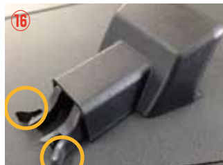
⑯ ○の箇所を押して外します。