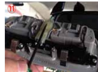
⑪ マップランプのコネクターを取り外して下さい。