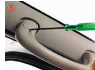
⑤ 小さなドライバーでボルトカバナーを取り外して下さい。傷つきやすいので注意して下さい。