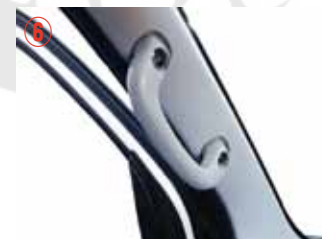
⑥ プラスドライバー#3 を使用してアシストグリップを取り外して下さい。