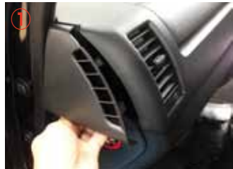
① 助手席側サイドパネルを外して下さい。