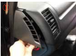
① 助手席側サイドパネルを外して下さい。