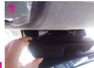
⑮ 上段のカバーのみを取り外して下さい。