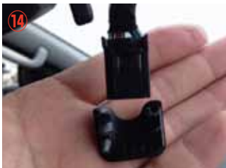
⑭ ミラー裏カバーのカバーを取り外して下さい。