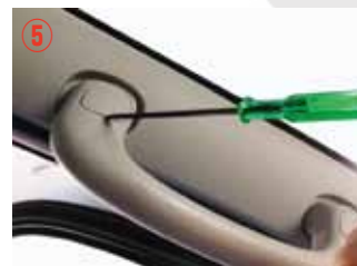
⑤ 小さなドライバーでボルトカバーを取り外して下さい。傷つきやすいので注意して下さい。