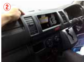
② インstrumentパネル (メーター部) を取り外して下さい。