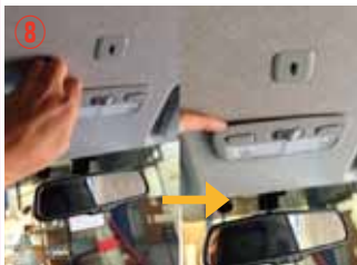
⑧ マップランプのカバーに爪を入れて少し浮かせて下さい。