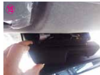
⑮ 上段のカバーのみを取り外して下さい。