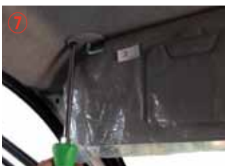
⑦ プラスドライバー#3 を使用してサンバイザーを取り外して下さい。