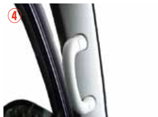
④ 左側 A ピラーを取り外していただきます。