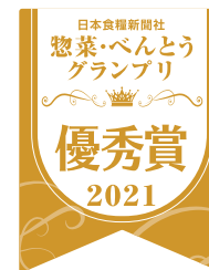
2021年4月 ファベックス 「惣菜・べんとうグランプリ」 2021 優秀賞