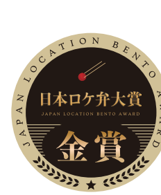
2024年6月 第1回 日本ロケ弁大賞 金賞受賞

塚田農場おべんとラボのお弁当の美味しさは数々の受賞実績が証拠。 食材や調理法にこだわり抜いたお弁当を是非ご賞味ください。