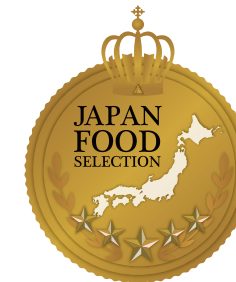
2023年10月 ジャパン・フード・セレクション グランプリ