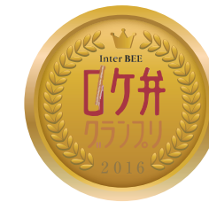
2016年11月 Inter BEE 第2回ロケ弁グランプリ グランプリ