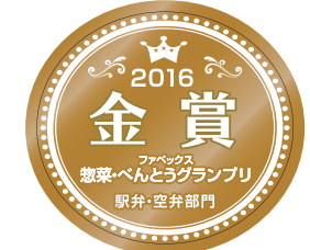
2016年4月 ファベックス 「惣菜・べんとうグランプリ」 2016 金賞