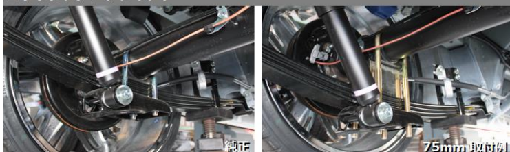
ロワリングブロックキット