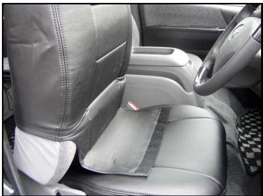
①ヘッドレストを外し背もたれカバーをかぶせて下さい。マジックテープ部分を折り返して必ず左右均等に引き下げてください。