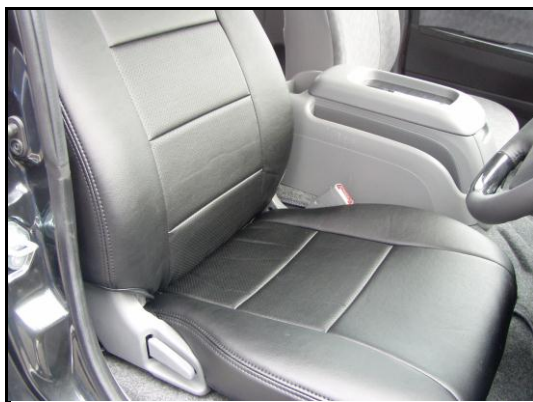
⑥背もたれ部分の完成です。助手席側も同様に取り付けください。