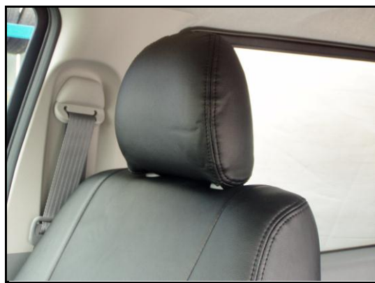
⑦ヘッドレストをシートに取り付けてください。 助手席、2列目も同様に取り付けください。