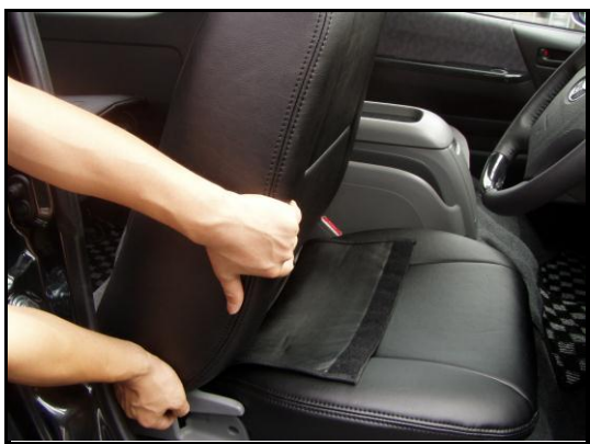
②肩のラインに合わせて側面部分を上からなでるようにしてシートに馴染ませます。その後、側面から中央に向かってカバーを密着させていきます。