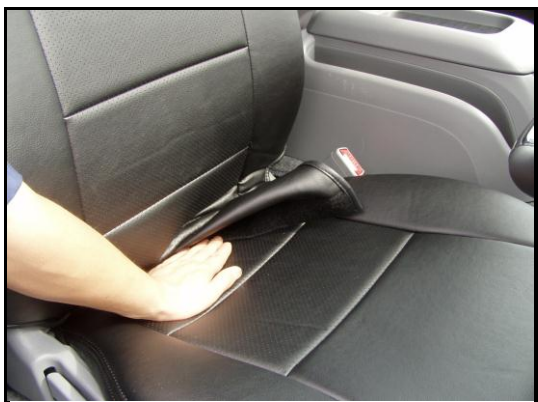
③座席と背もたれの間にマジックテープの付いた部分を入れこみます。