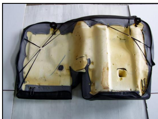
⑥取外した座面にカバーをかぶせます。 裏側をマジックテープで固定し、付属のフックで ゴムループを固定します。