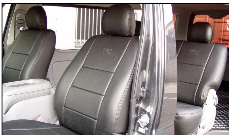
全て取り付ければ完了になります。 お疲れ様でした。