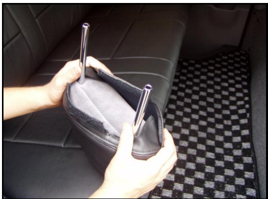
④ヘッドレストを背もたれから取り外して、底面のカバーをかぶせます。