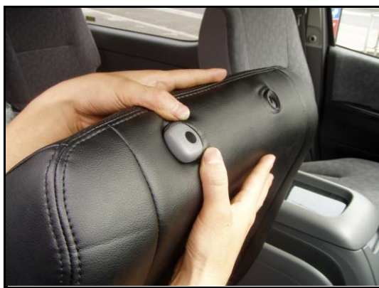
⑤ヘッドレストの台座部分を穴から取り出します。生地伸びを利用して横から潜り込ませるように取り出してください。無理に取り出すと破損の恐れがありますのでご注意ください。