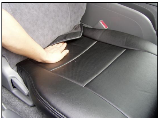
②座面と背もたれの隙間にマジックテープの付いた 部分を入れこみます。