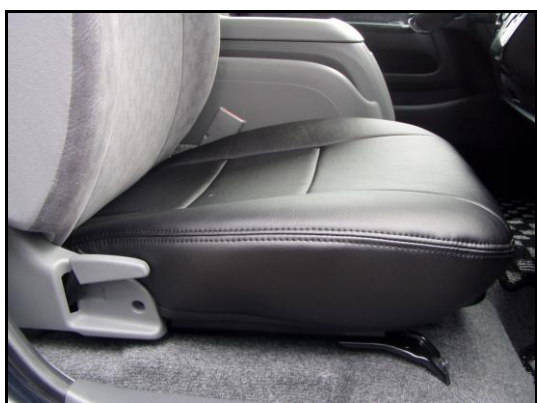
③シートとプラスチックカバーの隙間にシートカバー を入れ込み、紐を後ろ側にまわしてください。