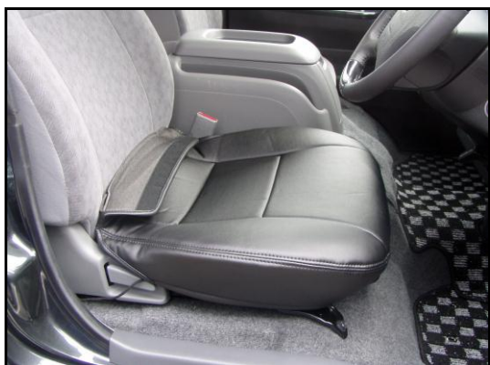
①運転席の座面カバーをシートのラインに 合わせて かぶせてください。