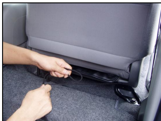
④座面後ろ側に紐を取り出し、固定してください。 片側の紐で輪を作り、反対側の紐を通して 絞り込んでから結んでください。