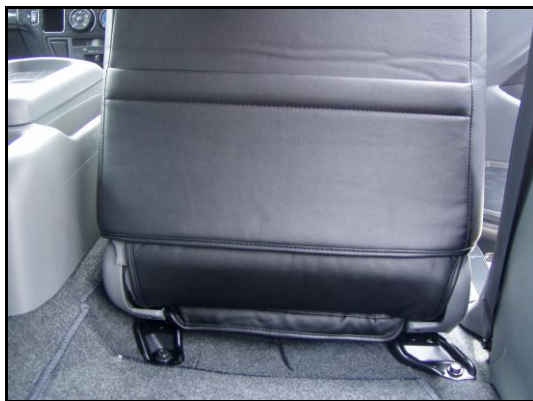
④③で入れ込んだ部分を後ろから引き出し、マジックテープで固定します。