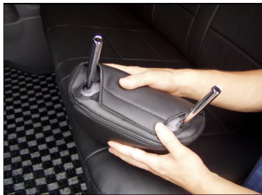
⑥余った生地を重ねるように押し込んでください。