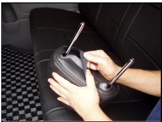
⑤マジックテープをバランスよく貼り付けてください。