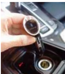
シガーソケットに差し込むだけ！