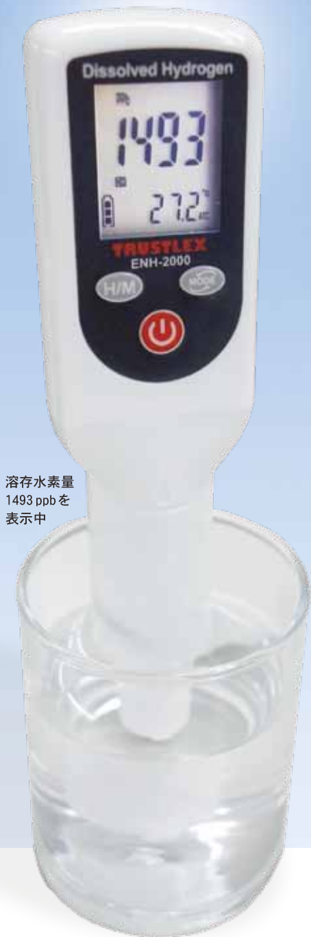
溶存水素量 1493 ppbを 表示中

! 本測定器は、水素水生成器や水素発生具、水素水の溶存水素測定用に開発されたものです。特殊センサを使用しているため、お湯、アルカリイオン水、塩水、ジュース、お茶、サプリメント等の測定には使用しないでください。この場合の表示された測定数値は、水素濃度を特定するものではありませんのでご注意ください。