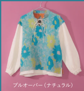
プルオーバー (ナチュラル)