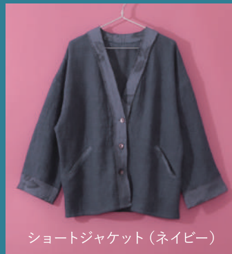
ショートジャケット (ネイビー)

・生産国の都合により、やむなく納期が変更することがあります。・掲載商品は写真撮影および印刷の都合上、実際の商品と多少異なる場合がございますのでご了承ください。・着丈は着用者の後ろ中心の首の付け根から裾までの長さを表示しております。そのため、表示された着丈と実際の長さに誤差があるデザインもございます。・サイズ、仕様、価格等は予告なく変更する場合がございます。・表示価格はすべて税抜価格です。