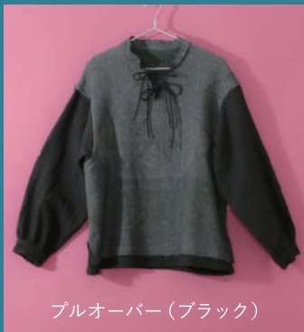
プルオーバー (ブラック)