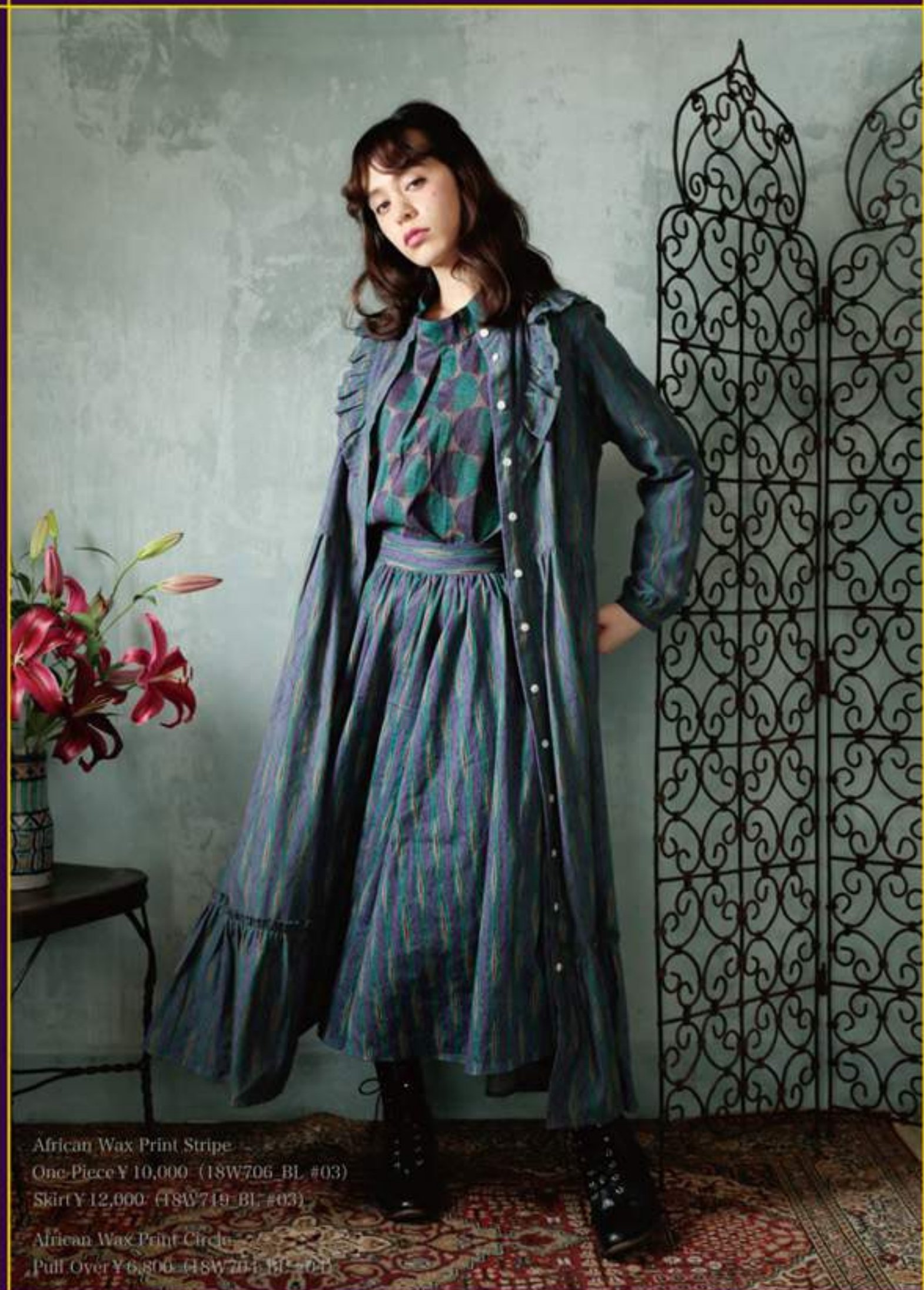
African Wax Print Stripe One-Piece ¥10,000 (18W706_BL #03) Skirt ¥12,000 (18W719_BL #03) African Wax Print Circle Pull Over ¥6,800 (18W704_BL #01)