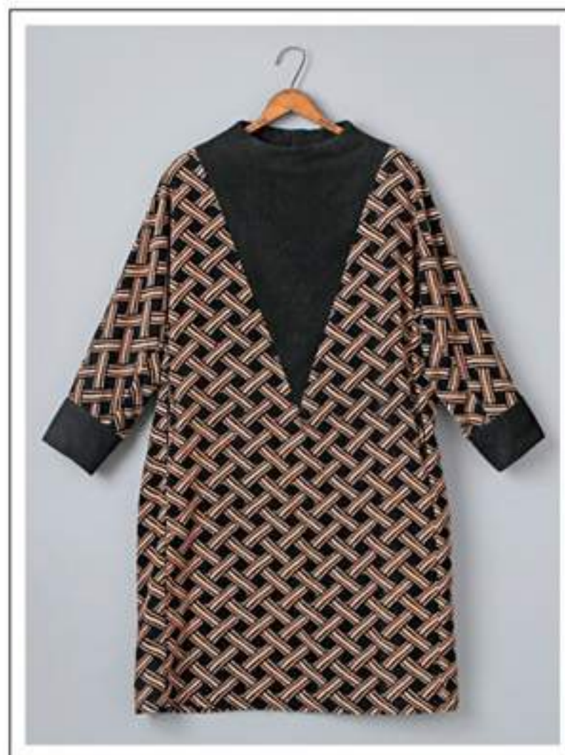
Tunic ボトルネックチュニック no.18W708 price ¥9,500 size : 2 バスト112cm / 着丈 96cm