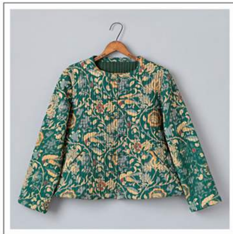
Jacket キルティングジャケット no.18W711 price ¥9,800 size : 2 バスト98cm / 着丈53cm 裏地の色は変わります。

オリエンタルな花鳥更紗を温かみのあるツイル地に乘せました。 大人っぽく女性らしい雰囲気です。