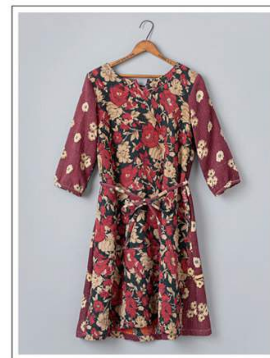
Tunic ウエストマークチュニック no.18W721 price ¥17,000 size : 2 バスト100cm / 着丈 100cm

刺し子を施したインドのリサイクル布、ラリーキルト を使用したシリーズ。 1枚1枚現地で厳選した布を使用しており、 全て一点ものになります。