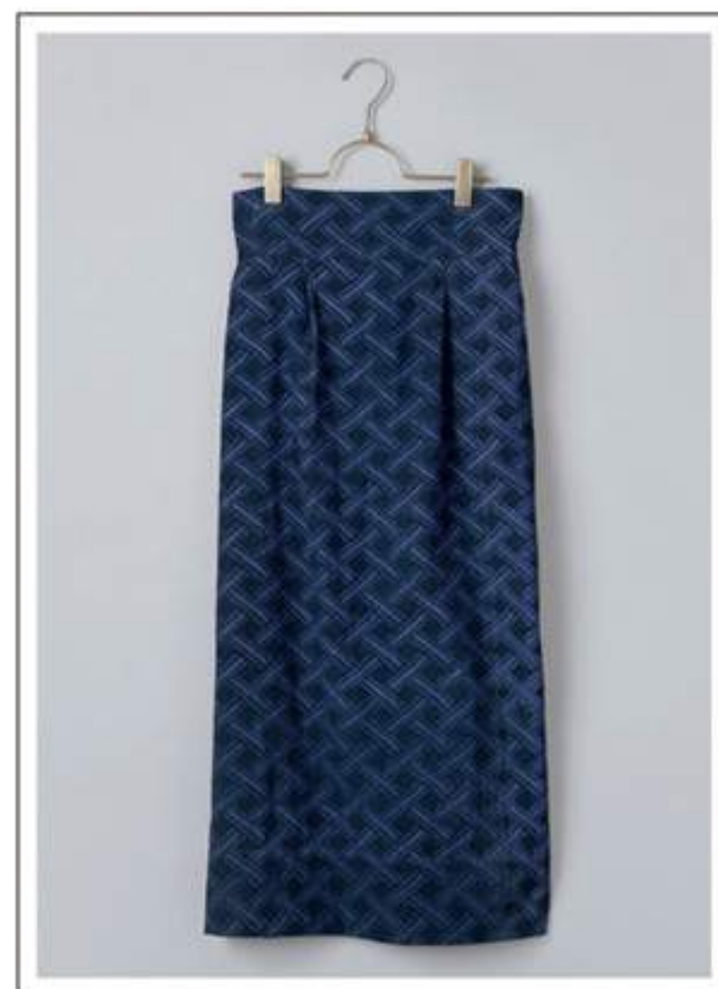
Skirt タイトスカート no.18W710 price ¥8,600 size : 2 ウエスト 68/88cm / 後ろ丈 82cm+ベルト巾 8cm

アフリカクバ王国の草ビロードの布をチェック柄に見立て コーデュロイにプリントしたシリーズ。 落ち着いた色味でクラシカルな仕上がりです。