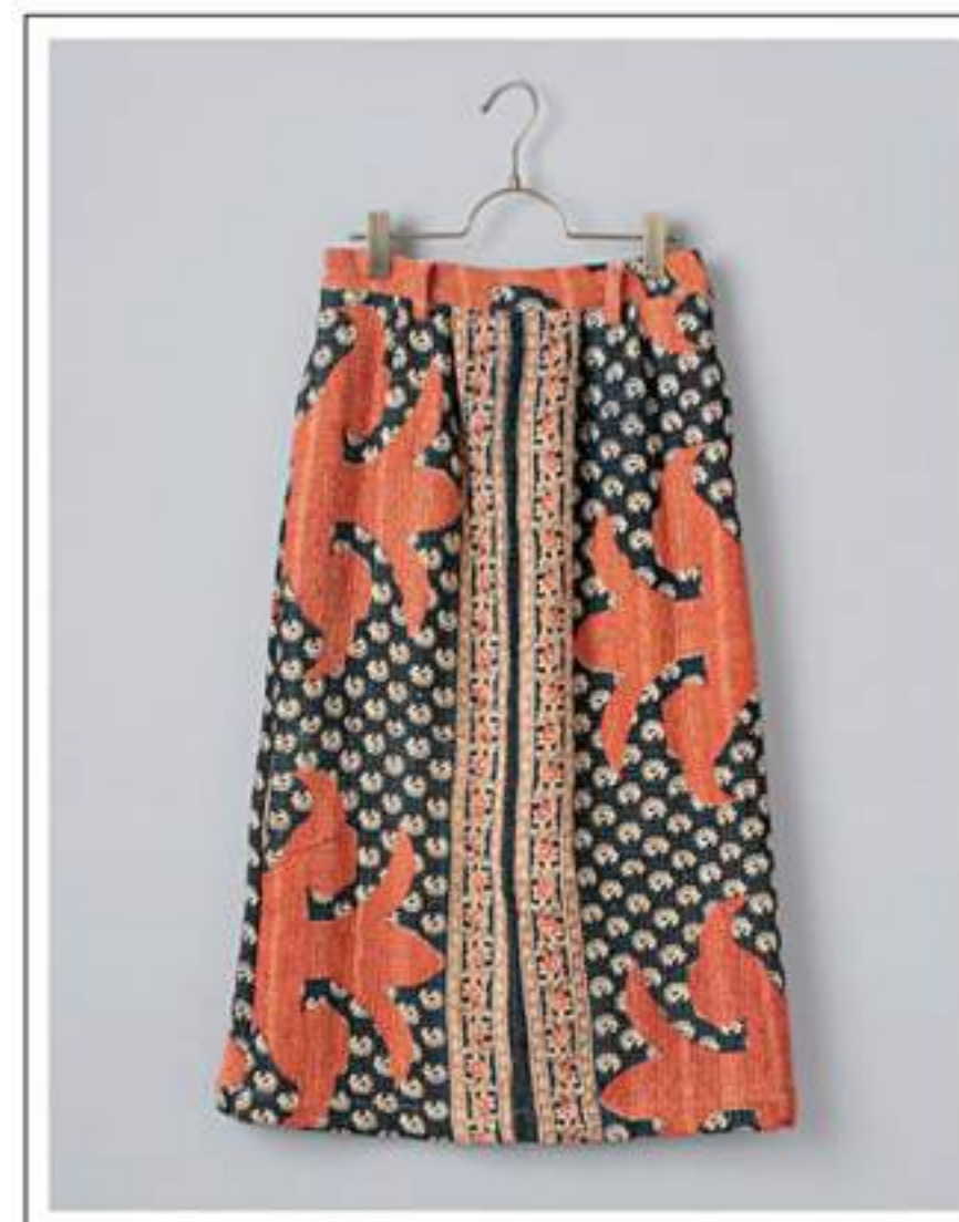
Skirt タイトスカート no.18W722 price ¥16,000 size : 2 ウエスト 68/88cm / 後ろ丈 75cm