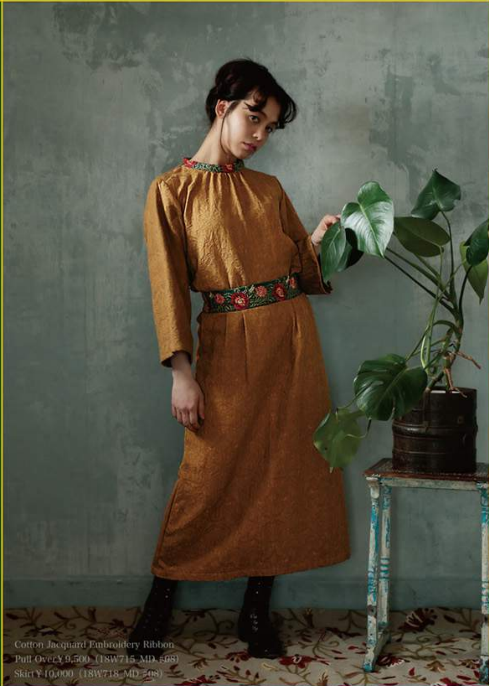
Cotton Jacquard Embroidery Ribbon Puff Over ¥9,500 (18W715 MD #08) Skirt ¥10,000 (18W718 MD #08)