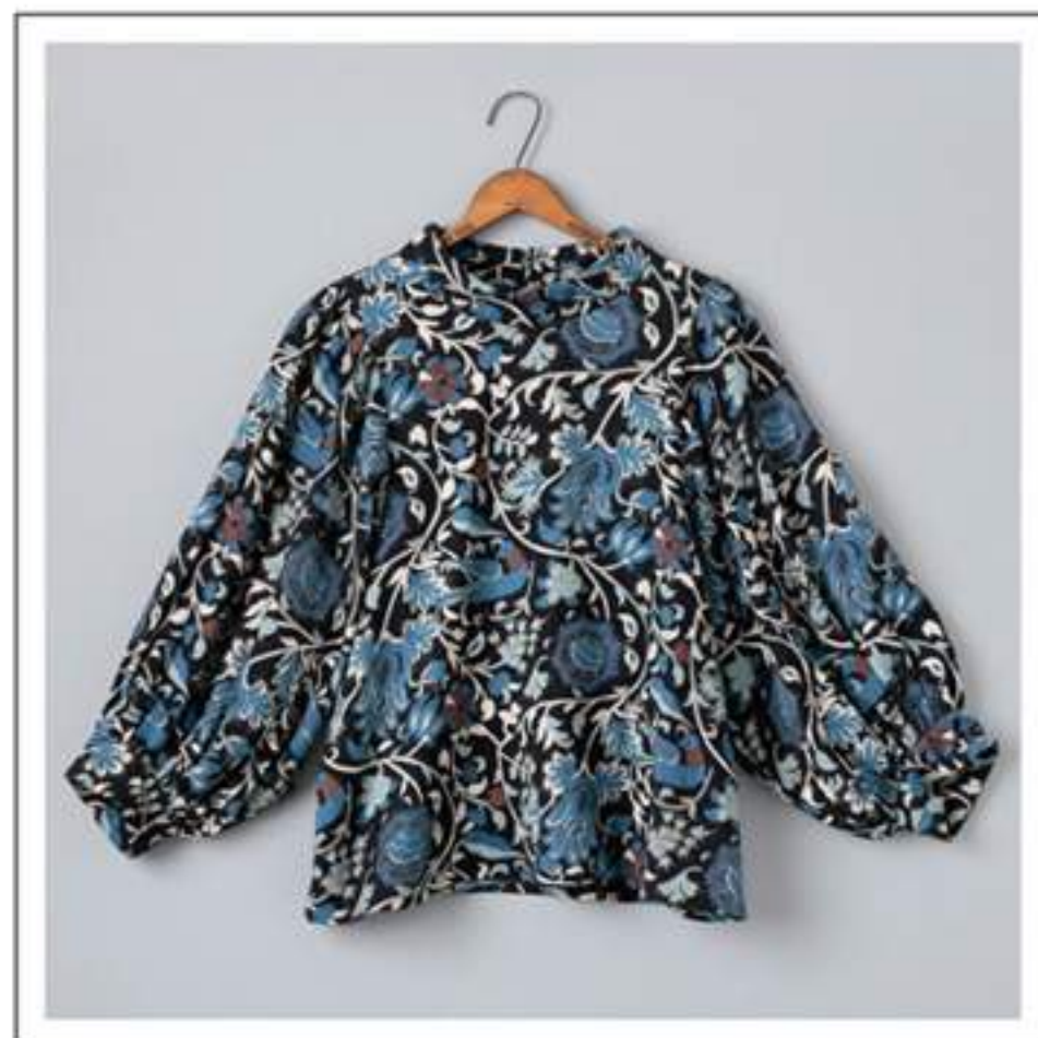
Blouse ボリュームスリーブブラウス no.18W712 price ¥7,800 size : 2 バスト104cm / 着丈58cm