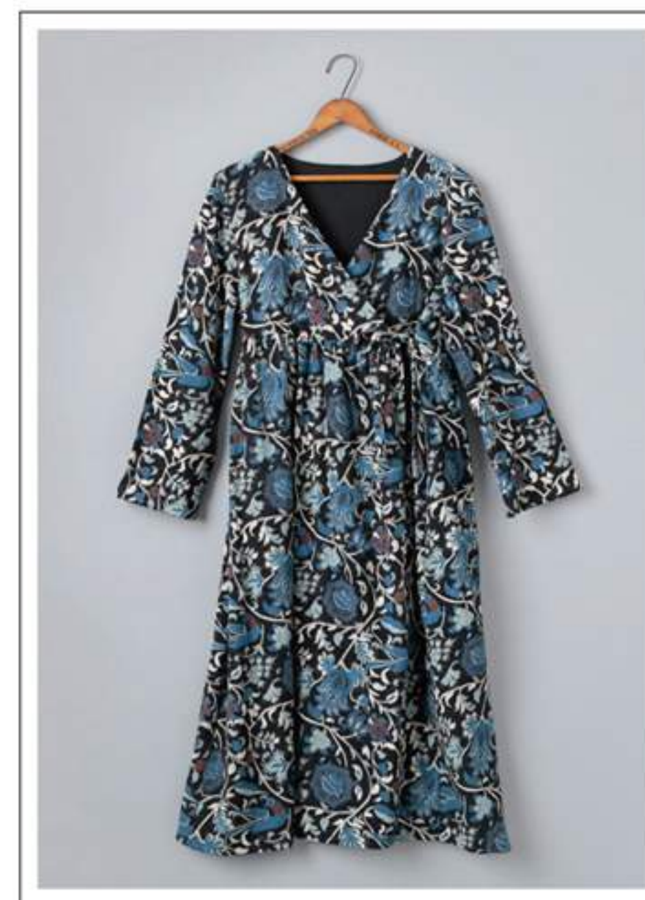
One-Piece ラップワンピース no.18W713 price ¥12,000 size : 2 バスト96cm / 着丈110cm