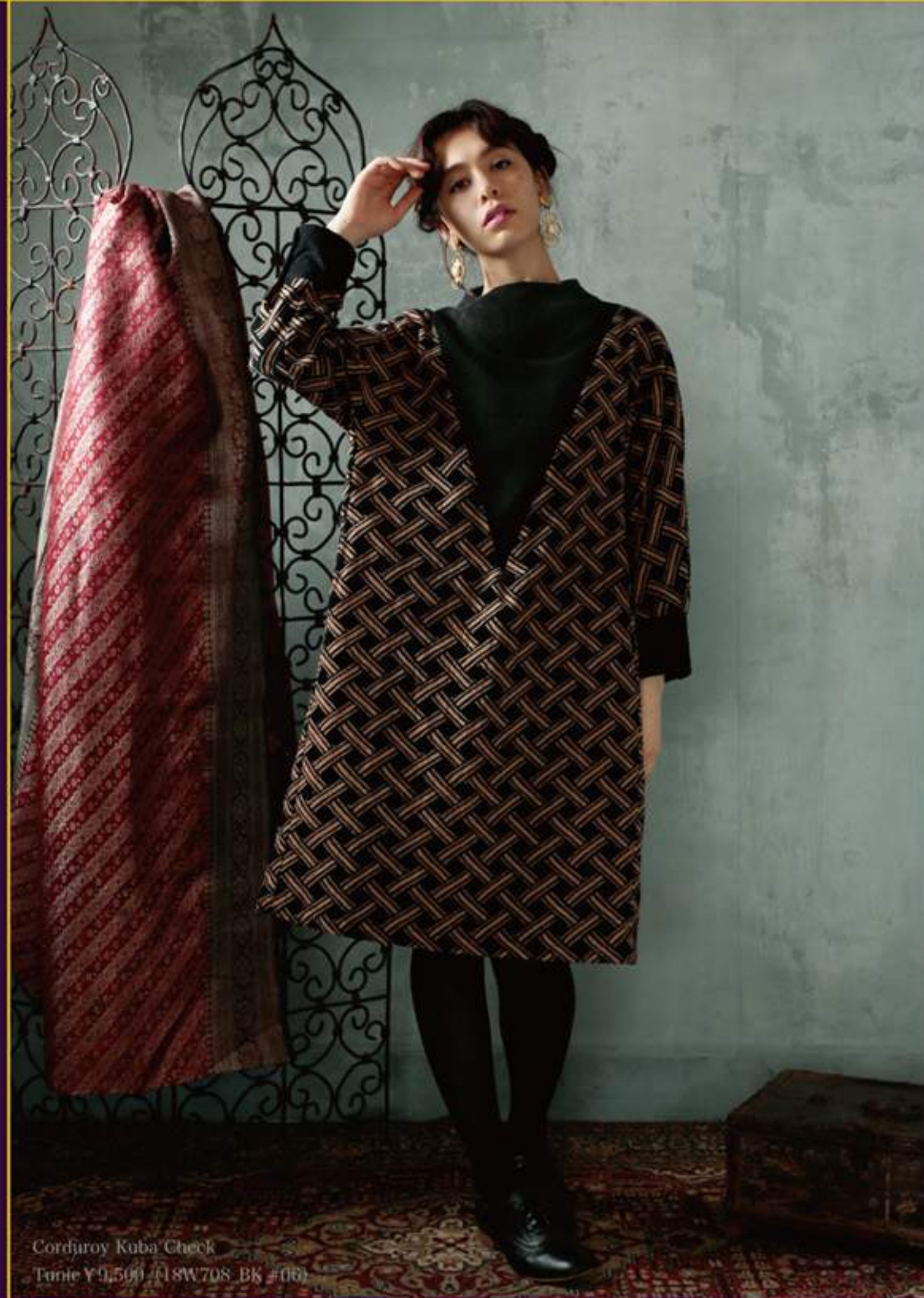
Corduroy Kuba Check Tunic ¥9,500 (18W708_BK #06)