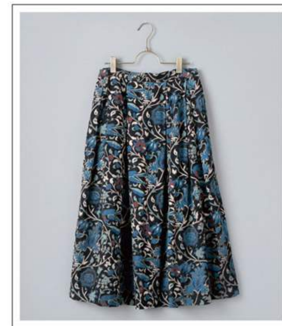
Skirt タックスカート no.18W714 price ¥9,500 size : 2 ウエスト 65/83cm / 後ろ丈78cm