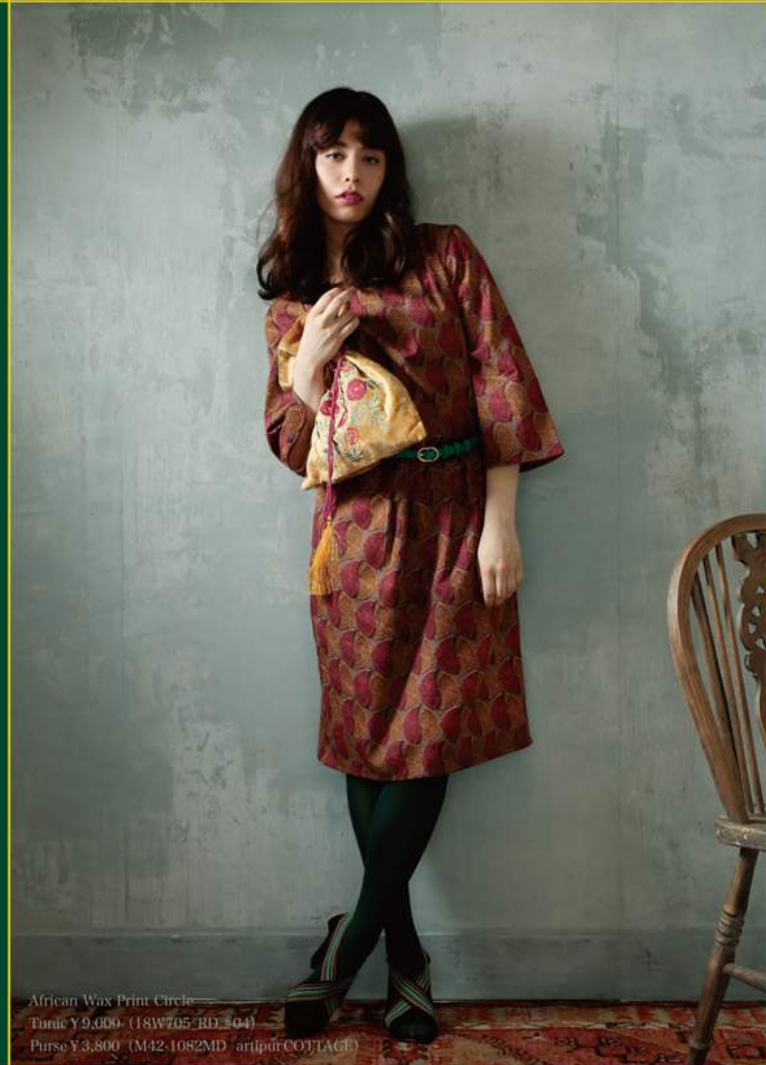
African Wax Print Circle Tunic ¥9,000 (18W705 RD #04) Purse ¥3,800 (M42-1082MD artpur COTTAGE)