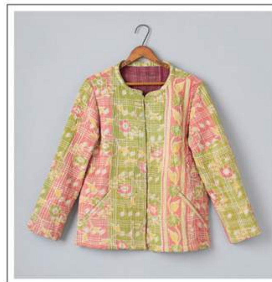
Jacket ショートジャケット no.18W720 price ¥16,000 size : 2 バスト98cm / 着丈 60cm