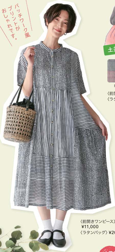
〈前開きワンピース〉 ¥11,000 〈ラタンバッグ〉 ¥20,900