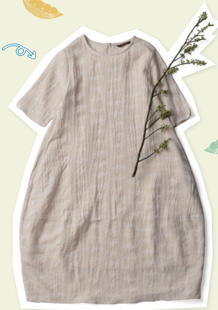
〈コクーンワンピース〉 ¥14,300