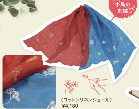
〈コットンリネンショール〉 ¥4,180