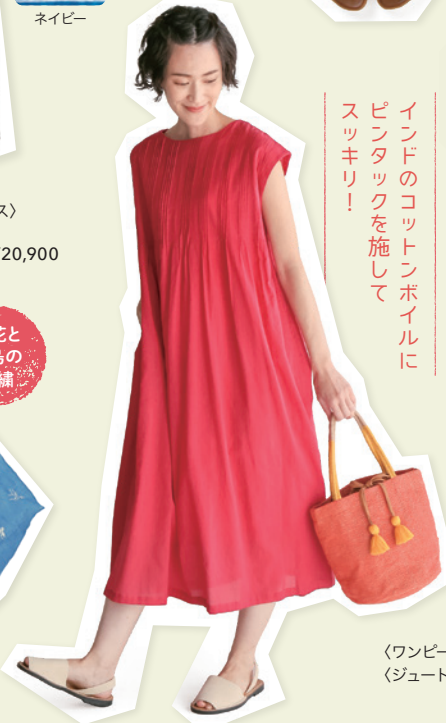
〈ワンピース〉 ¥10,450 〈ジュートバッグ〉 ¥7,150