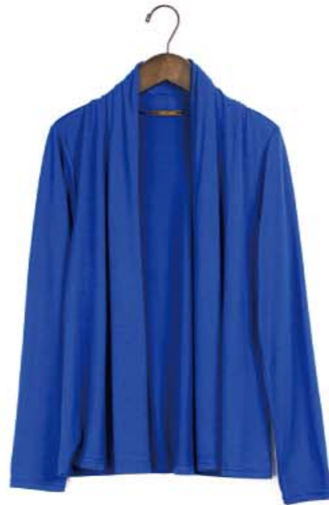
レーヨンガーゼ天竺 カーディガン 140849-462

¥6,400(税別) polyester 62% rayon 33% polyurethane 5% バスト84cm 着丈58cm