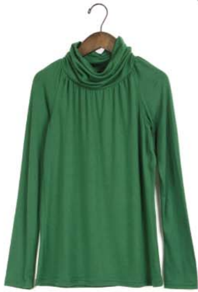
レーヨンガーゼ天竺 タートルプルオーバー 140849-460

¥6,000(税別) polyester 62% rayon 33% polyurethane 5% バスト88cm 着丈59cm