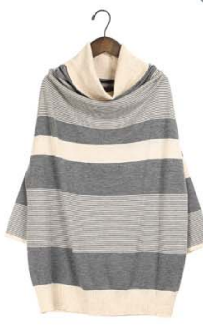
ポーターニット オフタートルチュニック 140912-466

¥7,800(税別) polyester 54% nylon 20% acrylic 20% wool 6% 着丈78cm