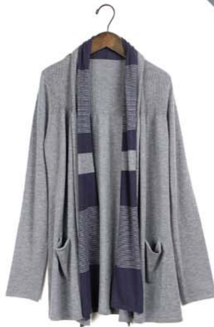
ポーターニット レイヤーカラーカーディガン 140912-465

¥9,800(税別) polyester 54% nylon 20% acrylic 20% wool 6% バスト85cm 着丈72cm