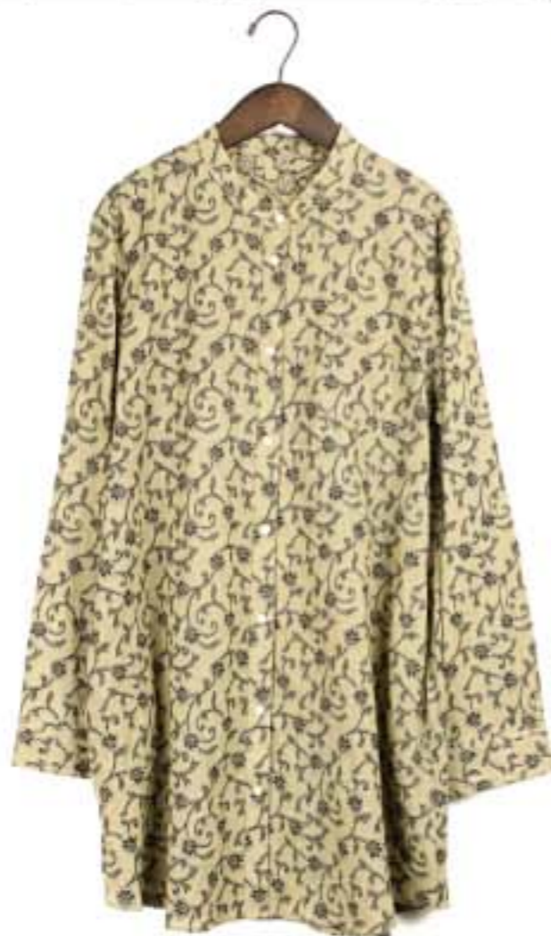
ジャガードコットン ロングシャツ 140902-401

¥8,800(税別) cotton 70% polyester 30% バスト108cm 着丈84cm