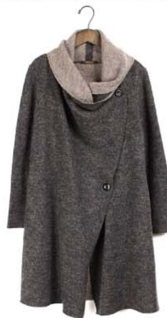
二重白縮絨ニット コート 141020-464