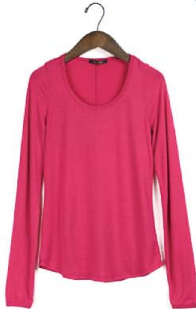
レーヨンガーゼ天竺 プルオーバー 140849-461

¥6,000(税別) polyester 62% rayon 33% polyurethane 5% バスト83cm 着丈62cm