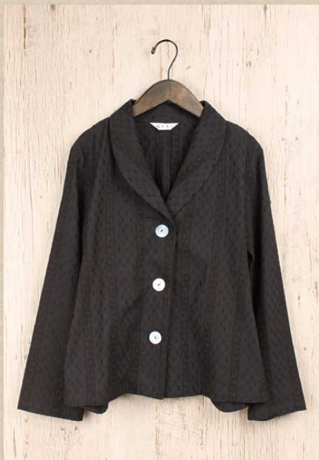
グリッド刺繍 シヨールカラージャケット 120901-406

※120901-404 と 120901-405 は M.L の 2 サイズ 有ります。