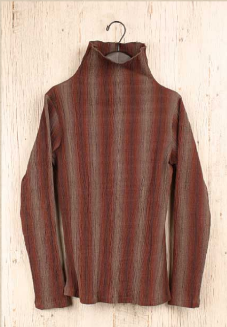
ストレッチ楊柳 プルオーバー