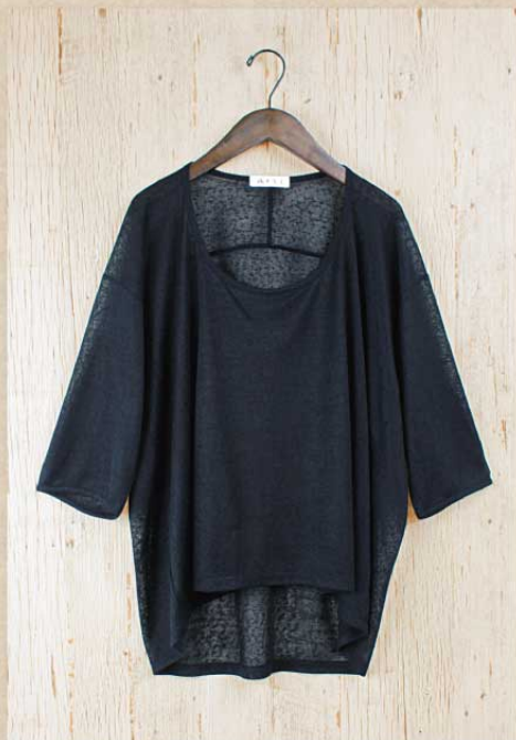
スラブニット プルオーバー 120720-001

¥4,200(本体) ¥4,410(税込) rayon 65% polyester 35% 着丈 74cm