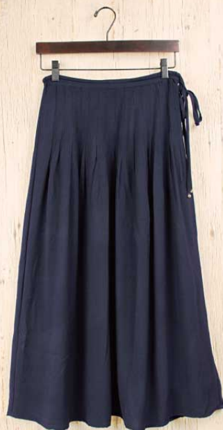
ソリッドボスキー タックスカート 120811-136

¥8,800(本体) ¥9,240(税込) rayon 100% ウエスト 80cm スカート丈 82cm