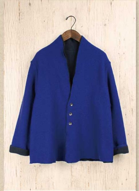
リバーシブル縮絨 カーディガン 121115-073 ¥16,500(本体) ¥17,325(税込) wool 100% 着丈 60cm