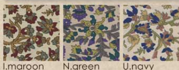
l.maroon N.green U.navy