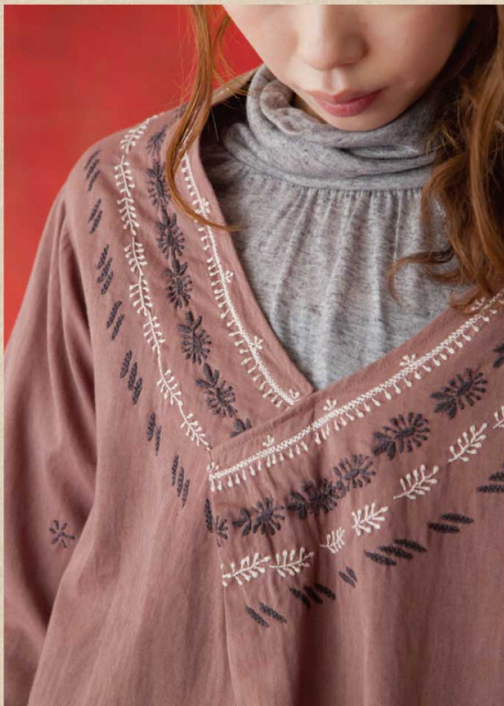
120902-016 D.beige ラクノウ刺繍 チュニック ¥11,000(本体) ¥11,550(税込)