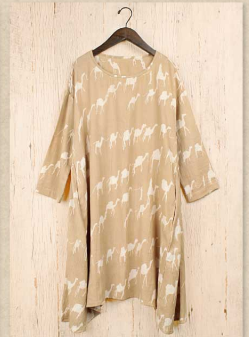
キャラバンプリント ドレス 120835-084 ¥6,800(本体) ¥7,140(税込) cotton 100% 着丈 90cm