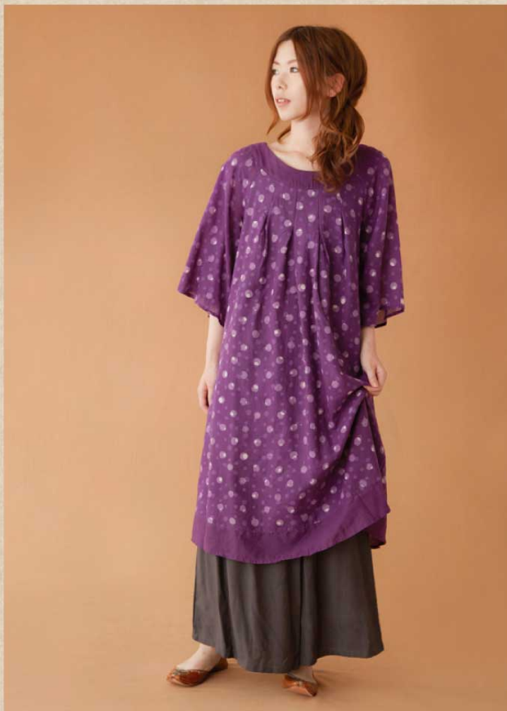
120725-068 L.purple ドットブロックプリント ドレス ¥6,400(本体) ¥6,720(税込) (p.19) 120811-137 Q.gray ソリッドボスキーワイドパンツ ¥6,300(本体) ¥6,615(税込)