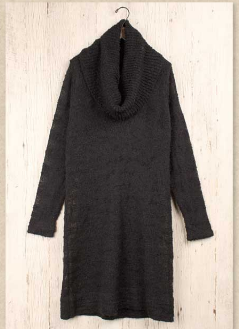
リングモヘヤ チュニック 120920-434 ¥11,000 (本体) ¥11,550 (税込) acrylic 67% wool 22% mohair 11% バスト104cm 着丈 88cm