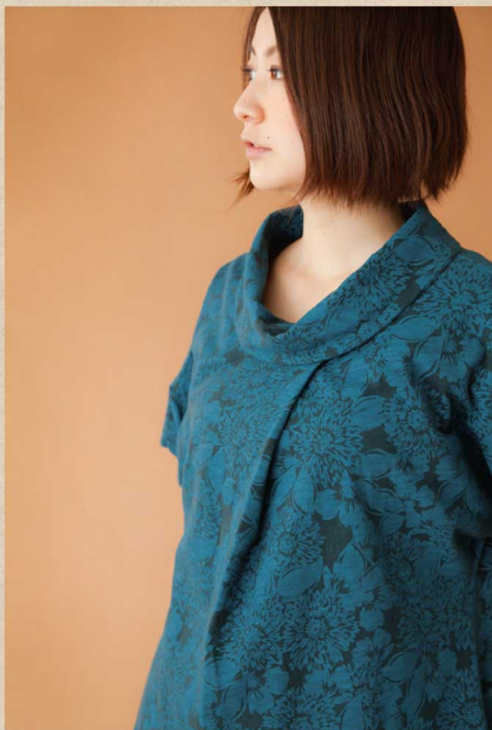
120808-128 O.blue 綿スラブ天竺プリント ドレス ¥5,800(本体) ¥6,090(税込)