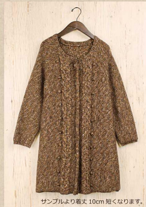
サンプルより着丈 10cm 短くなります。