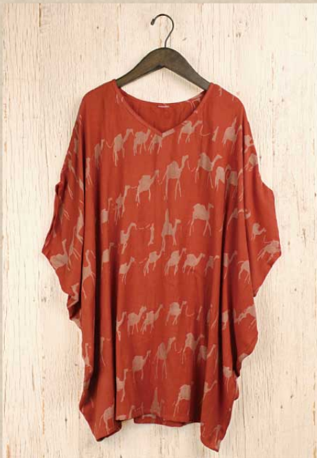
キャラバンプリント ビッグプルオーバー 120835-081 ¥5,800(本体) ¥6,090(税込) cotton 100% 着丈 75cm