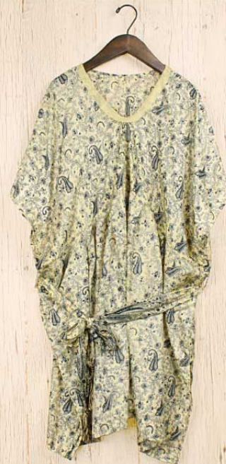
アソートサリー ビッグチュニック 120802-036

¥7,600(本体) ¥7,980(税込) polyester 100% 着丈 85cm