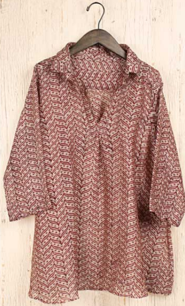
シルクブロックプリント スキッパーシャツ 120814-454

¥12,000(本体) ¥12,600(税込) silk 100% バスト100cm 着丈69cm