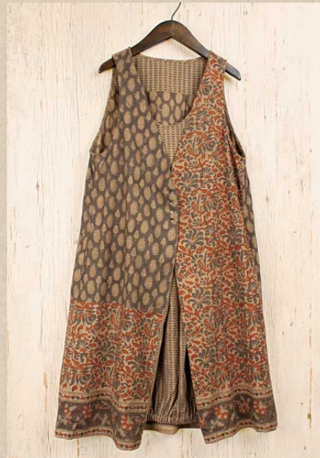
パッチブロックプリント ノースリーブドレス