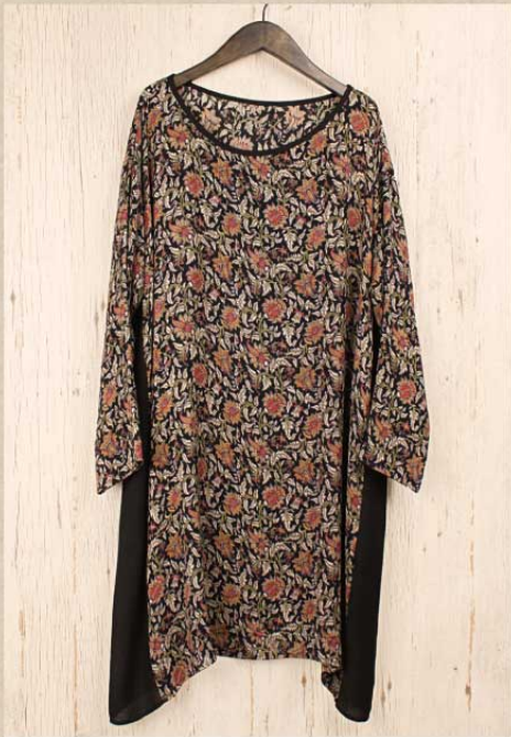
フラワーバンブー スクエアチュニック