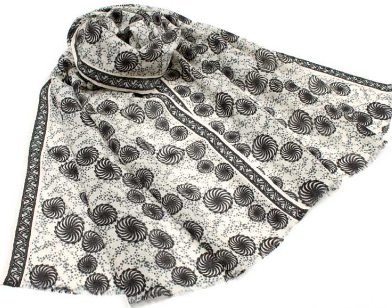
ウールコットンジャガードエッチ うず巻柄ショール BL120901-521 C.natural / ¥8,200(本体) ¥8,610(税込) / 60×170cm / wool 90% cotton 10%