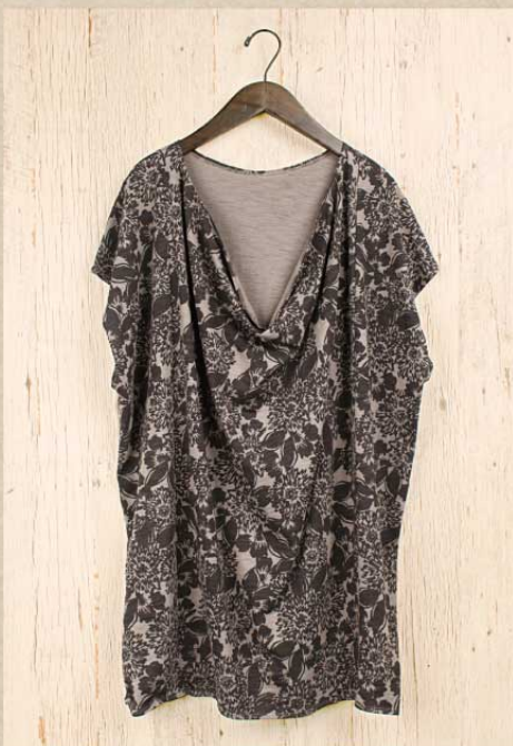
綿スラブ天竺プリント ドレープチュニック 120808-126 ¥4,800(本体) ¥5,040(税込) cotton 100% 着丈 80cm