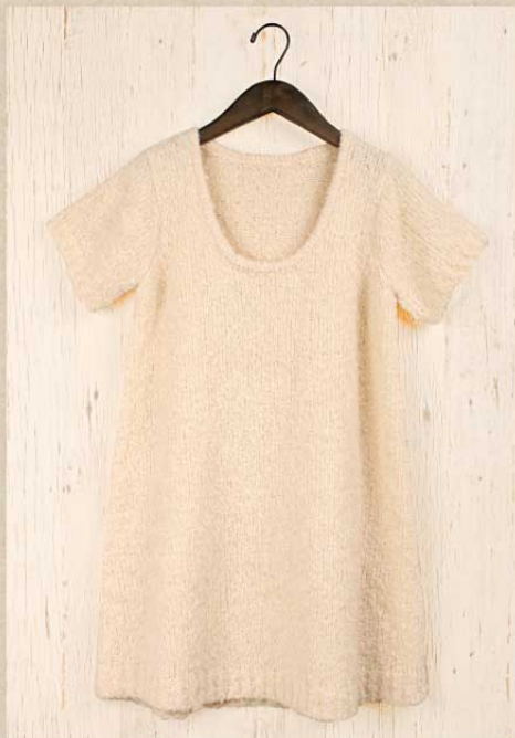
リングヤーン チュニック 120912-181

¥8,500(本体) ¥8,925(税込) acrylic 57% wool 20% nylon 13% mohair10% 着丈 75cm