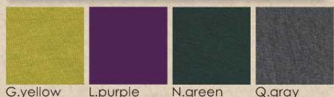
G.yellow L.purple N.green Q.gray