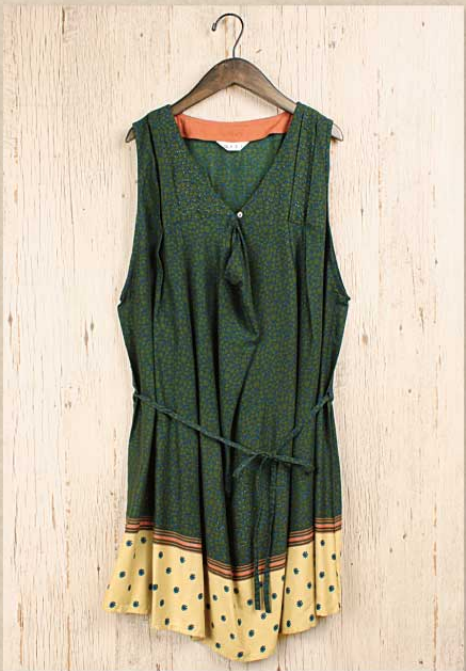
ドットフラワープリント ノースリーブチュニック 120701-006

¥6,200(本体) ¥6,510(税込) rayon 100% 着丈 80cm