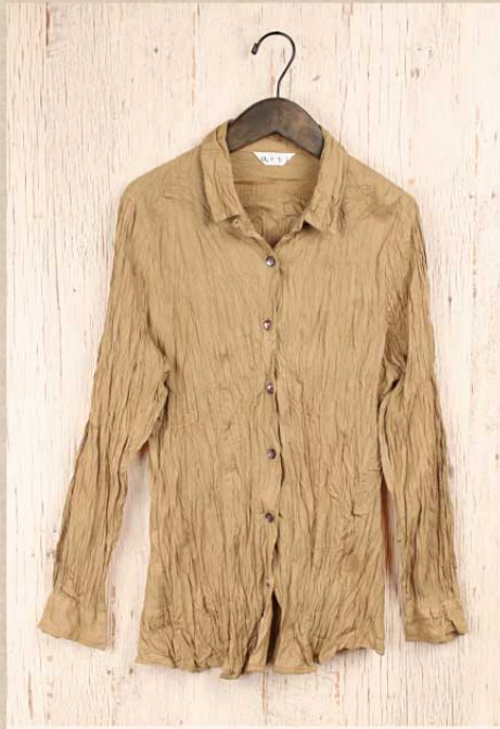
オーガニックドビー オープンカラーシャツ 120801-408

¥6,800(本体) ¥7,140(税込) cotton 100% バスト104cm 着丈69cm