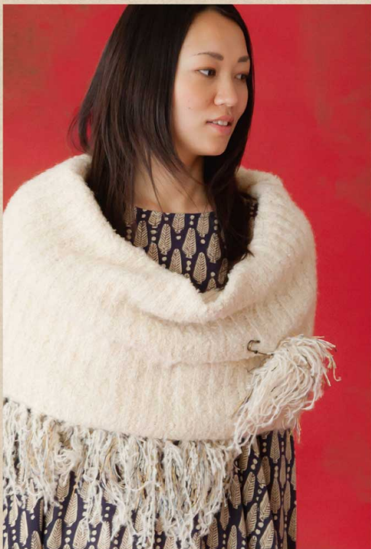
120912-184 C.natural リングヤーンケープ ¥5,800(本体) ¥6,090(税込)