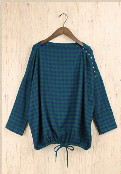
チェック刺繍 プルオーバー 120902-106

¥6,800(本体) ¥7,140(税込) cotton 100% 着丈 65cm