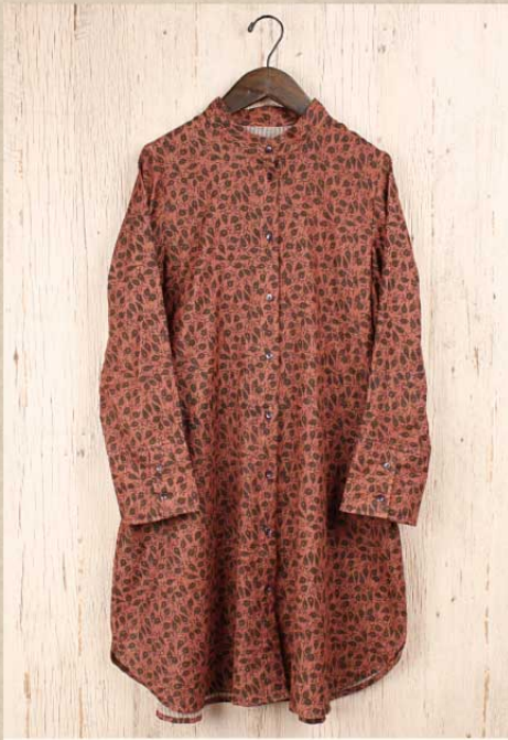
ダブルガーゼプリント コートワンピース