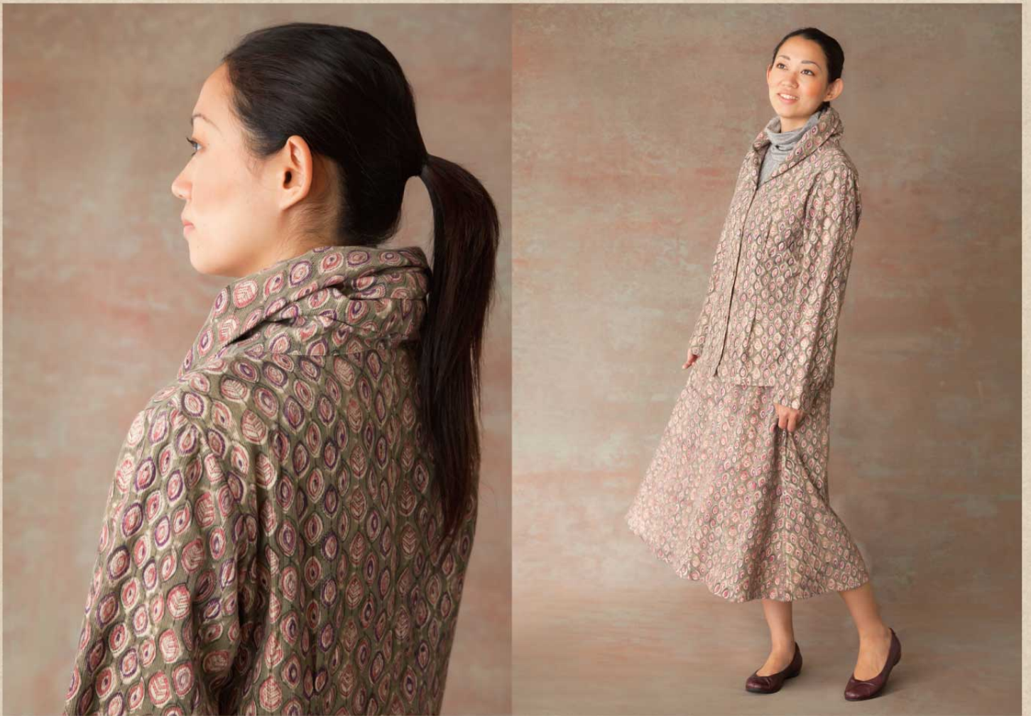
左右写真共通 121025-427 N.green リーフコーデロイジャケット ¥7,500(本体) ¥7,875(税込) (p.15) 121020-459 Q.gray ウールジャージー パフショルダープルオーバー ¥4,800(本体) ¥5,040(税込) 121025-429 N.green リーフコーデロイフレアスカート ¥6,800(本体) ¥7,140(税込)