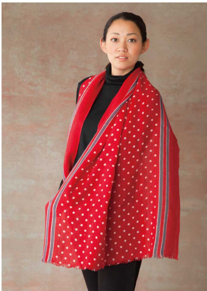
BL120901-518 l.red ウールシルク ドットプリントショール ¥8,000(本体) ¥8,400(税込)