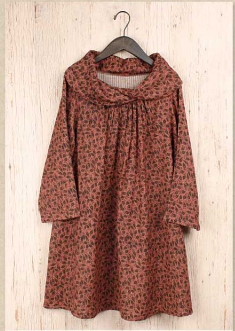
ダブルガーゼプリント チュニック