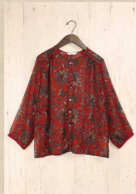
シフォンプリント ブラウス 120801-064