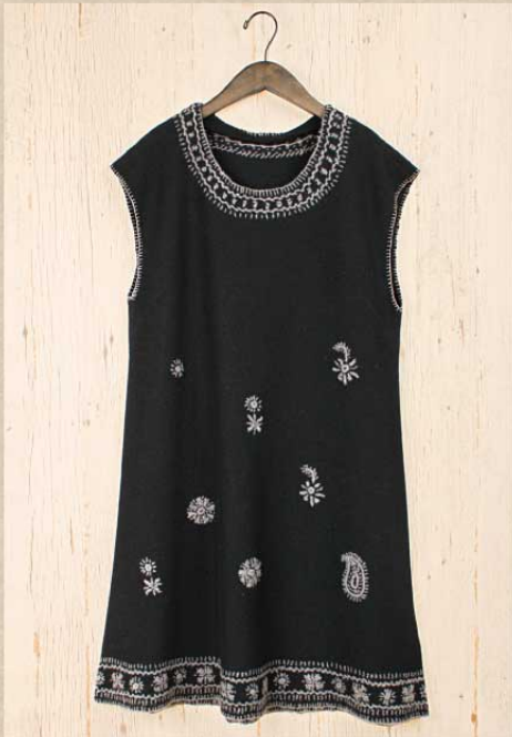
刺繍縮絨 チュニック 121120-205

¥16,800(本体) ¥17,640(税込) wool 100% バスト 93cm 着丈 90cm