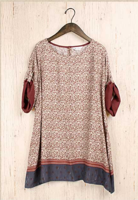
ドットフラワープリント ドルマンプルオーバー 120701-005

¥5,800(本体) ¥6,090(税込) rayon 100% 着丈 72cm