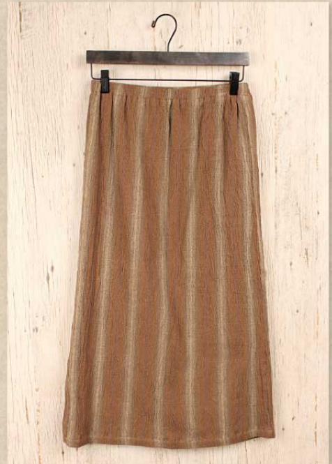
ストレッチ楊柳 スカート