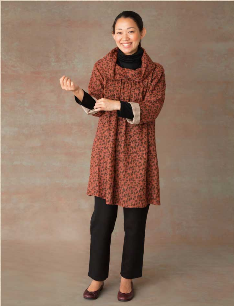
(p.17) 120802-403 H.orange ダブルガーゼプリント チュニック ¥7,200(本体) ¥7,560(税込) 120938-447 B.black スラブボトム レギュラーパンツ ¥9,800(本体) ¥10,290(税込)