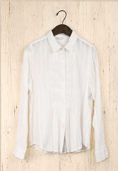
オーガニックドビー ピントックシャツ 120801-409

オーガニックドビーのシリーズは クリンクル加工で、独特なシワ感 をプラスしています。