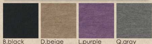
B.black D.beige L.purple Q.gray