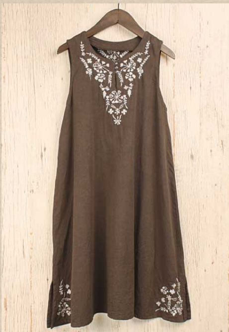
刺繍アシッドウォッシュ ノースリーブチュニック 120902-112 ¥8,500(本体) ¥8,925(税込) cotton 100% 着丈 100cm