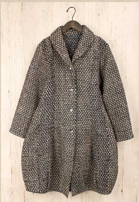
ボンディングキルト コクーンコート