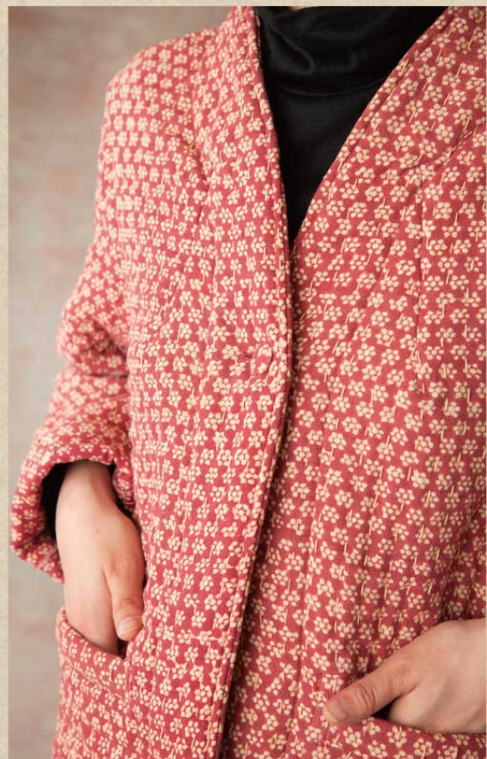
121025-442 l.red ボンディングキルト ジャケット ¥12,800(本体) ¥13,440(税込)