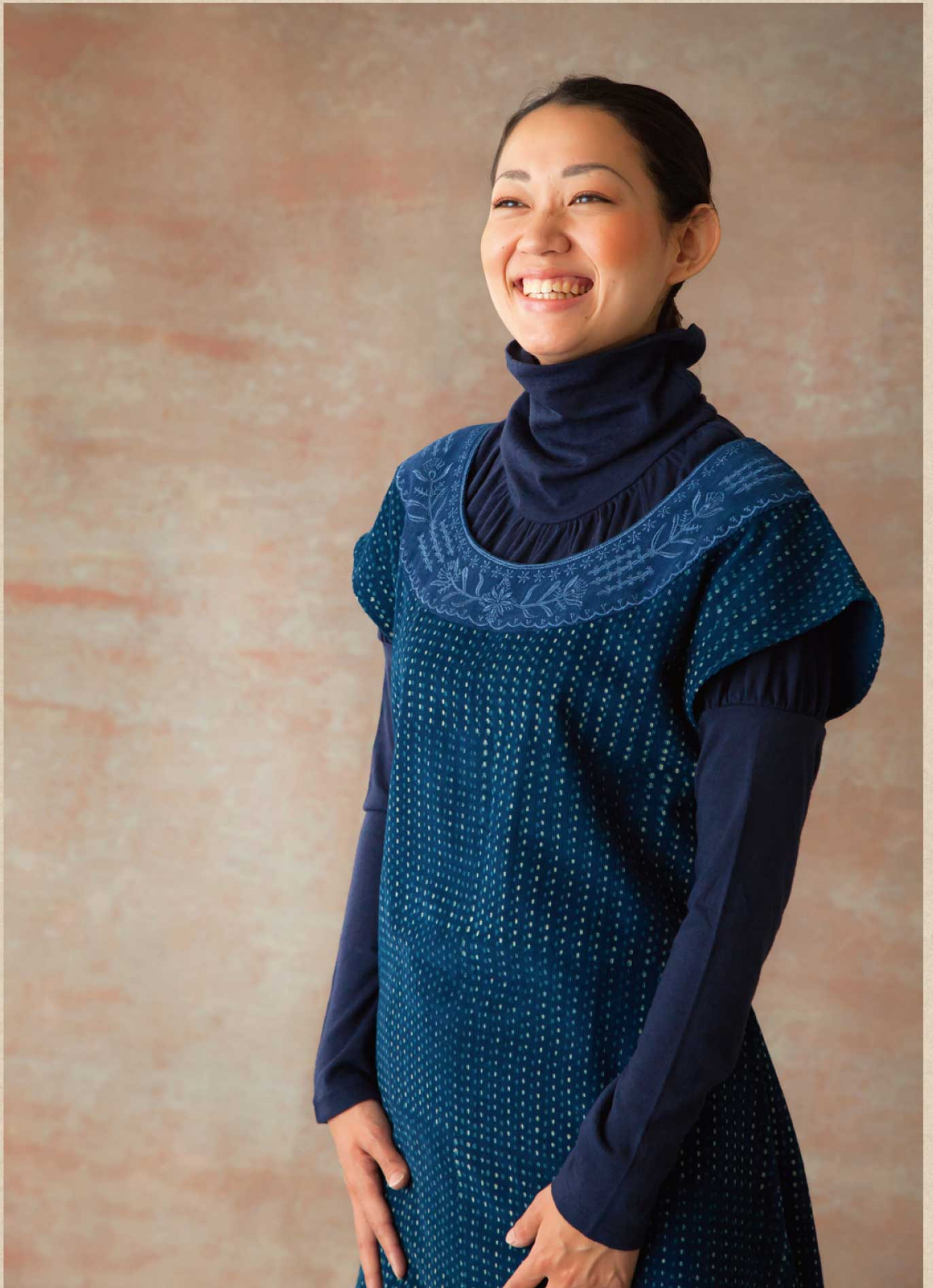
(p.13) 121025-431 U.navy ドットコーデュロイ チュニック ¥6,800(本体) ¥7,140(税込) (p.15) 121020-459 U.navy ウールジャージー パフショルダーダブルオーバー ¥4,800(本体) ¥5,040(税込)