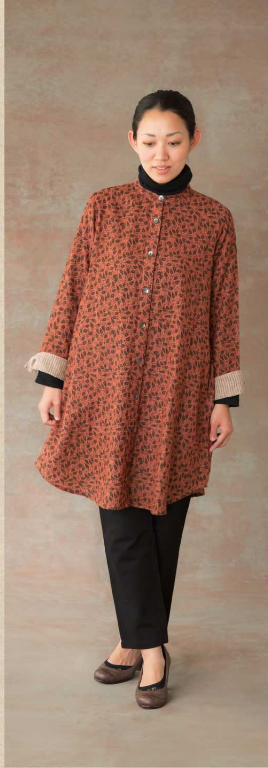
(p.17) 120802-402 H.orange ダブルガーゼプリント コートワンピース ¥7,500(本体) ¥7,875(税込) 120938-447 B.black スラブボトム レギュラーパンツ ¥9,800(本体) ¥10,290(税込)