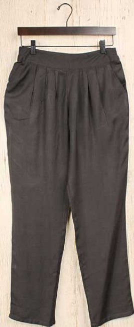
ソリッドボスキー テーパーパンツ 120811-135

¥6,500(本体) ¥6,825(税込) rayon 100% ウエスト 72cm 脇丈 93cm