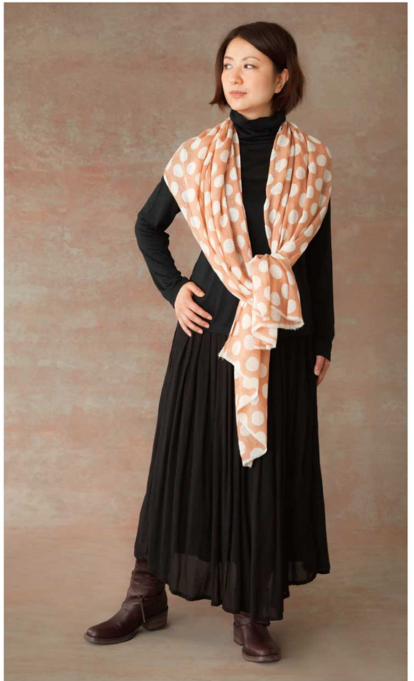
左右写真ともに BL121001-504 J.pink ウール ビッグドット柄ショール ¥7,200(本体) ¥7,560(税込)