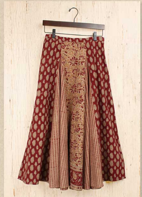
パッチブロックプリント フレアスカート