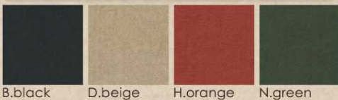
B.black D.beige H.orange N.green