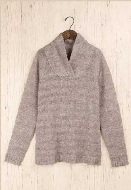
リングモヘヤ セーター