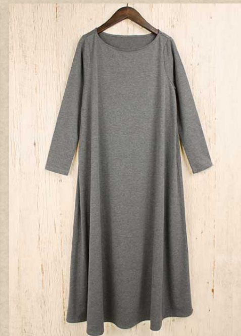
T/R 無地カットソー ワンピース