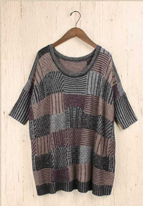
ボーダーブロックニット プルオーバー 120912-144 ¥9,800(本体) ¥10,290(税込) acrylic 70% wool 30% 着丈 68cm