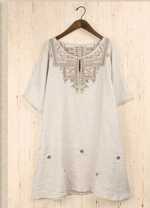
リネンマドバニ刺繍 ドレス 120816-158 ¥8,800(本体) ¥9,240(税込) linen 100% 着丈 88cm