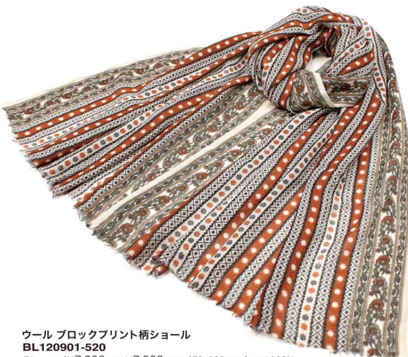
ウール ブロックプリント柄ショール BL120901-520

E.brown / ¥7,200(本体) ¥7,560(税込) / 70×180cm / wool 100%