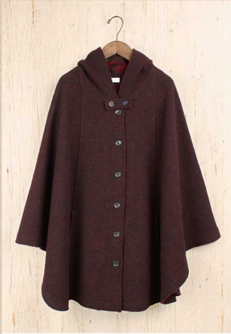
圧縮ニット マントコート 121120-161 ¥23,000(本体) ¥24,150(税込) wool 100% 着丈 70cm