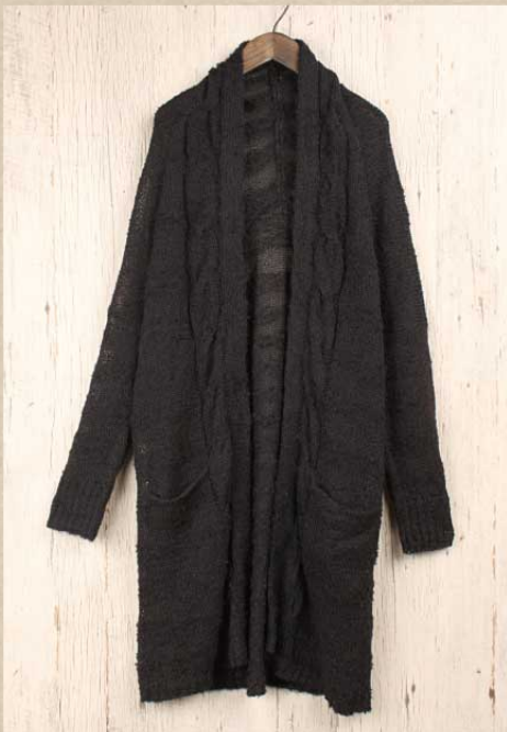
リングモヘヤ カーディガン