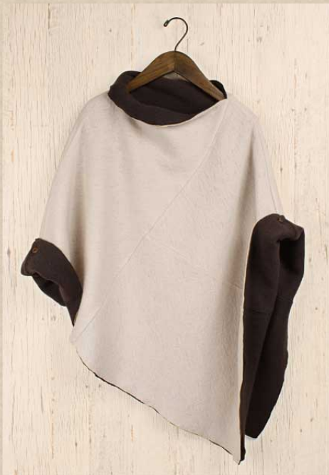
リバーシブル縮絨 ポンチョ 121115-074 ¥18,000(本体) ¥18,900(税込) wool 100% 着丈 67cm