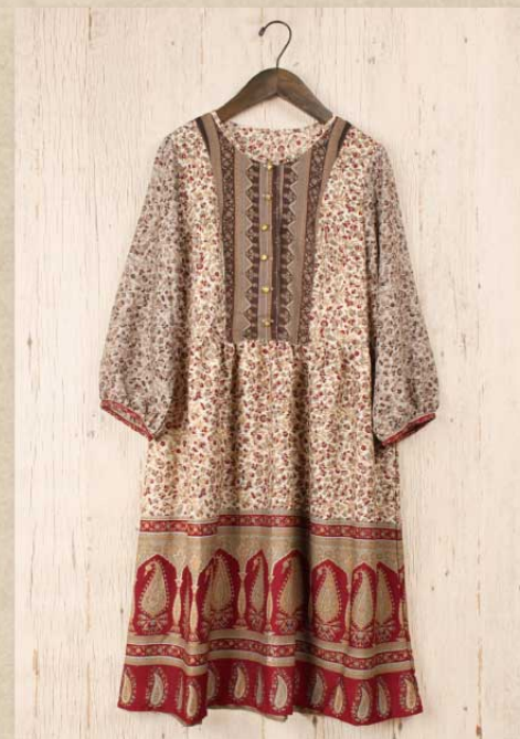
サリープリント ドレス 120902-124 ¥7,800(本体) ¥8,190(税込) polyester 100% 着丈 95cm