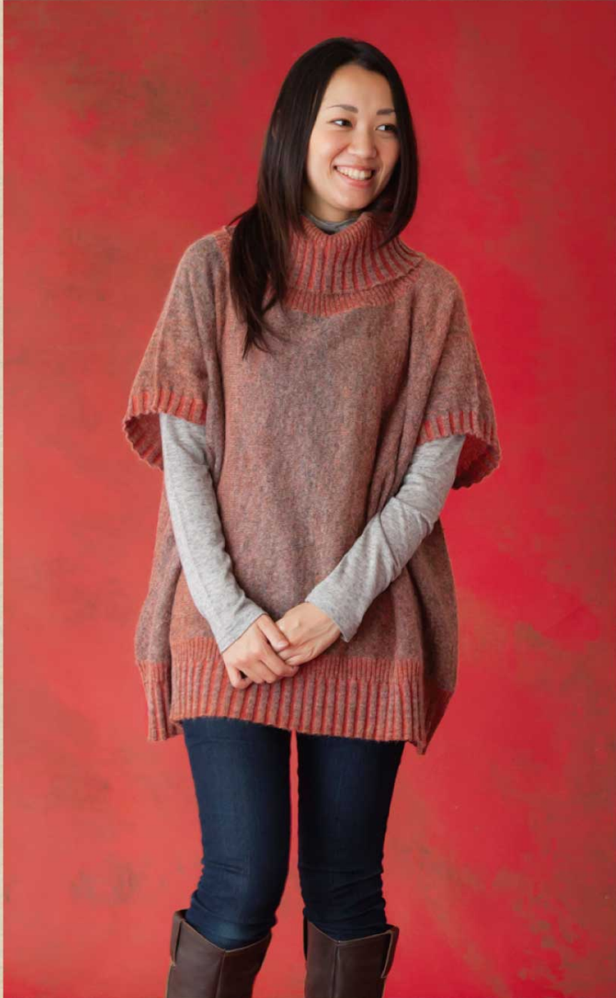
(p.33) 120812-177 H.orange グラデーションモヘヤ プルオーバー ¥9,500(本体) ¥9,975(税込)