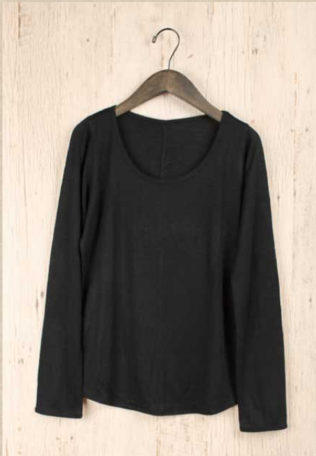
ウールジャージー ラウンドネックプルオーバー 121020-458

¥4,200(本体) ¥4,410(税込) wool 50% acrylic 50% バスト86cm 着丈60cm