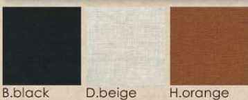
B.black D.beige H.orange