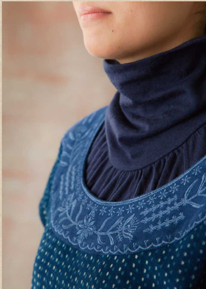
121020-459 U.navy ウールジャージー パフショルダープルオーバー ¥4,800(本体) ¥5,040(税込) (p.13) 121025-431 U.navy ドットコーデュロイチュニック ¥6,800(本体) ¥7,140(税込)