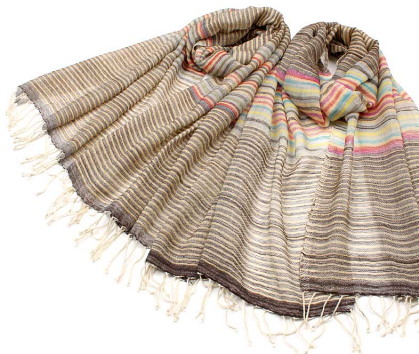
ウール ボーダー柄ショール BL121001-503 左から O.blue Z.mix / ¥6,800(本体) ¥7,140(税込) / 60×180cm / wool 100%