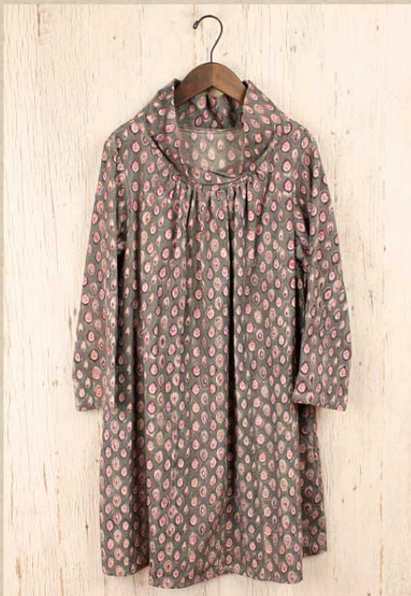
リーフコーデロイ ワンピース 121025-428 ¥7,800(本体) ¥8,190(税込) cotton 100% バスト120cm 着丈83cm