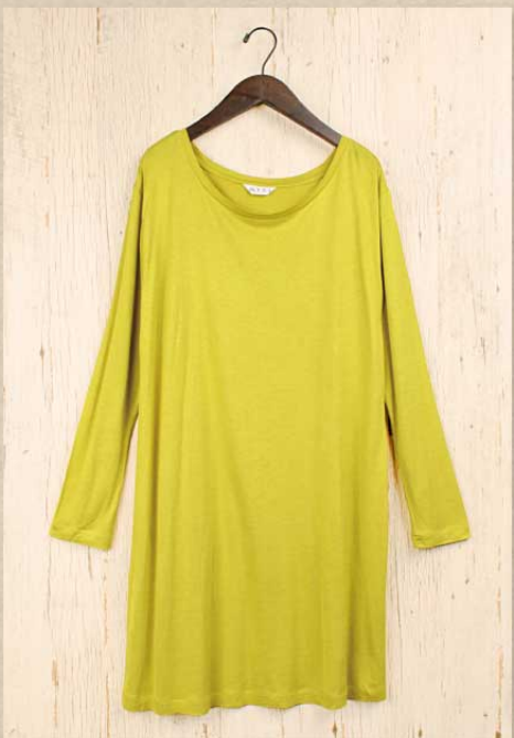
T/C カットソー 長袖チュニック 120820-153

¥5,200(本体) ¥5,460(税込) cotton 55% polyester 45% 着丈 72cm