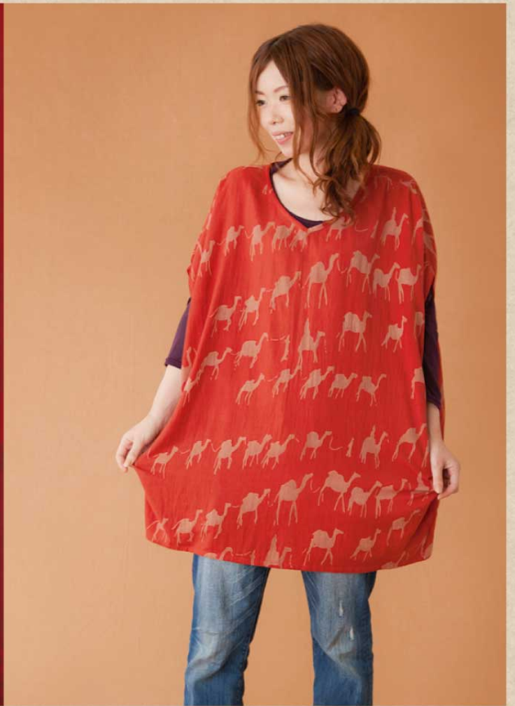
120835-081 H.orange キャラバンプリント ビッグプルオーバー ¥5,800(本体) ¥6,090(税込)