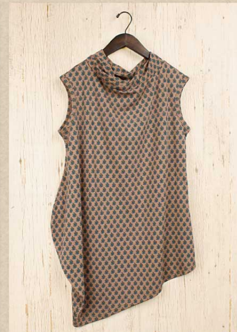
T/C 小花プリント ドレープチュニック