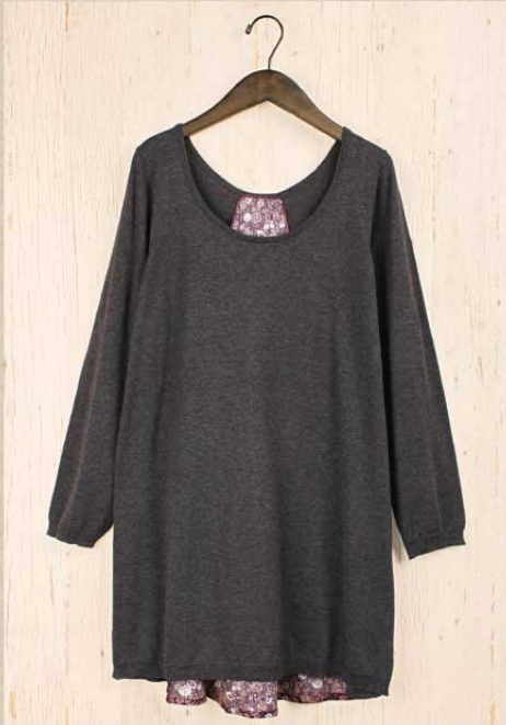
小花パッチニット チュニック 120813-212 ¥12,000(本体) ¥12,600(税込) cotton 100% 着丈 80cm