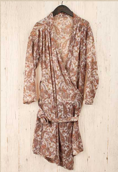
ウールペイズリー ラップワンピース 121002-450

¥17,000(本体) ¥17,850(税込) wool 100% バスト108cm 着丈95cm