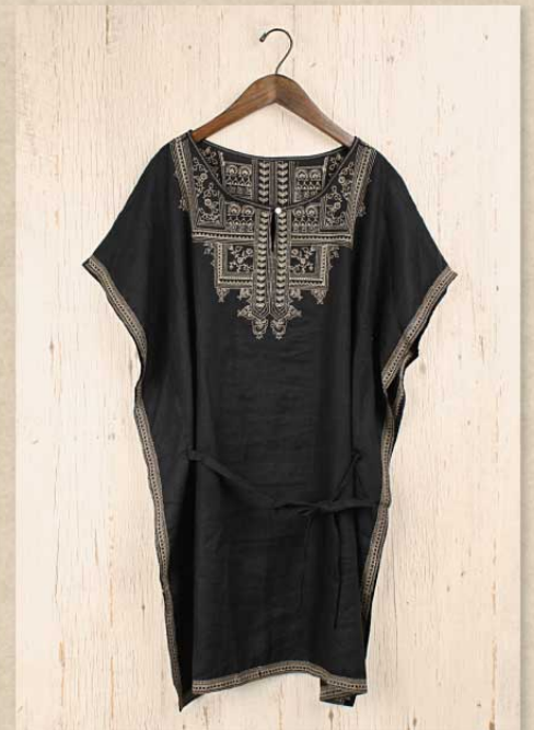
リネンマドバニ刺繍 ポンチョ 120816-159 ¥8,900(本体) ¥9,345(税込) linen 100% 着丈 73cm