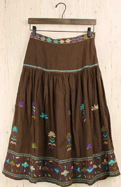
バルメール刺繍 スカート 〈ブラウン〉