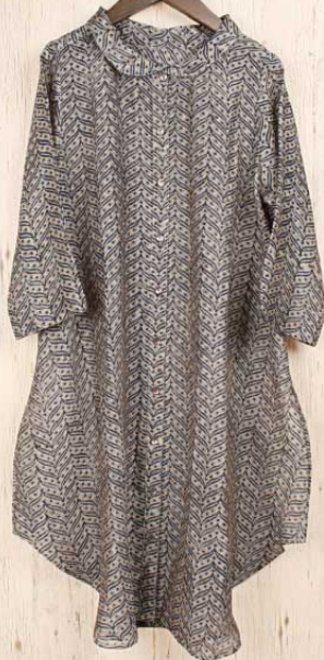
シルクブロックプリント シャツワンピース 120814-456

¥14,000(本体) ¥14,700(税込) silk 100% バスト100cm 着丈98cm