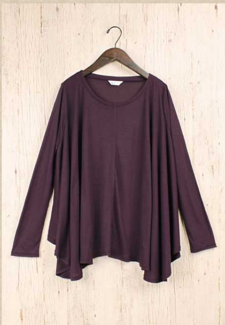
T/C カットソー フレアプルオーバー 120820-151

¥5,600(本体) ¥5,880(税込) cotton 55% polyester 45% 着丈 63cm