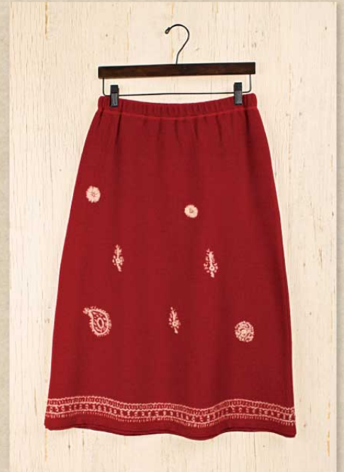
刺繍縮絨 ロングスカート 121120-207

¥14,800(本体) ¥15,540(税込) wool 100% ウエスト 68cm スカートの丈 65cm