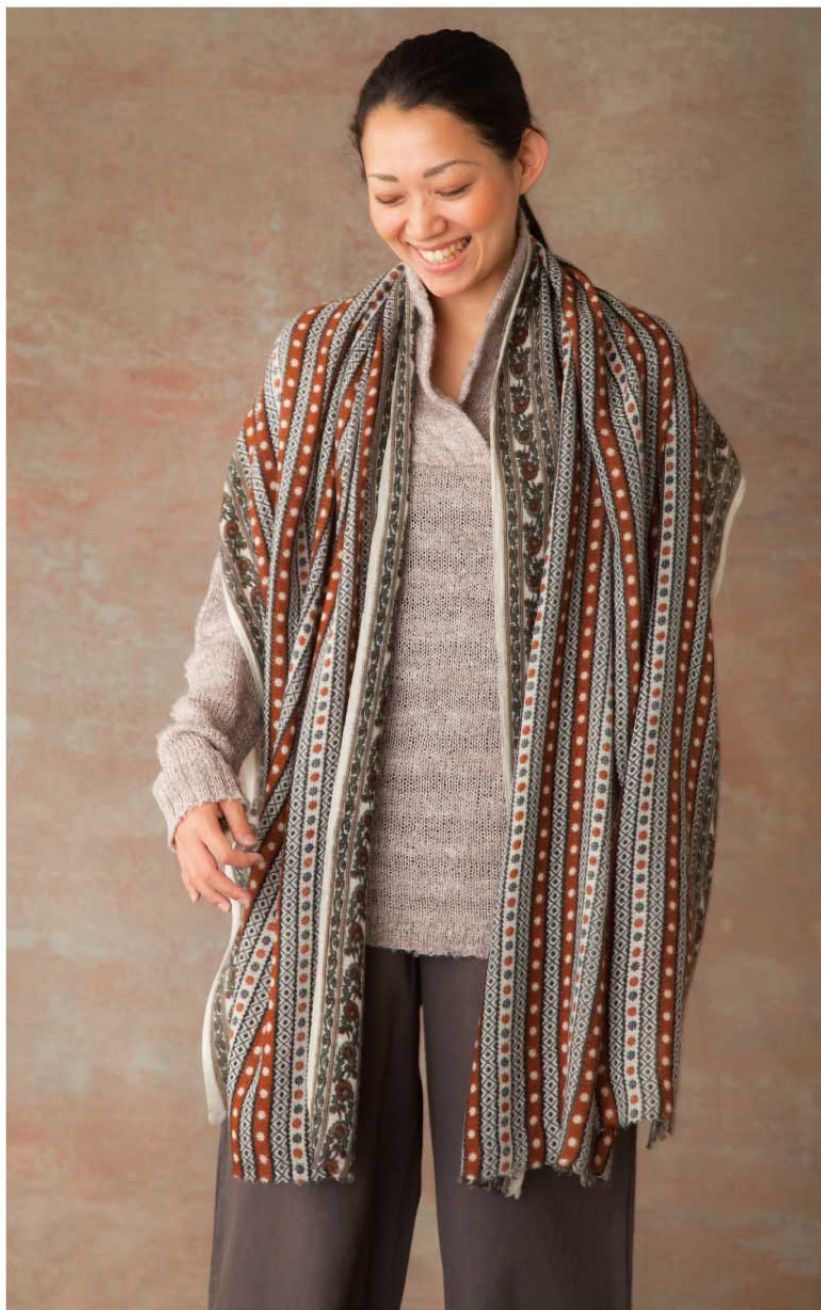
BL120901-520 E.brown ウール ブロックプリント柄ショール ¥7,200(本体) ¥7,560(税込)