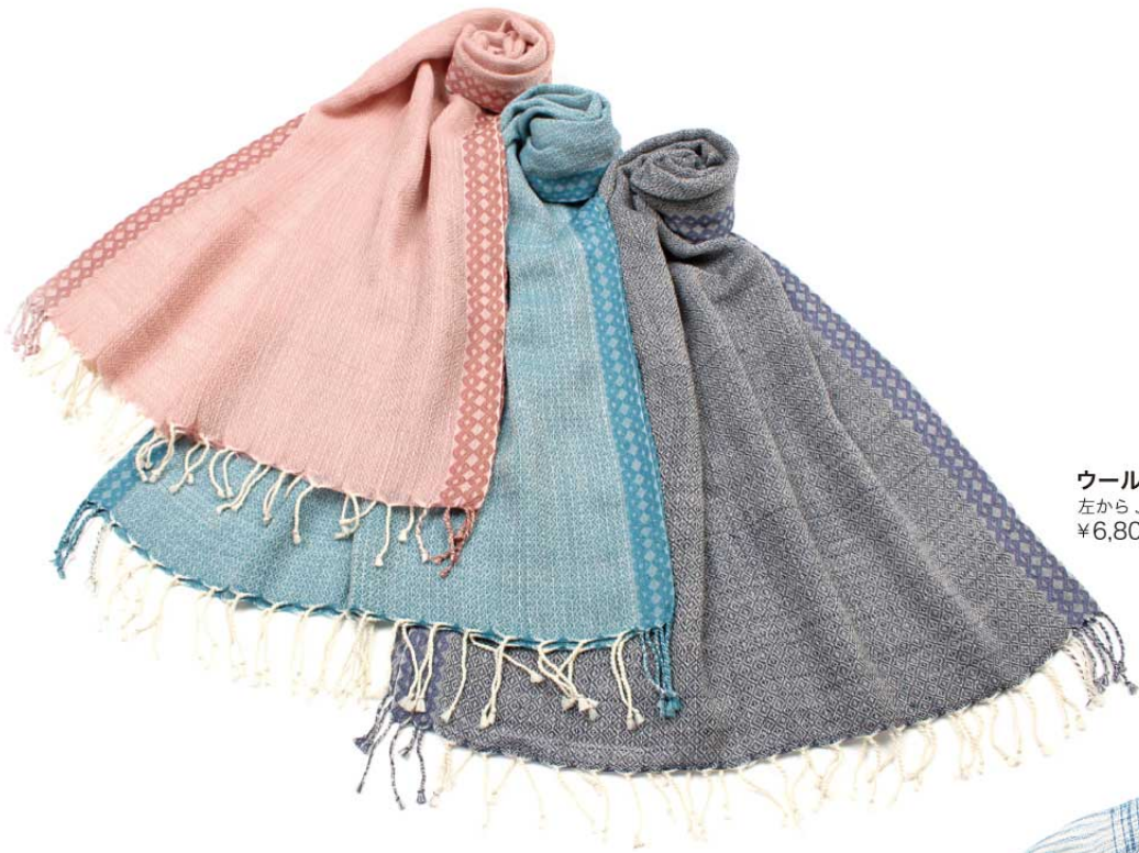
ウール 織柄ショール BL121001-502 左から J.pink O.blue Q.gray ¥6,800(本体) ¥7,140(税込) / 60×175cm / wool 100%