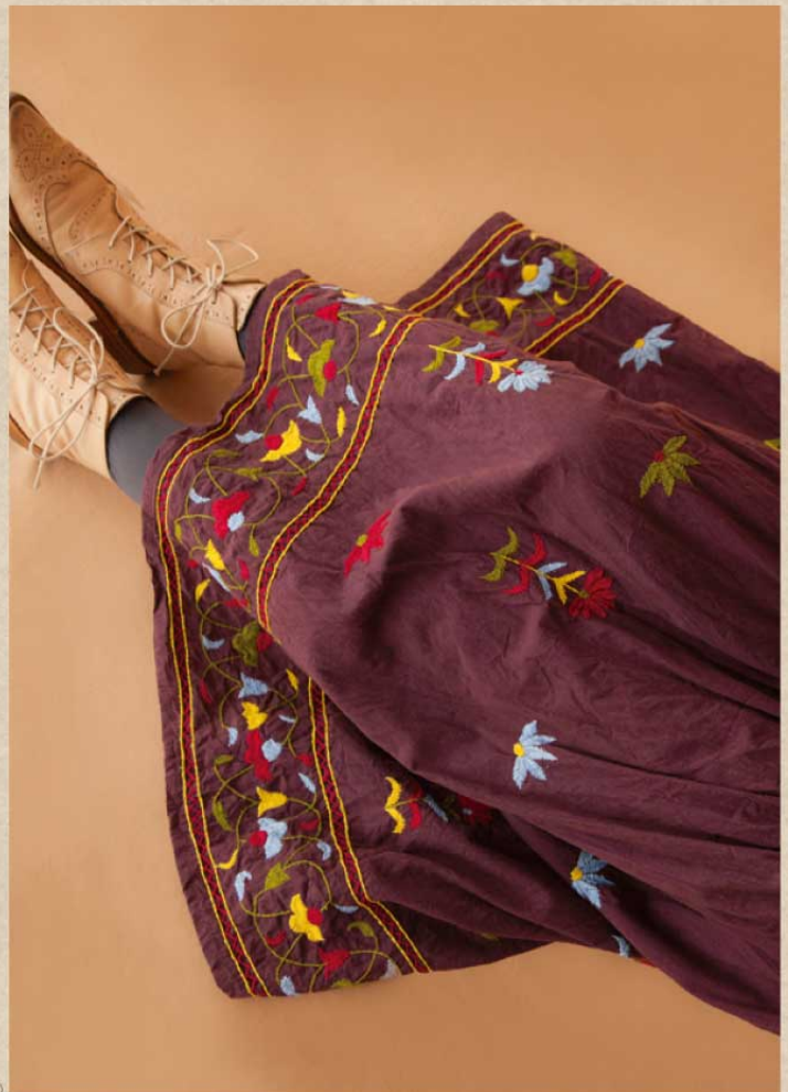
(p.15) 120904-048 L.purple バルメール刺繍 スカート ¥9,800(本体) ¥10,290(税込)