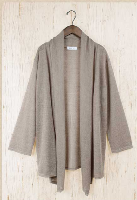
スラブニット カーディガン 120720-003

¥5,200(本体) ¥5,460(税込) rayon 65% polyester 35% 着丈 67cm