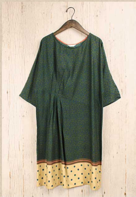
ドットフラワープリント タックドレス 120701-007

¥6,400(本体) ¥6,720(税込) rayon 100% 着丈 90cm