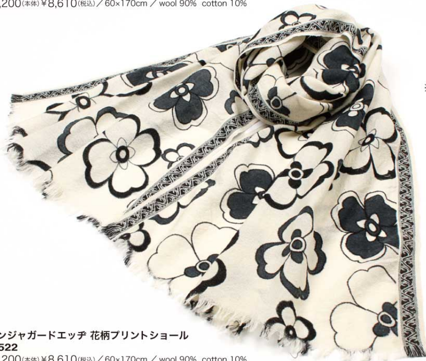
ウールコットンジャガードエッチ 花柄プリントショール BL120901-522 C.natural / ¥8,200(本体) ¥8,610(税込) / 60×170cm / wool 90% cotton 10%

※BL120901-521C 及び BL120901-522C フリンジは 2 cm のツイストフリンジに なります。