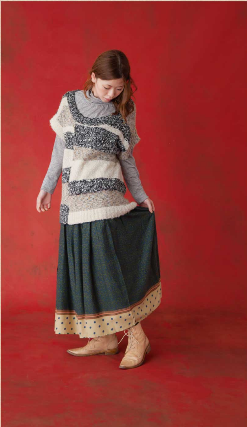
(p.29) 120912-147 B.black ブロッキングニット フレンチフルオーバー ¥8,800(本体) ¥9,240(税込) (p.21) 120701-008 N.green ドットフラワープリント スカート ¥8,800(本体) ¥9,240(税込)