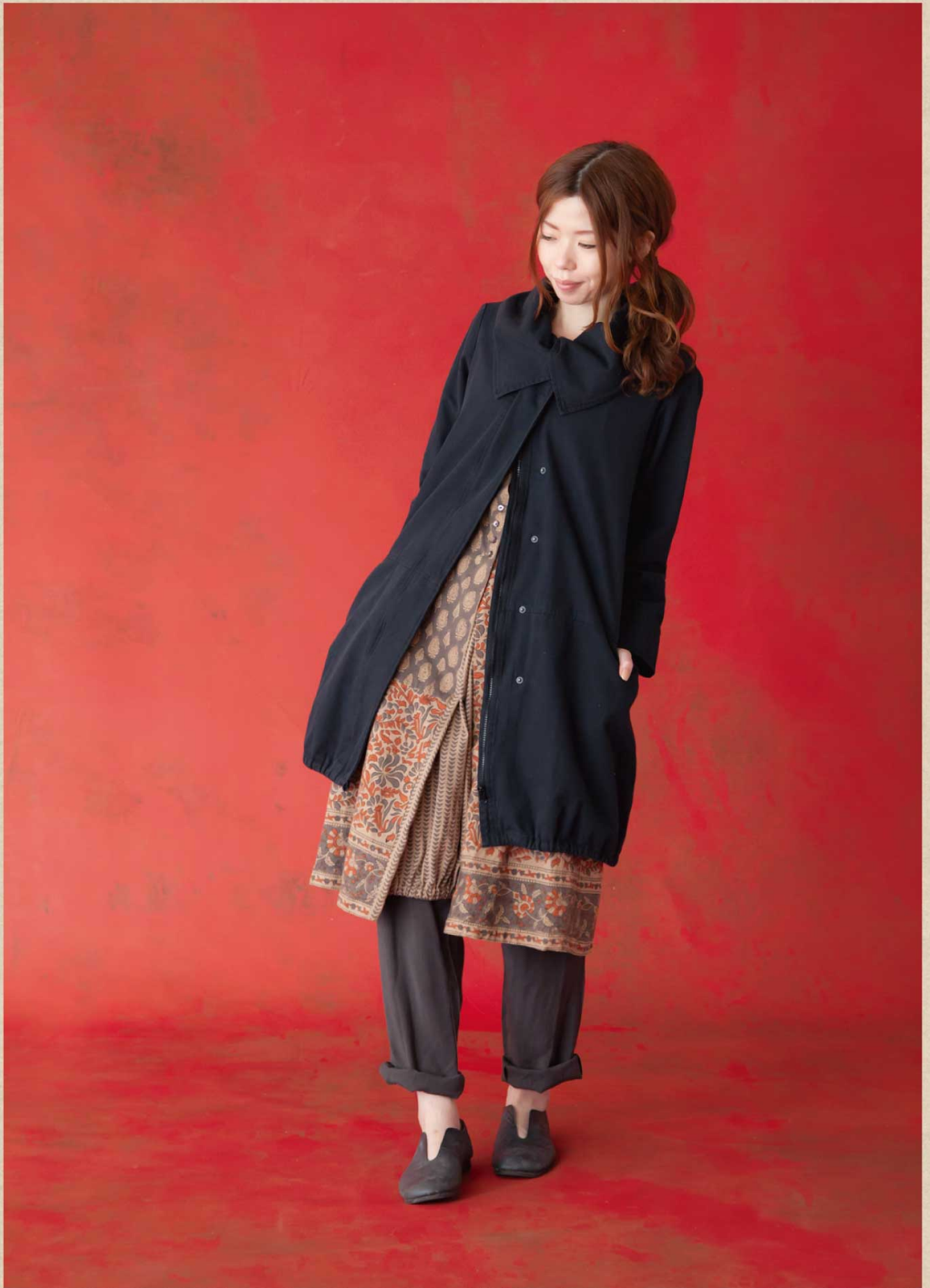
(p.26) 120808-010 B.black ツイルコットン オータムコート ¥12,800(本体) ¥13,440(税込) (p.6) 120925-052 E.brown パッチブロックプリント ノースリーブドレス ¥6,900(本体) ¥7,245(税込)