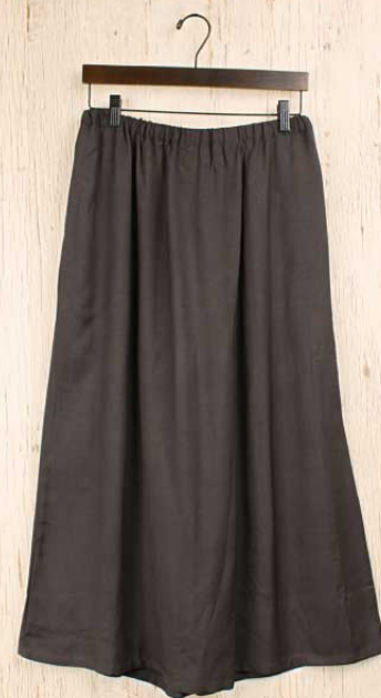
ソリッドボスキー ワイドパンツ 120811-137

¥6,300(本体) ¥6,615(税込) rayon 100% ウエスト 72cm 脇丈 85cm