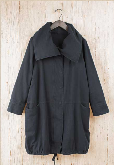
ツイルコットン オータムコート 120808-010 ¥12,800(本体) ¥13,440(税込) cotton 100% バスト102cm 着丈 93cm