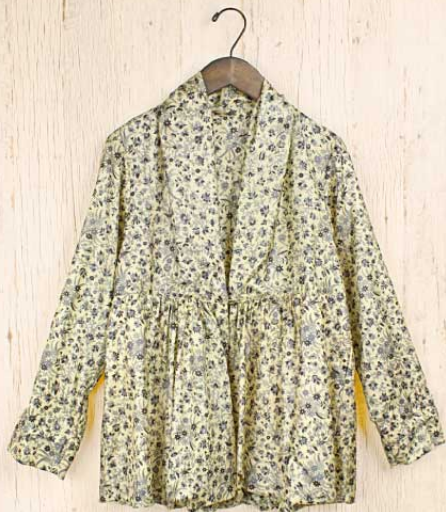
アソートサリー ブラウス 120802-033

¥6,800(本体) ¥7,140(税込) polyester 100% バスト 98cm 着丈 63cm