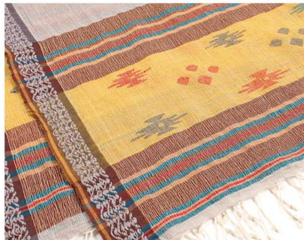
ウールカディコットン ジャムダニシヨール BL121001-510 Q.gray / ¥8,200(本体) ¥8,610(税込) / 70×180cm / wool 60% khadicotton 40%