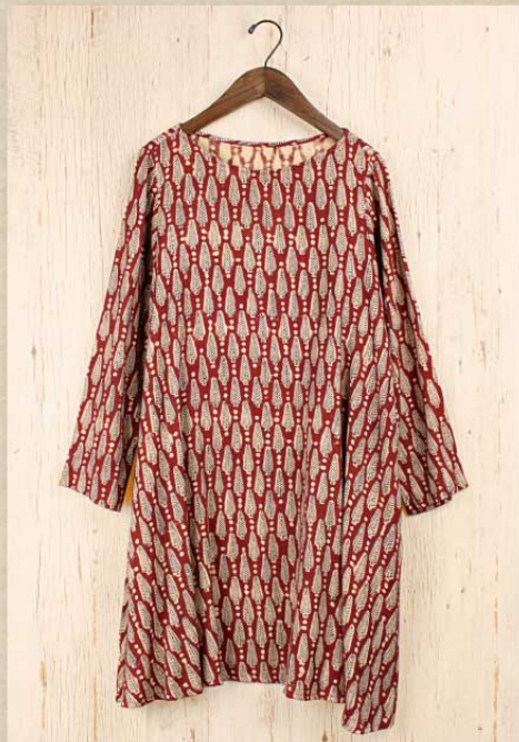
スノーツリーブロックプリント チュニック