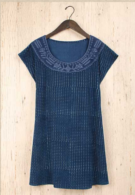
ドットコーデロイ チュニック