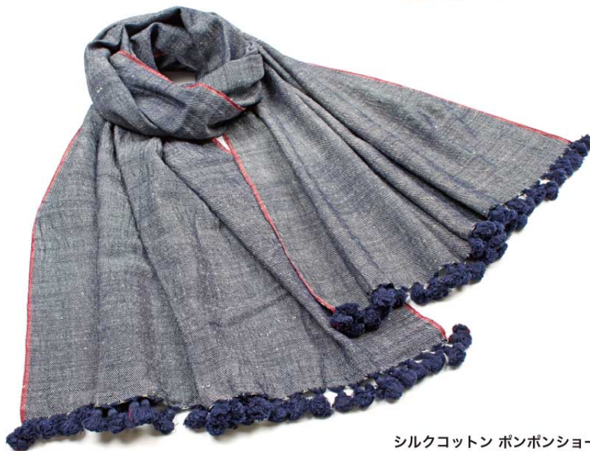
シルクコットン ポンポンショール BL120901-517 P.indigo / ¥6,000(本体) ¥6,300(税込) / 60×170cm / silk 80% cotton 20%