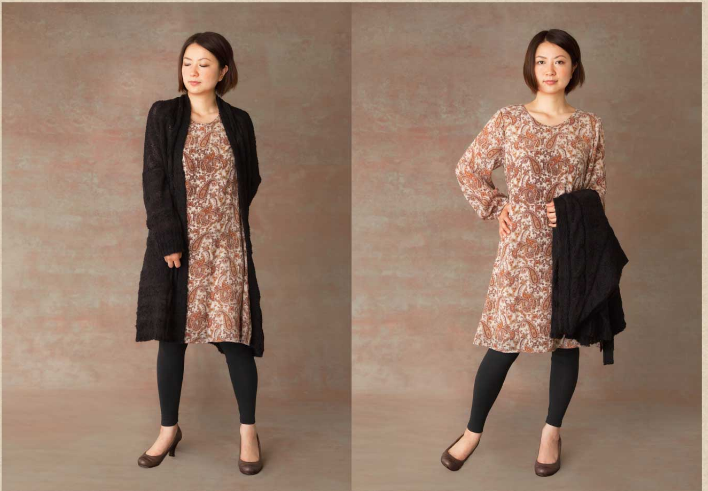
左右写真ともに 121002-451 E.brown ウールペイズリー Aラインワンピース ¥15,000(本体) ¥15,750(税込) (p.11) 120920-435 B.black リングモヘヤカーディガン ¥12,800(本体) ¥13,440(税込)