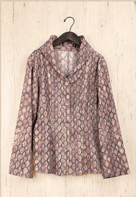
リーフコーデロイ ジャケット 121025-427 ¥7,500(本体) ¥7,875(税込) cotton 100% バスト99cm 着丈58cm