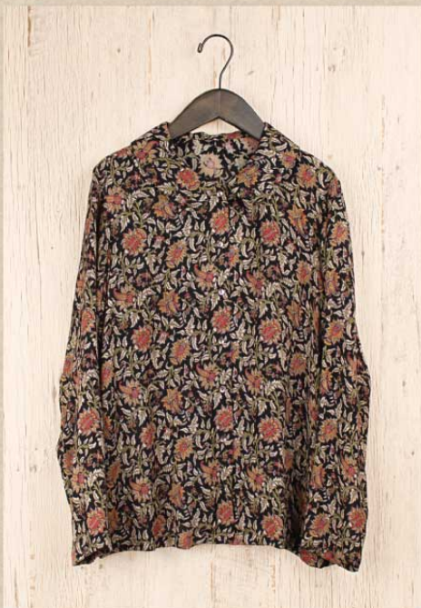
フラワーバンブー ラウンドカラーブラウス

この製品は日本での表記の都合上、レーヨンとなっていますが実際の素材はバンブー 100%です。 バンブーは夏に涼しく冬に暖かく気温に対応する特徴を持っています。 肥料も使わず少しの水だけで自然に育ちその生育は世界で一番早いと言われています。