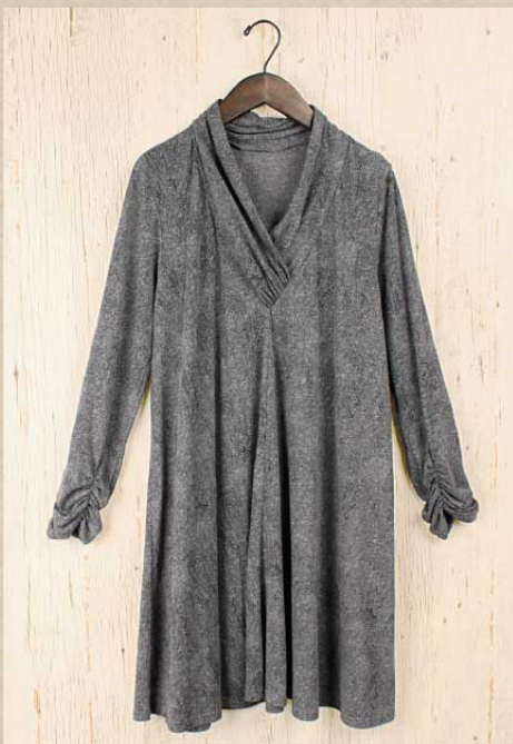
T/L ペイズリープリント ワンピース 120822-026

¥6,800(本体) ¥7,140(税込) polyester 85% linen 15% 着丈 85cm