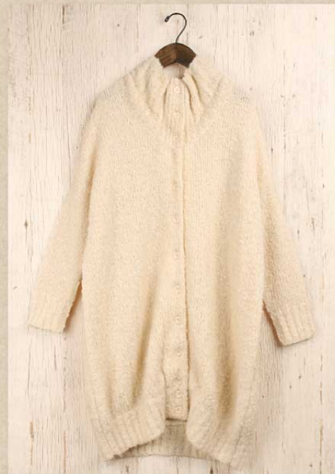
リングヤーン カーディガン 120912-183

¥9,800(本体) ¥10,290(税込) acrylic 57% wool 20% nylon 13% mohair10% 着丈 75cm