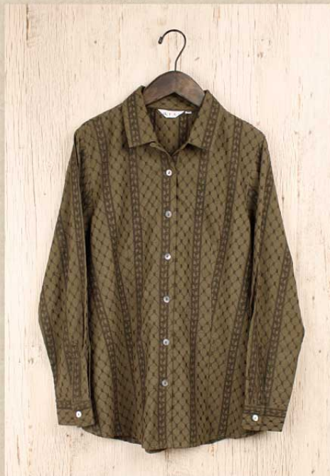
グリッド刺繍 オープンカラーシャツ 120901-404