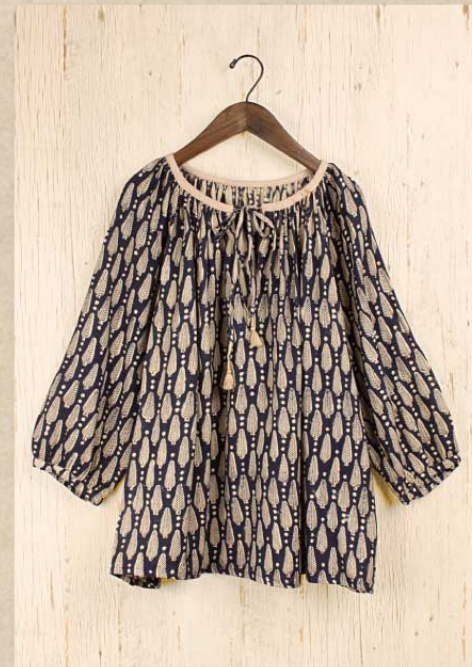
スノーツリーブロックプリント ギャザープルオーバー