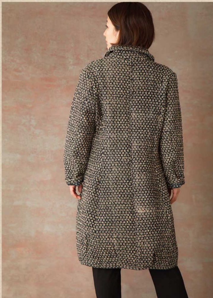
121025-443 B.black ボンディングキルト コクーンコート ¥16,800(本体) ¥17,640(税込) (p.16) 120938-447 B.black スラップボトム レギュラーパンツ ¥9,800(本体) ¥10,290(税込)