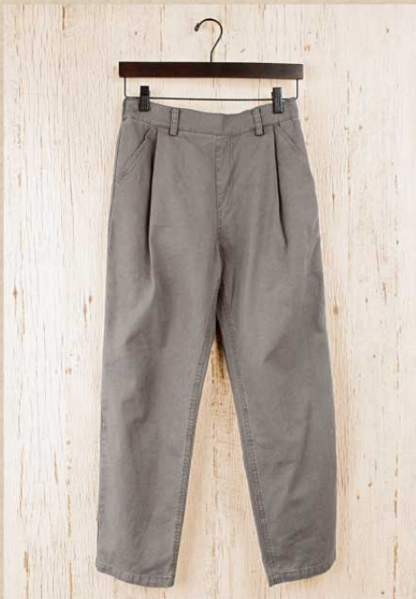
ツイルコットン テーパードパンツ 120808-012(M/L) ¥5,800(本体) ¥6,090(税込) cotton 100% M)ウエスト72cm 脇丈93cm L)ウエスト80cm 脇丈94cm