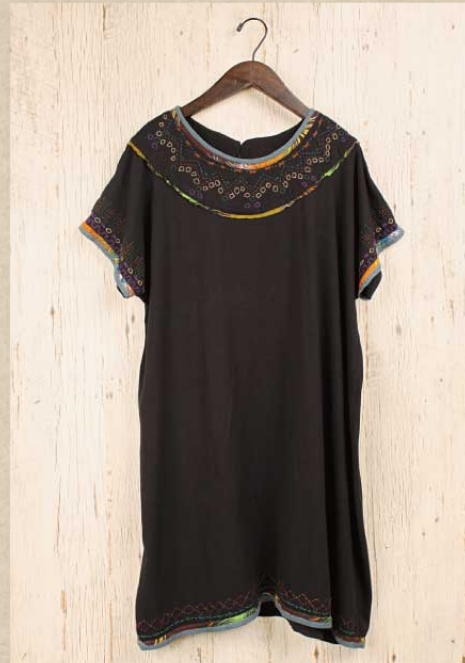
刺繍カットソー チュニック