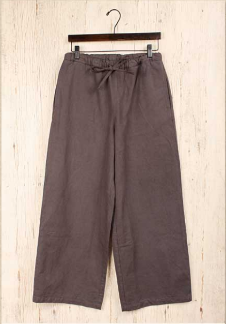
スラブボトム バギーパンツ 120938-448 ¥9,800(本体) ¥10,290(税込) cotton 100% ウエスト 68/90cm 脇丈 92cm