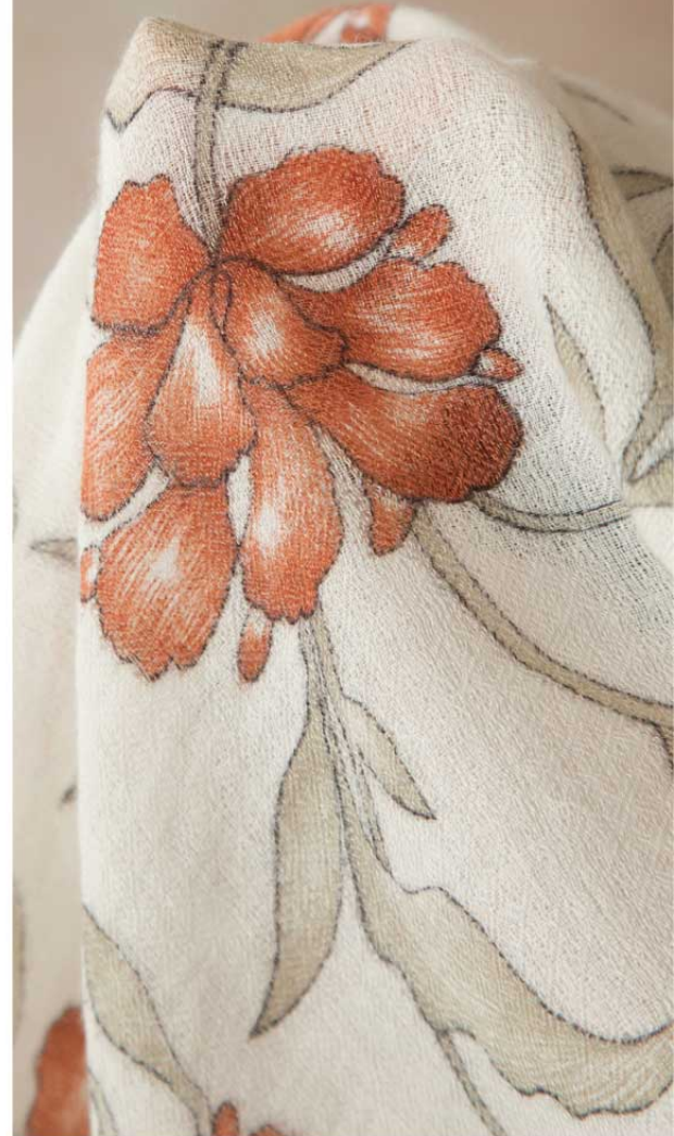
BL120901-519 C.natural ウール 花柄ショール ¥7,200(本体) ¥7,560(税込)