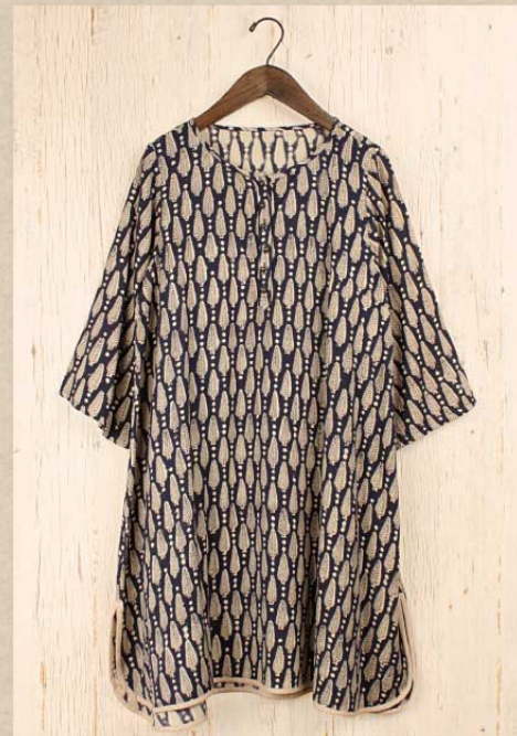
スノーツリーブロックプリント クルタ