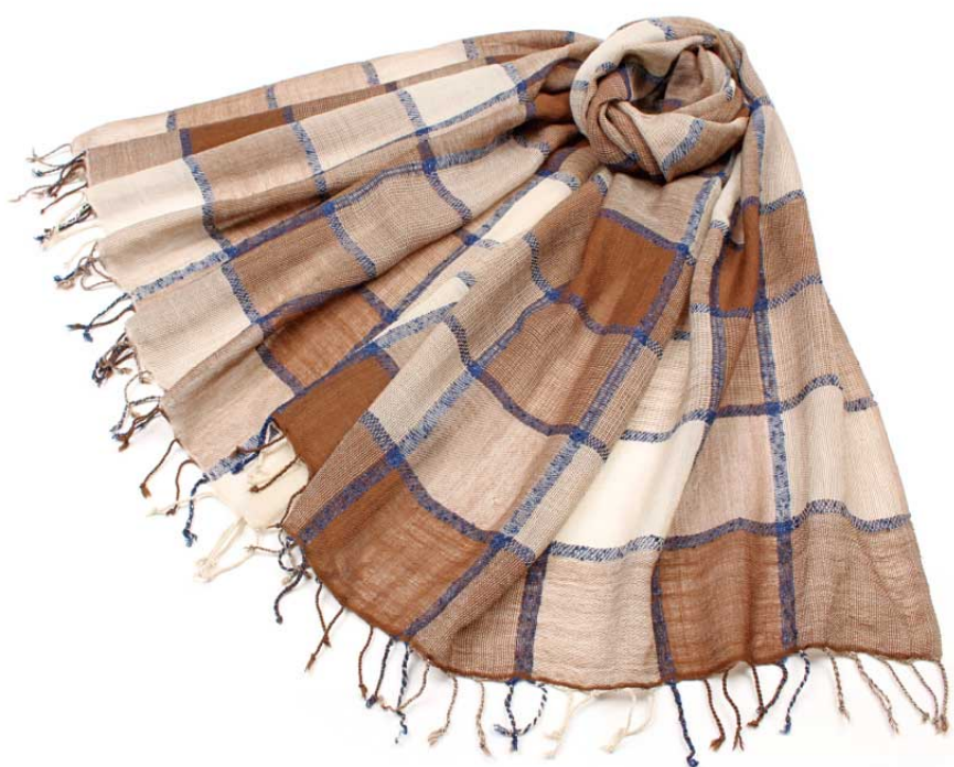
ウール チェック柄ショール BL121001-501 E.brown / ¥6,800(本体) ¥7,140(税込) / 90x180cm / wool 100%