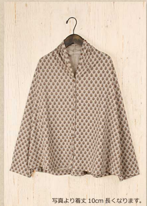
T/C 小花プリント カーディガン