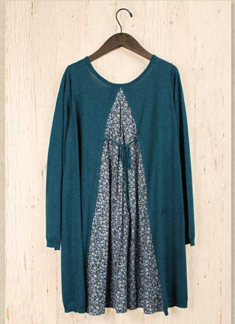
小花パッチニット チュニック