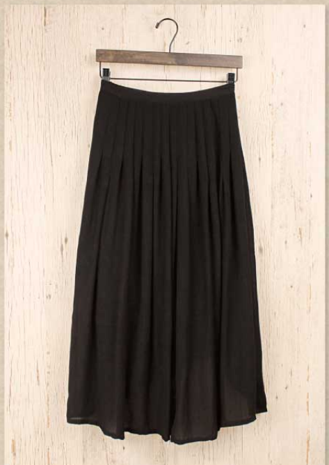
フラワーバンブー タックスカート