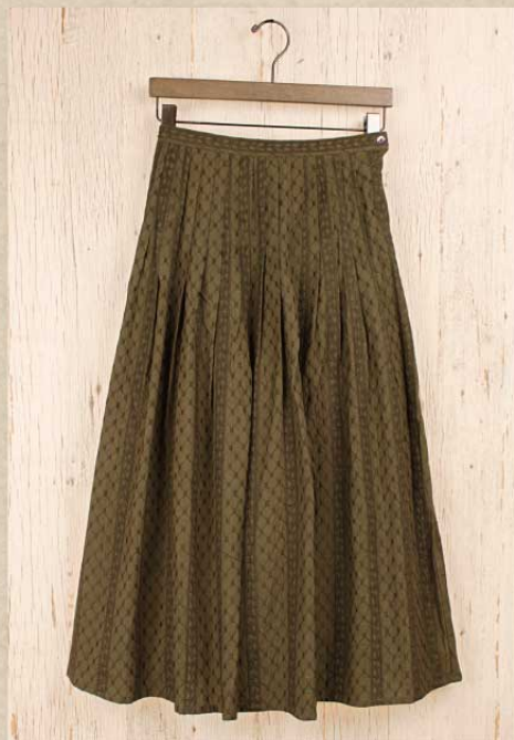
グリッド刺繍 タックスカート 120901-407