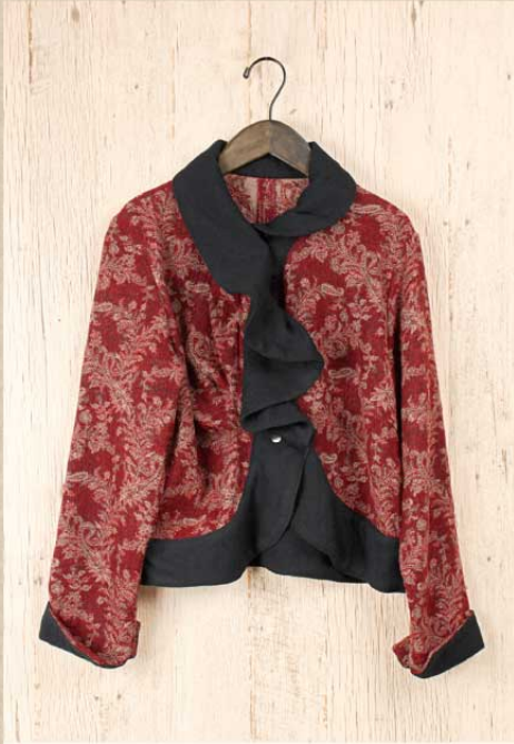
ボイルドジャマワール ジャケット