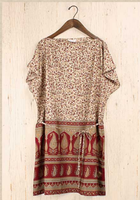
サリープリント チュニック 120902-120 ¥5,200(本体) ¥5,460(税込) polyester 100% 着丈 88cm