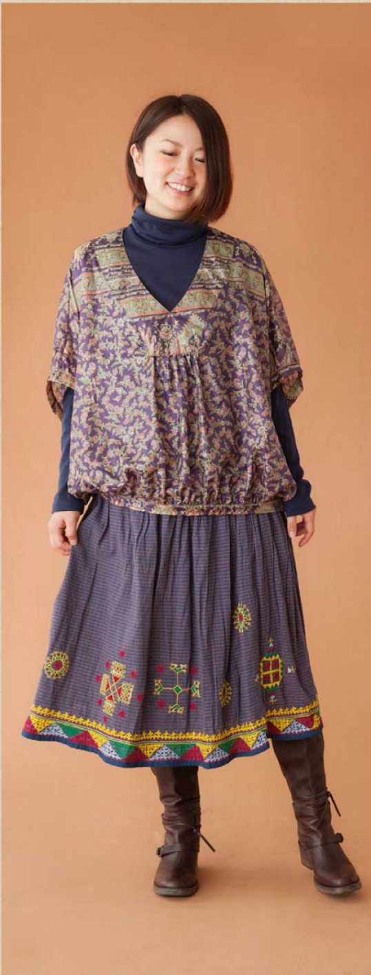
(p.19) 120802-034 L.purple アソートサリー フルオーバー ¥6,500(本体) ¥6,825(税込) 120904-047 U.navy バルメール刺繍 スカート ¥9,500(本体) ¥9,975(税込)