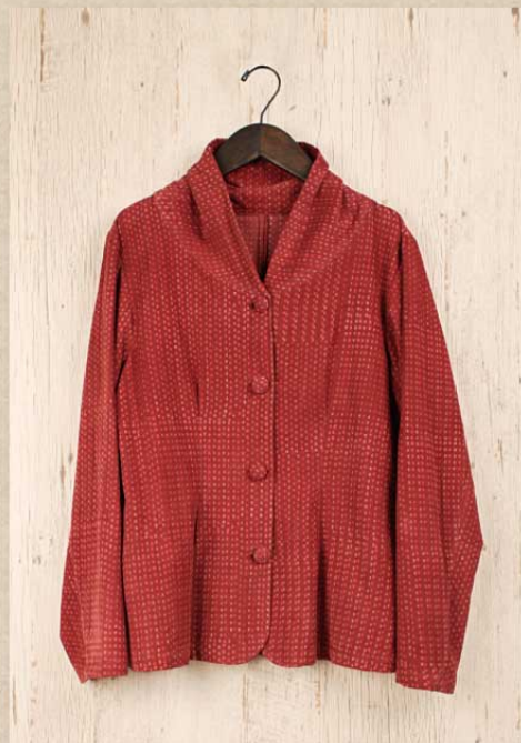
ドットコーデロイ ジャケット