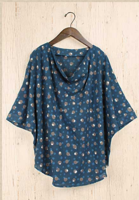
ドットブロックプリント プルオーバー