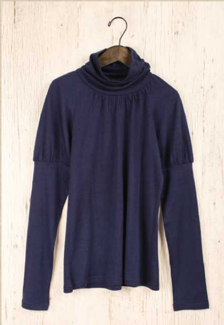
ウールジャージー パフショルダープルオーバー 121020-459

¥4,800(本体) ¥5,040(税込) wool 50% acrylic 50% バスト88cm 着丈59cm