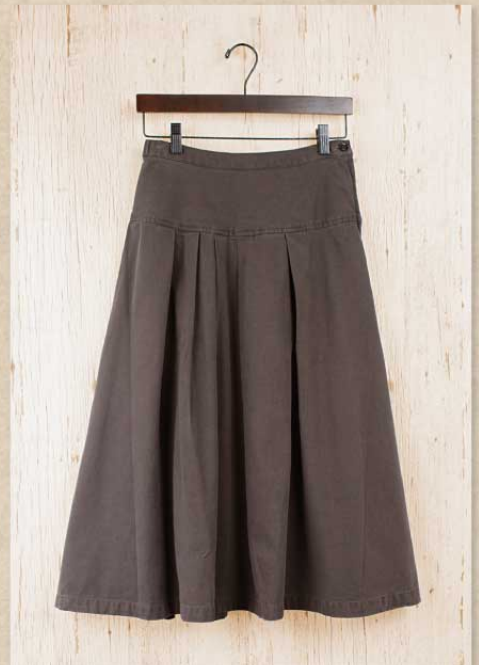
ツイルコットン タックスカート 120808-013 ¥6,400(本体) ¥6,720(税込) cotton 100% ウエスト68cm スカート丈75cm