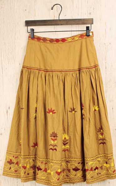
バルメール刺繍 スカート 〈マスタード〉

¥9,800(本体) ¥10,290(税込) cotton 100% ウエスト 68cm スカート丈 78cm