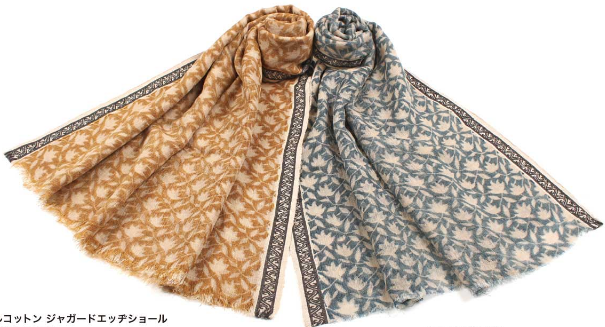
ウールコットン ジャガードエッチショール BL121001-509 左から E.brown P.indigo / ¥8,800(本体) ¥9,240(税込) / 70×180cm / wool 90% cotton 10%