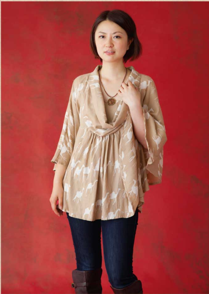
120835-082 D.beige キャラバンプリント ポンチョ ¥6,200(本体) ¥6,510(税込)