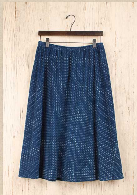
ドットコーデロイ フレアスカート