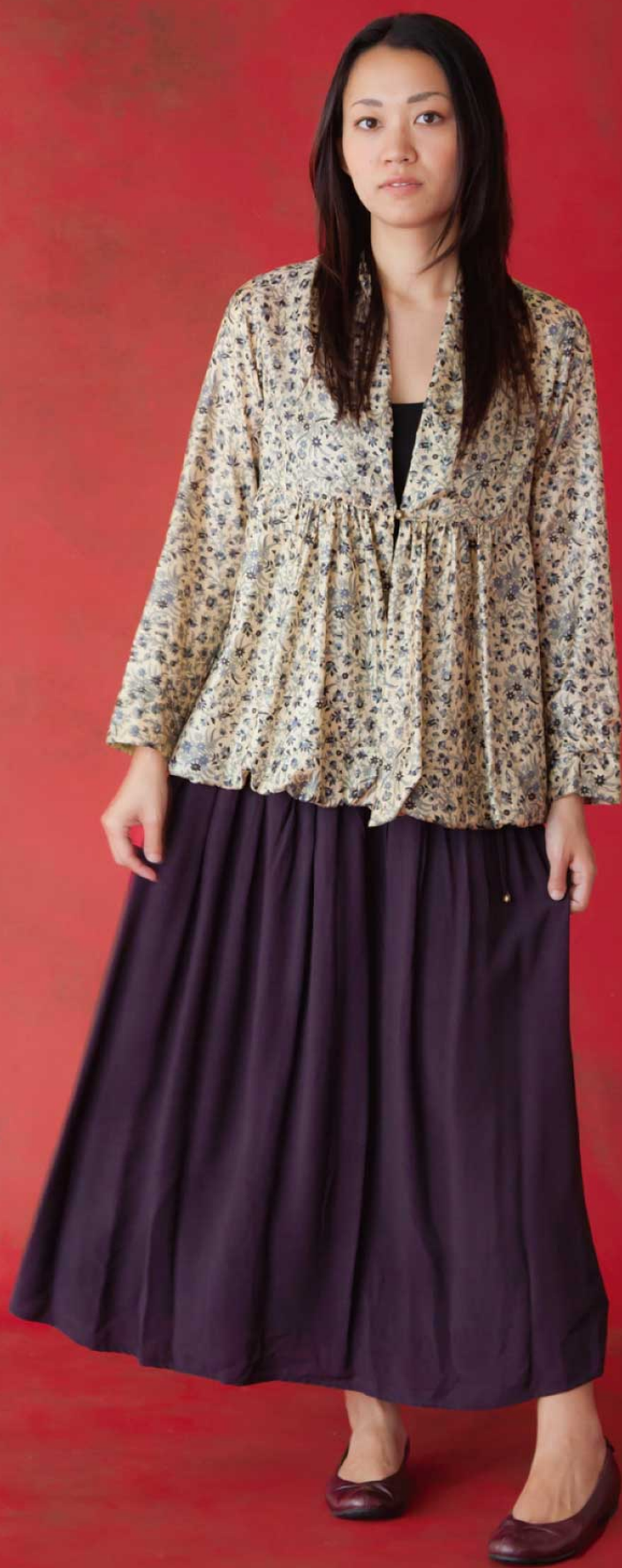
(p.19) 120802-033 D.beige アソートサリー ブラウス ¥6,800(本体) ¥7,140(税込) (p.19) 120811-136 U.navy ソリッドボスキー タックスカート ¥8,800(本体) ¥9,240(税込)