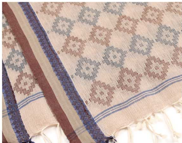
ウールカディコットン ジャムダニシヨール BL121001-511 D.beige / ¥8,200(本体) ¥8,610(税込) / 70×180cm / wool 60% khadicotton 40%