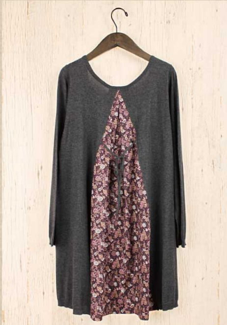
小花パッチニット チュニック