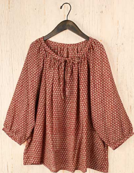
クローブプリントウール プルオーバー