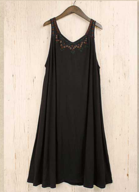
刺繍カットソー ジャンパースカート