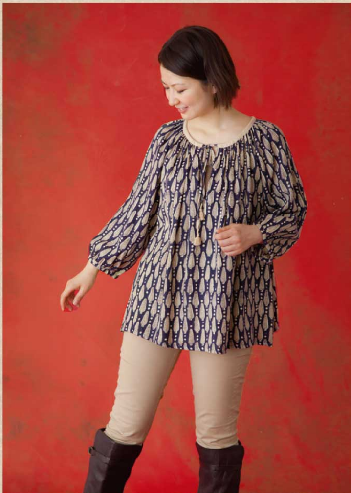
121125-210 U.navy スノーツリーブロックプリント ギャザープルオーバー ¥5,200(本体) ¥5,460(税込)