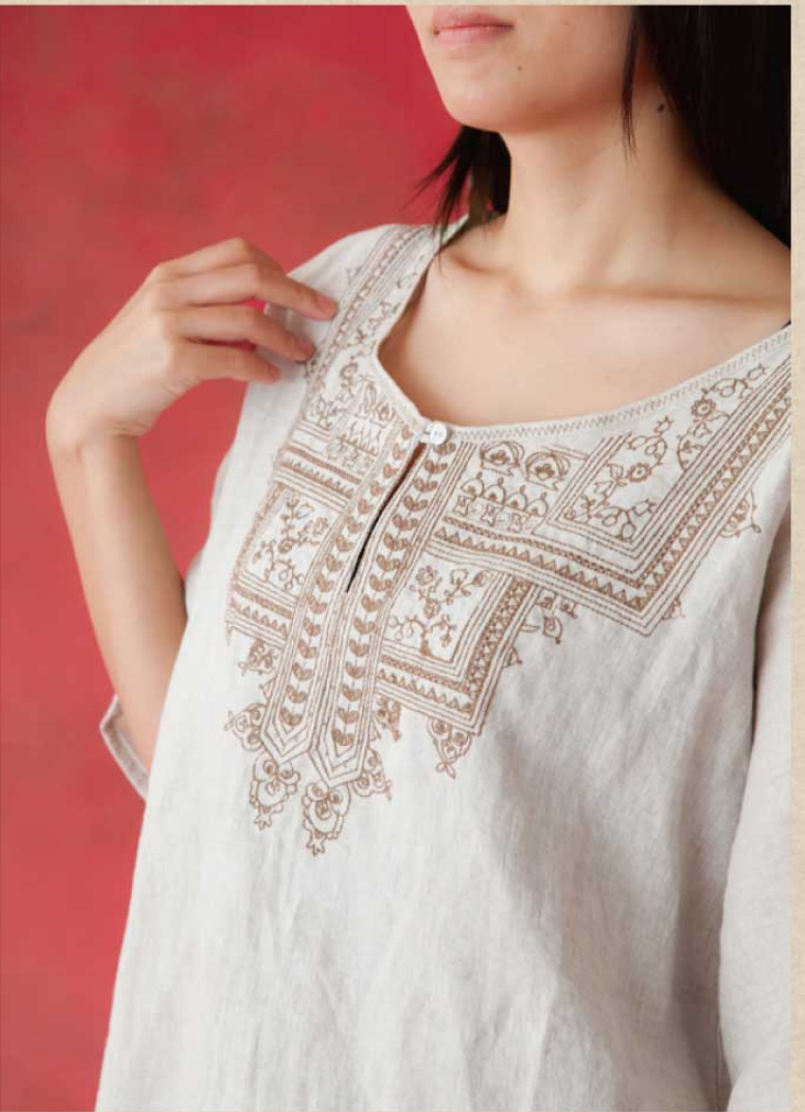
120816-158 D.beige リネンマドバニ刺繍 ドレス ¥8,800(本体) ¥9,240(税込) (p.19) 120811-137 Q.gray ソリッドボスキーワイドパンツ ¥6,300(本体) ¥6,615(税込)