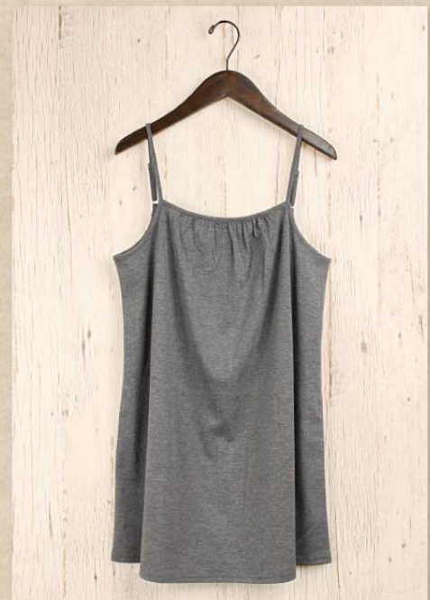
T/R 無地カットソー インナーキャミソールワンピース