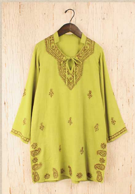
刺繍ツイル コットンクルタ 120811-019 ¥8,800(本体) ¥9,240(税込) cotton 100% 着丈 74cm