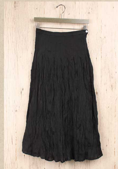
オーガニックドビー タックスカート 120801-410

¥9,500(本体) ¥9,975(税込) cotton 100% ウエスト70cm 後丈80cm