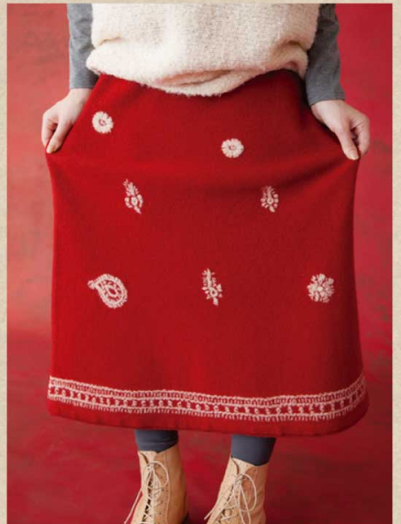
(p.29) 121120-207 l.red 刺繍縮絨 ロングスカート ¥14,800(本体) ¥15,540(税込)