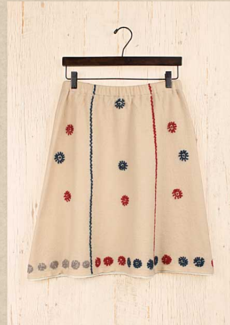
刺繍縮絨 スカート 121120-206

¥13,200(本体) ¥13,860(税込) wool 100% ウエスト 68cm スカートの丈 50cm