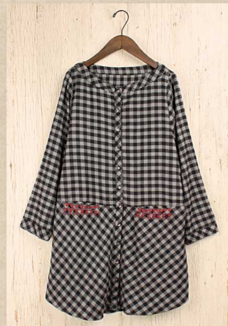
チェック刺繍 ロングブラウス 120902-108

¥8,600(本体) ¥9,030(税込) cotton 100% 着丈 80cm