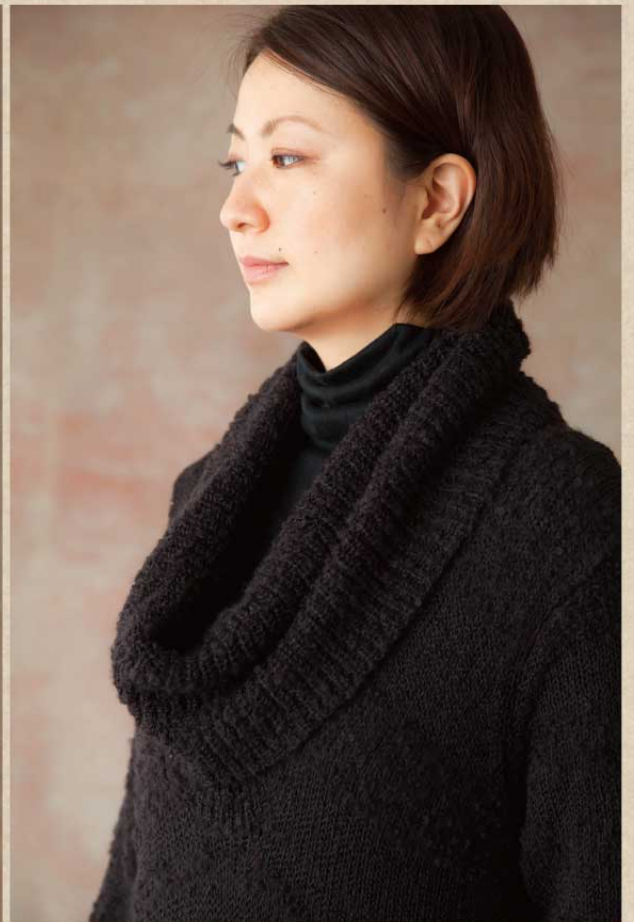
左・上写真共通 120920-434 B.black リングモヘヤ チュニック ¥11,000 (本体) ¥11,550 (税込) 左写真 (p.16) 120938-447 B.black スラブボトムレギュラーパンツ ¥9,800 (本体) ¥10,290 (税込)