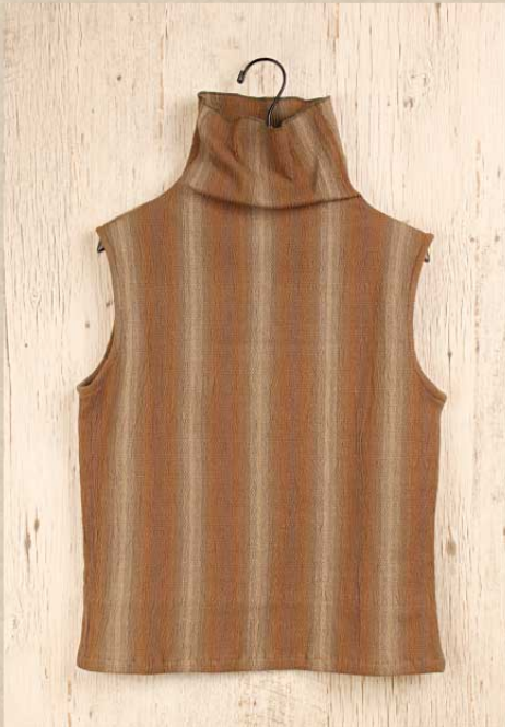
ストレッチ楊柳 ベスト