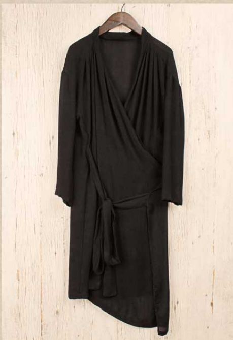
フラワーバンブー ラップワンピース