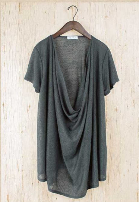
スラブニット チュニック 120720-002

¥4,500(本体) ¥4,725(税込) rayon 65% polyester 35% 着丈 72cm