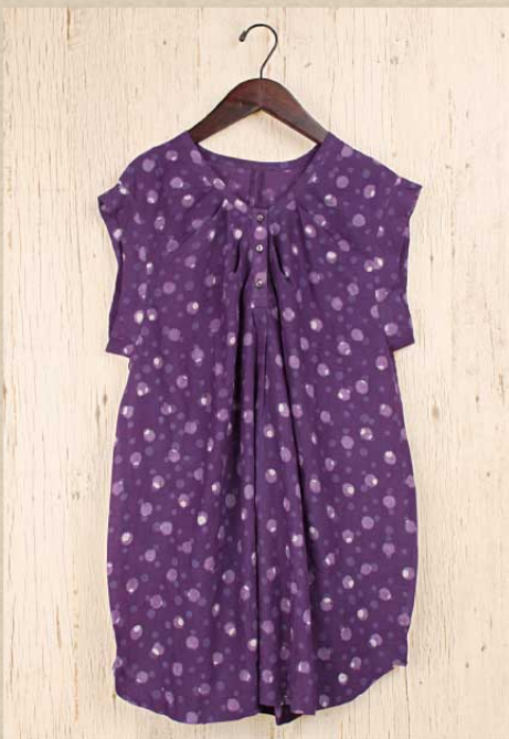
ドットブロックプリント チュニック