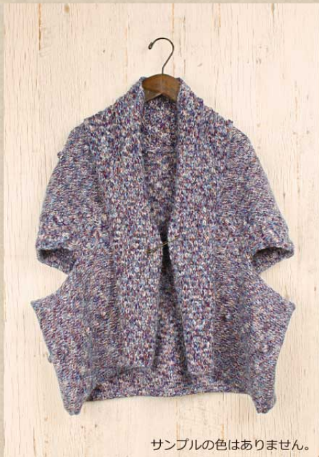
サンプルの色はありません。