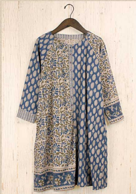
パッチブロックプリント チュニック