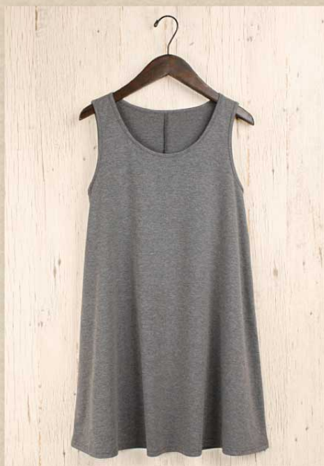
T/R 無地カットソー インナーノースリーブワンピース 120708-031 ¥2,900(本体) ¥3,045(税込) polyester 60% rayon 35% polyurethane 5% バスト 95cm 着丈 75cm