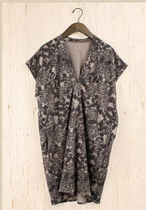
綿スラブ天竺プリント タックチュニック 120808-125 ¥4,800(本体) ¥5,040(税込) cotton 100% 着丈 86cm