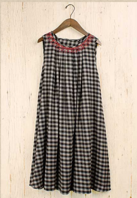
チェック刺繍 チュニック 120902-107

¥8,200(本体) ¥8,610(税込) cotton 100% 着丈 88cm