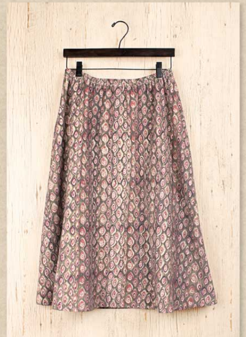
リーフコーデロイ フレアスカート 121025-429 ¥6,800(本体) ¥7,140(税込) cotton 100% ウエスト68cm 後丈74cm