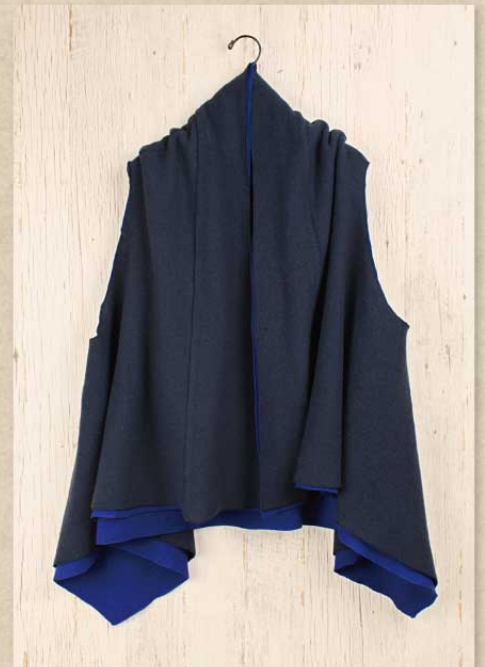
リバーシブル縮絨 ベスト 121115-076 ¥19,000(本体) ¥19,950(税込) wool 100% 着丈 63cm