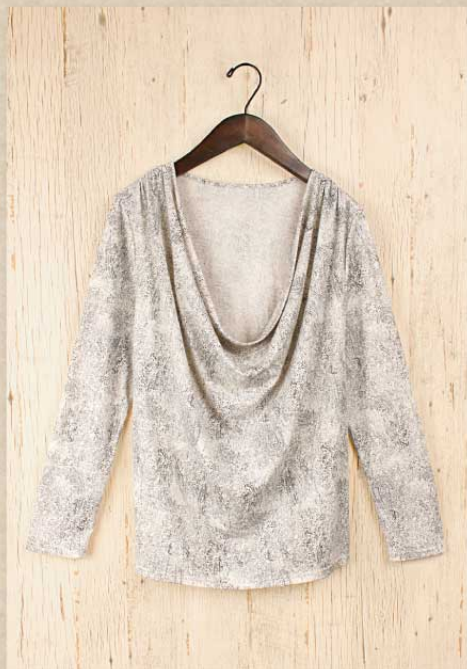
T/L ペイズリープリント ドレーピング TEE 120822-024

¥5,200(本体) ¥5,460(税込) polyester 85% linen 15% バスト 92cm 着丈 63cm