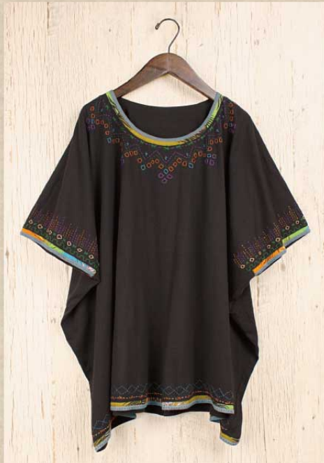
刺繍カットソー プルオーバー