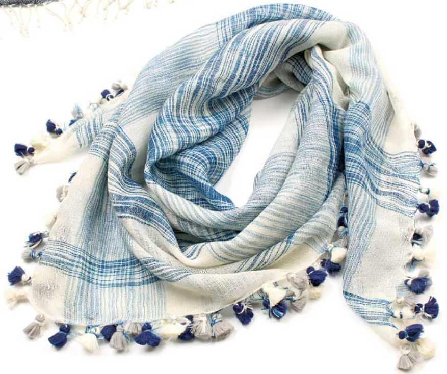
ウール スクエアポンポンショール BL120901-516 O.blue ¥6,000(本体) ¥6,300(税込) / 110×110cm / wool 70% cotton 30%