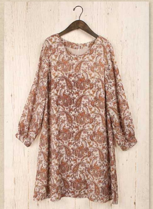
ウールペイズリー Aラインワンピース 121002-451

¥15,000(本体) ¥15,750(税込) wool 100% バスト98cm 着丈98cm