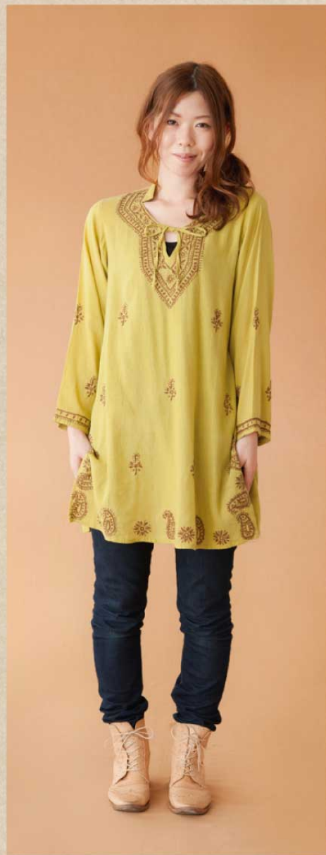
120811-019 G.mustard 刺繍ツイルコットンクルタ ¥8,800(本体) ¥9,240(税込)