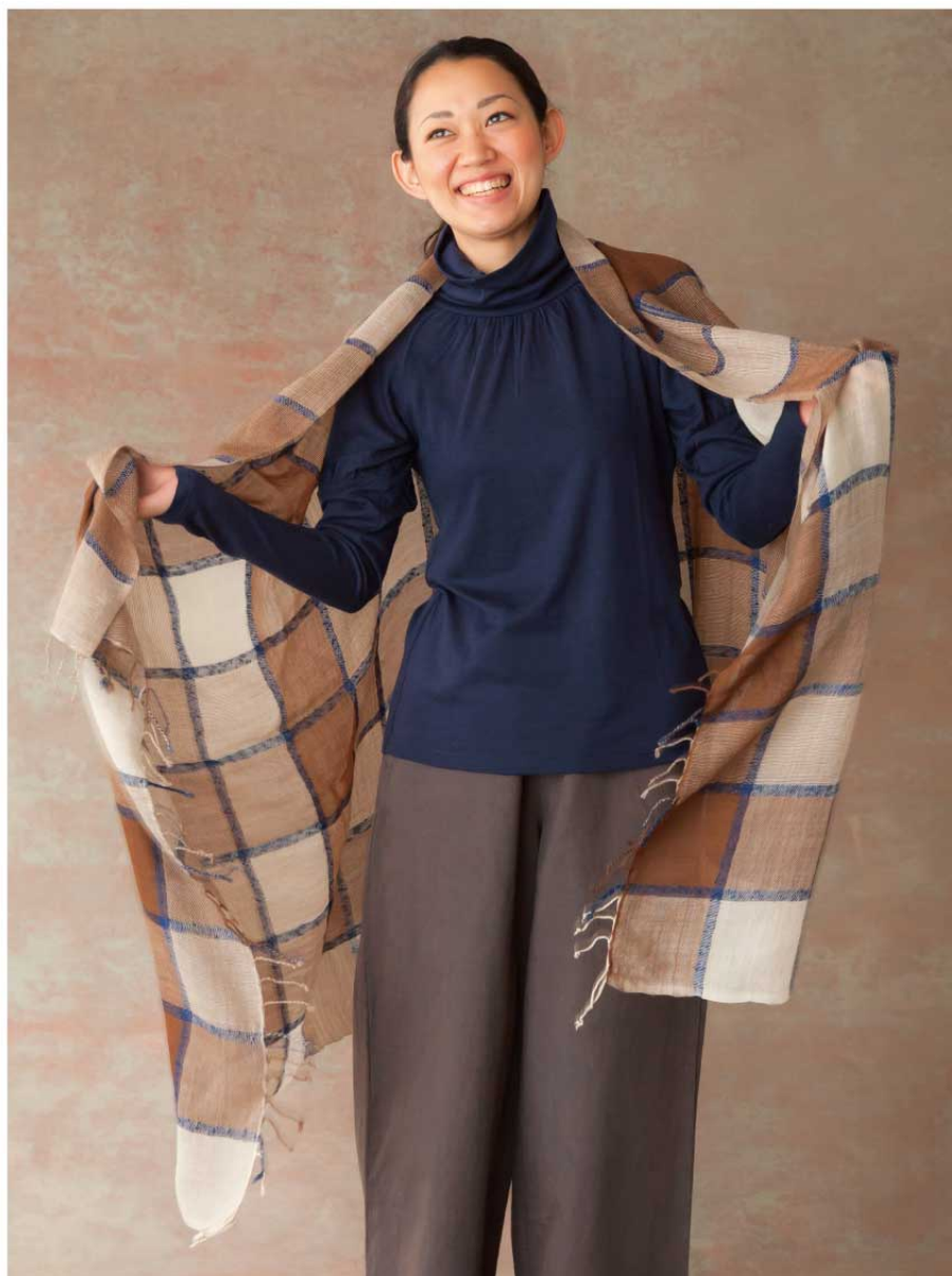
左右写真ともに BL121001-501 E.brown ウール チェック柄ショール ¥6,800(本体) ¥7,140(税込)