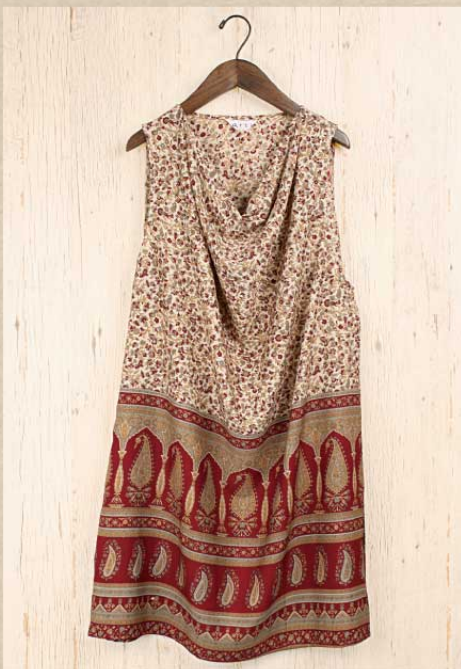
サリープリント ノースリーブチュニック 120902-123 ¥5,200(本体) ¥5,460(税込) polyester 100% 着丈 88cm