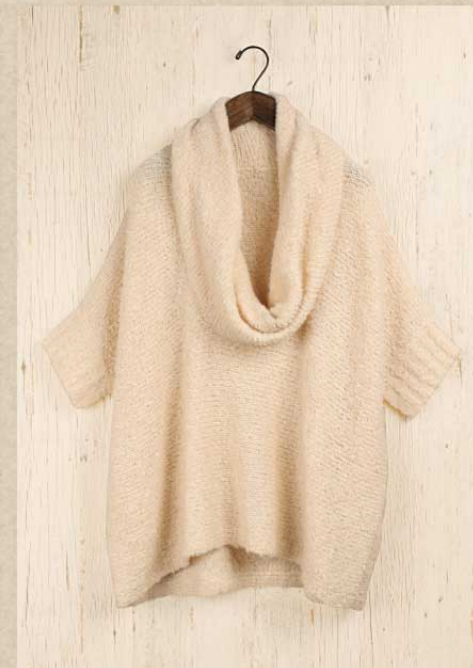
リングヤーン プルオーバー 120912-182

¥8,500(本体) ¥8,925(税込) acrylic 57% wool 20% nylon 13% mohair10% 着丈 68cm