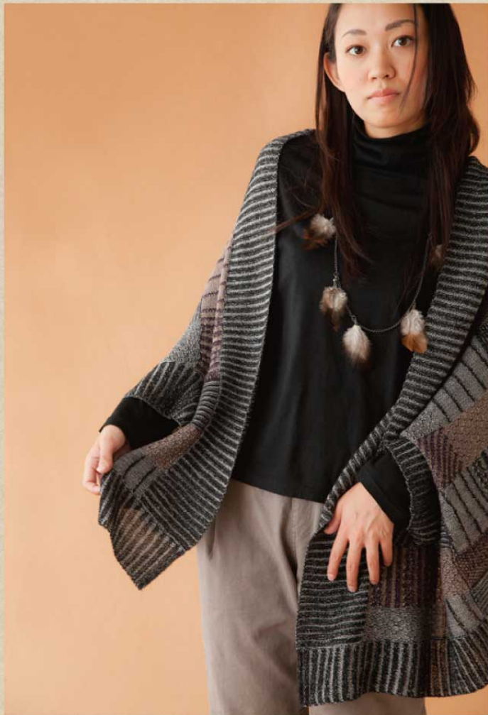
120912-145 B.black ボーダーブロックニット 2way カーディガン ¥9,800(本体) ¥10,290(税込) (p.26) 120808-012 Q.gray ツイルコットンテーパードパンツ (Mサイズ) ¥5,800(本体) ¥6,090(税込)