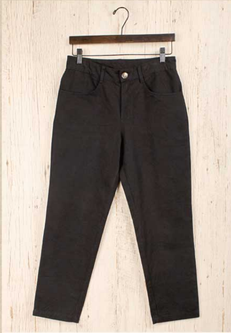
スラブボトム レギュラーパンツ 120938-447 ¥9,800(本体) ¥10,290(税込) cotton 100% ウエスト 79cm 脇丈 85cm