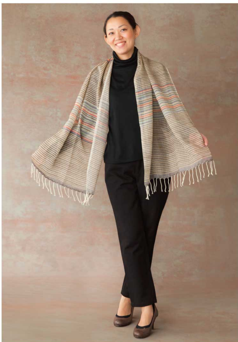
左右写真ともに BL121001-503 O.blue ウール ボーダー柄ショール ¥6,800(本体) ¥7,140(税込)