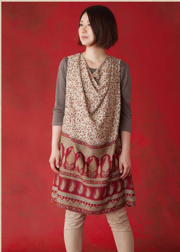
120902-123 l.maroon サリープリント ノースリーブチュニック ¥5,200(本体) ¥5,460(税込)