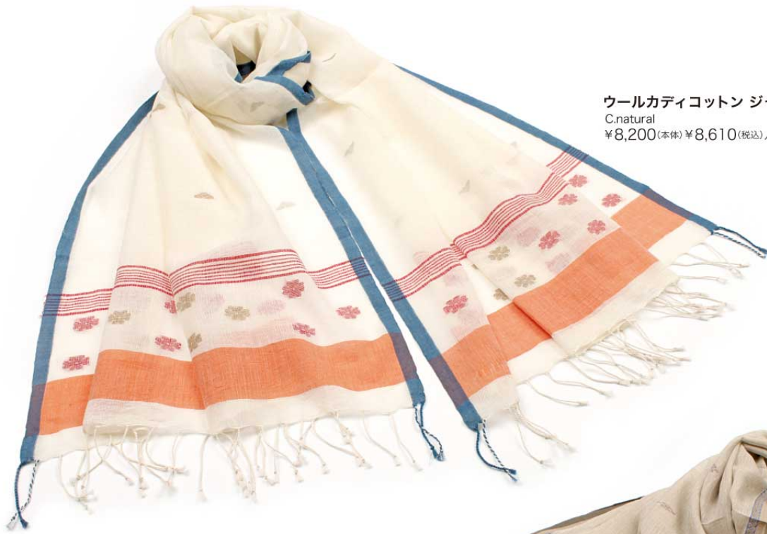
ウールカディコットン ジャムダニシヨール BL121001-512 C.natural ¥8,200(本体)¥8,610(税込) / 70×170cm / wool 60% khadicotton 40%