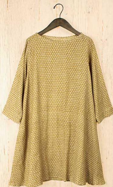
クローブプリントウール チュニック