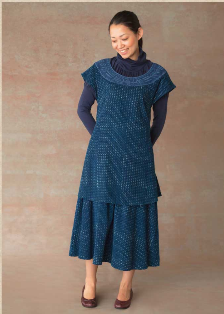
121025-431 U.navy ドットコーデロイ チュニック ¥6,800(本体) ¥7,140(税込) (p.15) 121020-459 U.navy ウールジャージー パフショルダーダブルオーバー ¥4,800(本体) ¥5,040(税込) 121025-432 U.navy ドットコーデロイ フレアスカート ¥6,800(本体) ¥7,140(税込)