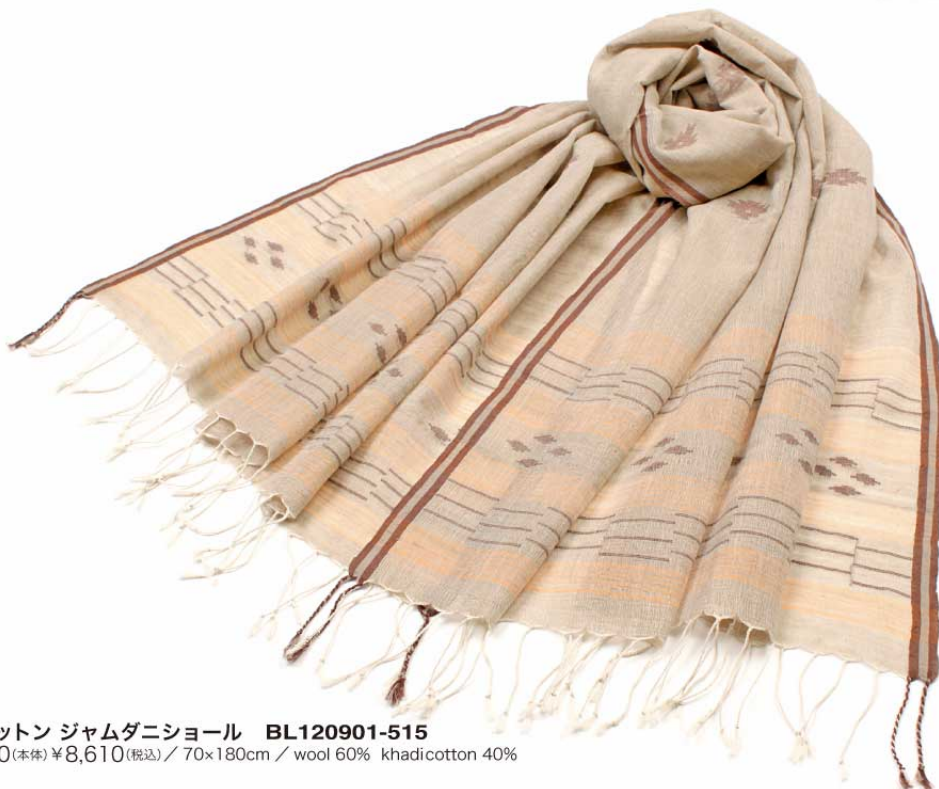
ウールカディコットン ジャムダニシヨール BL120901-515 D.beige / ¥8,200(本体)¥8,610(税込) / 70×180cm / wool 60% khadicotton 40%