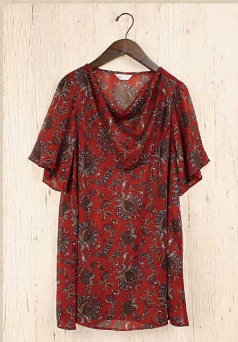
シフォンプリント プルオーバー 120801-061

¥4,800(本体) ¥5,040(税込) polyester 100% 着丈 74cm