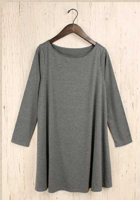
T/R 無地カットソー チュニック