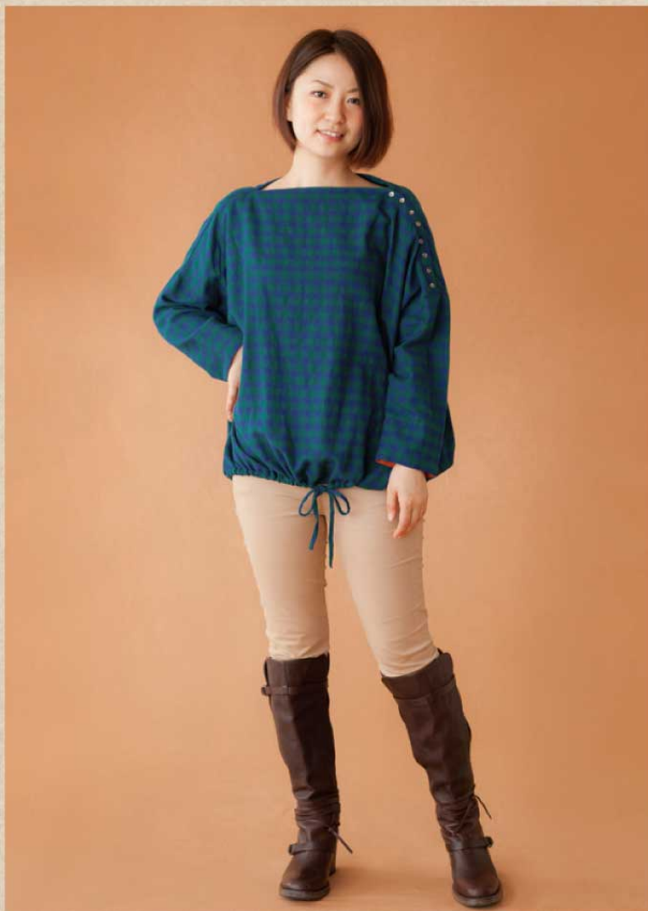
120902-106 X.blue green チェック刺繍 プルオーバー ¥6,800(本体) ¥7,140(税込)