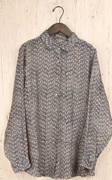
シルクブロックプリント レギュラーシャツ 120814-457

¥12,000(本体) ¥12,600(税込) silk 100% バスト104cm 着丈69cm