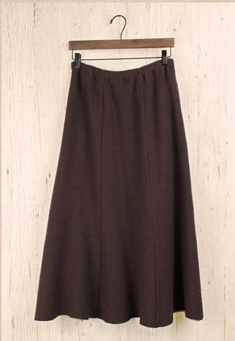
リバーシブル縮絨 スカート 121115-075 ¥18,000(本体) ¥18,900(税込) wool 100% ウエスト 68cm スカートを丈 78cm