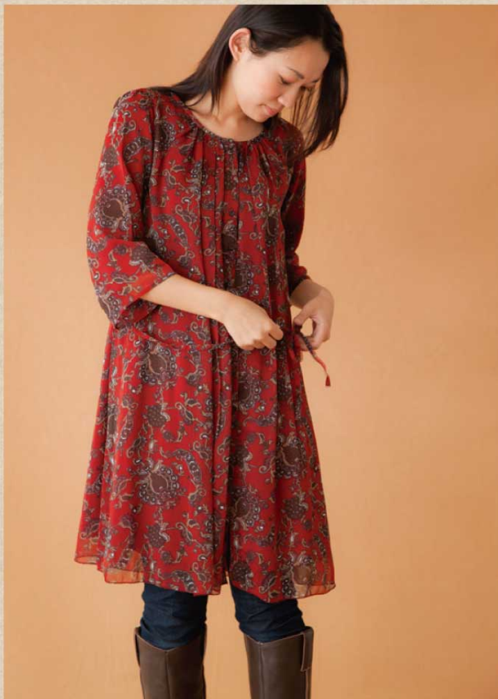
120801-063 H.orange シフォンプリント ドレス ¥7,200(本体) ¥7,560(税込)