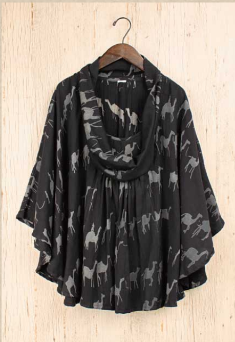
キャラバンプリント ポンチョ 120835-082 ¥6,200(本体) ¥6,510(税込) cotton 100% 着丈 68cm