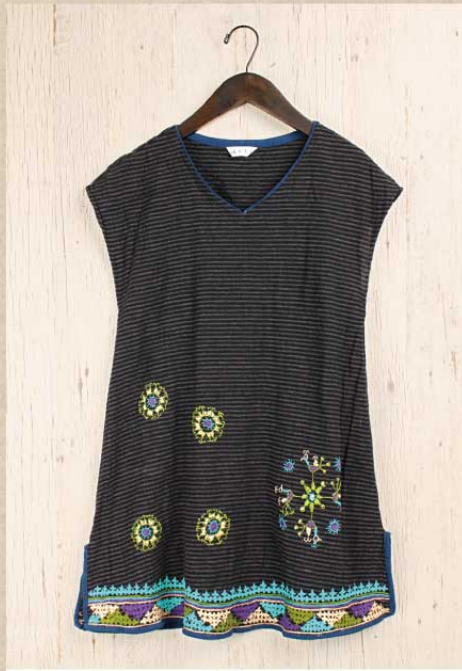
バルメール刺繍 チュニック 120904-046 ¥8,500(本体) ¥8,925(税込) cotton 100% バスト 96cm 着丈 80cm