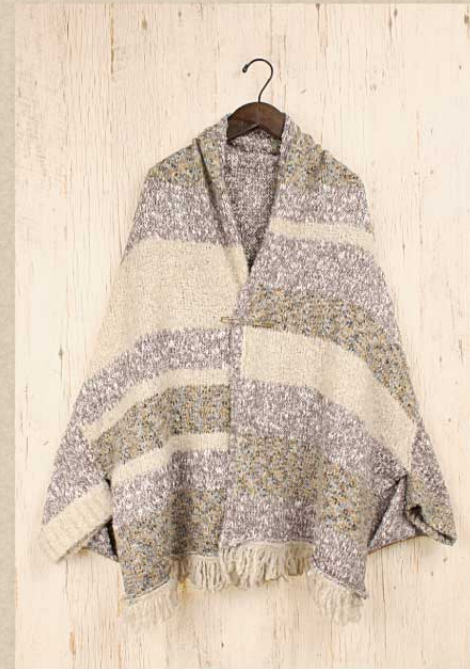
ブロックニット ポンチョカーディガン 120912-149

¥9,500(本体) ¥9,975(税込) acrylic 62% wool 20% polyester 12% nylon 6% 着丈 65cm