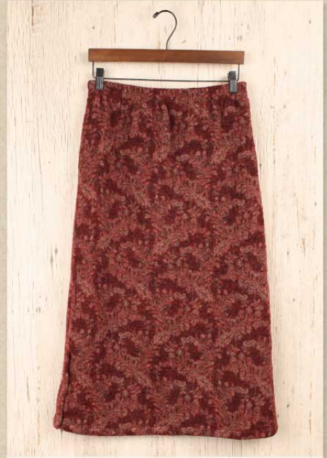
ボイルドジャマワール スカート