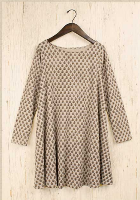
T/C 小花プリント チュニック