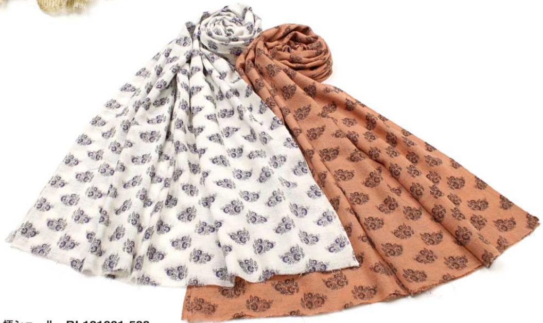
ウール ブロックプリント柄ショール BL121001-508 左から A.white E.brown / ¥7,200(本体) ¥7,560(税込) / 70×180cm / wool 100%