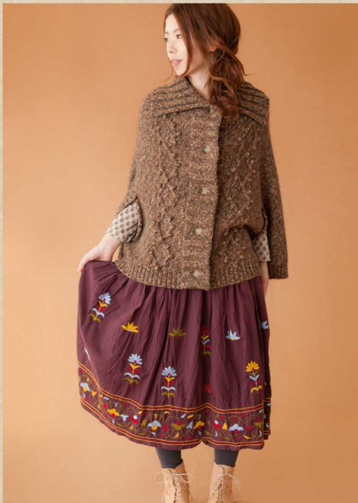
121012-170 E.brown 森 mix ニット ポンチョ ¥12,000 (本体) ¥12,600 (税込) (p.15) 120904-048 L.purple / バルメール刺繍 スカート ¥9,800 (本体) ¥10,290 (税込)