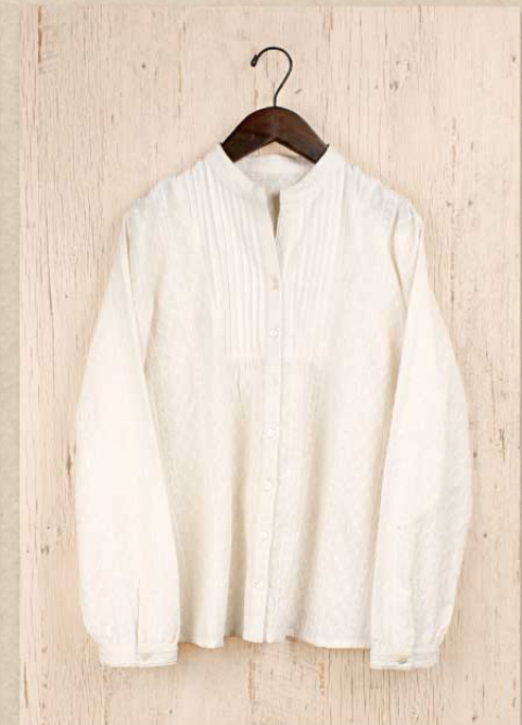
グリッド刺繍 ヨークブラウス 120901-405