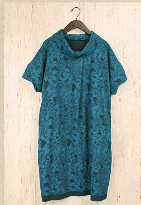
綿スラブ天竺プリント ドレス 120808-128 ¥5,800(本体) ¥6,090(税込) cotton 100% 着丈 98cm