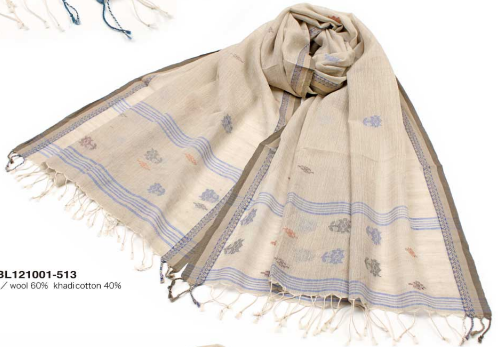
ウールカディコットン ジャムダニシヨール BL121001-513 D.beige / ¥8,200(本体)¥8,610(税込) / 70×180cm / wool 60% khadicotton 40%