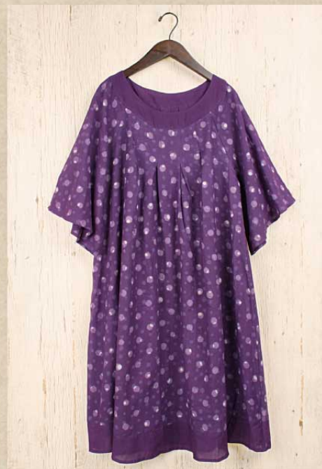
ドットブロックプリント ドレス