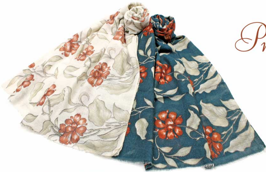
ウール 花柄ショール BL120901-519 左から C.natural P.indigo / ¥7,200(本体) ¥7,560(税込) / 70×180cm / wool 100%