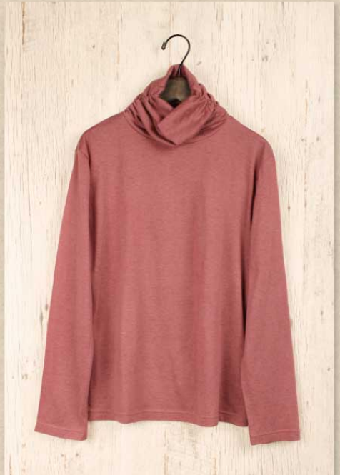
ウールジャージー タートルネックプルオーバー 121020-460

¥4,200(本体) ¥4,410(税込) wool 50% acrylic 50% バスト91cm 着丈60cm