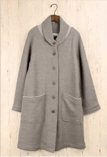
圧縮ニット コート 121120-162 ¥23,000(本体) ¥24,150(税込) wool 100% バスト 102cm 着丈 78cm