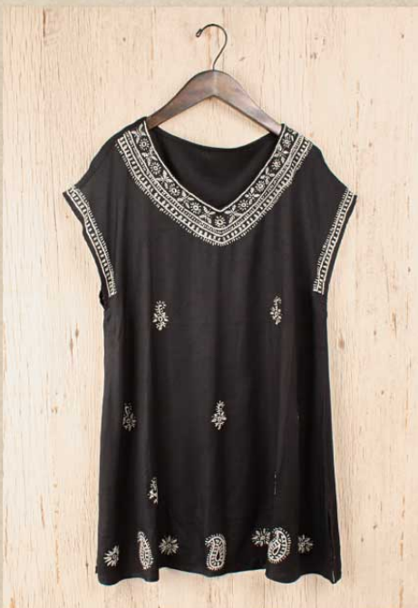
刺繍ツイル レーヨンチュニック 120811-020 ¥7,500(本体) ¥7,875(税込) rayon 100% 着丈 80cm