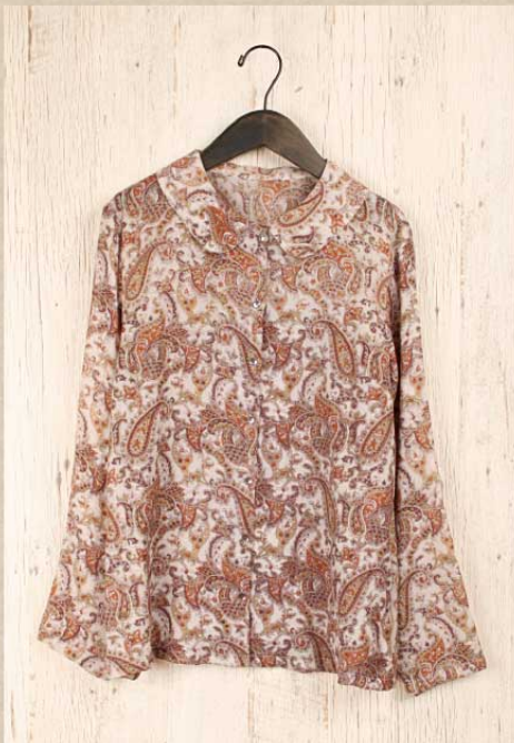
ウールペイズリー ラウンドカラーブラウス 121002-449

¥12,000(本体) ¥12,600(税込) wool 100% バスト100cm 着丈60cm