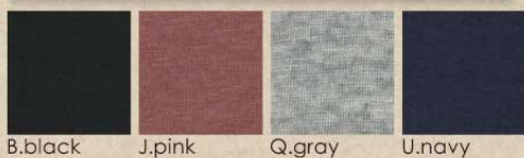
B.black J.pink Q.gray U.navy