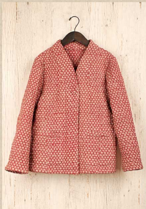
ボンディングキルト ジャケット