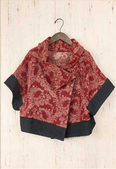
ボイルドジャマワール ボレロ