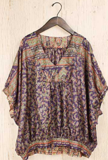
アソートサリー プルオーバー 120802-034

¥6,500(本体) ¥6,825(税込) polyester 100% 着丈 62+4cm