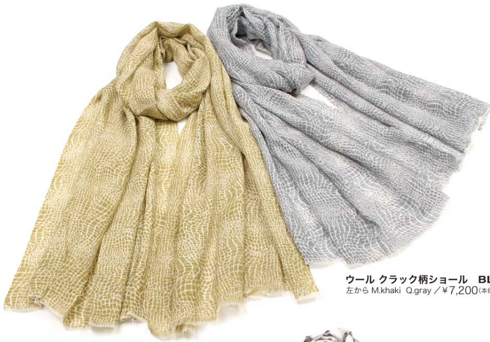
ウール クラック柄ショール BL121001-507 左から M.khaki Q.gray / ¥7,200(本体) ¥7,560(税込) / 70×180cm / wool 100%