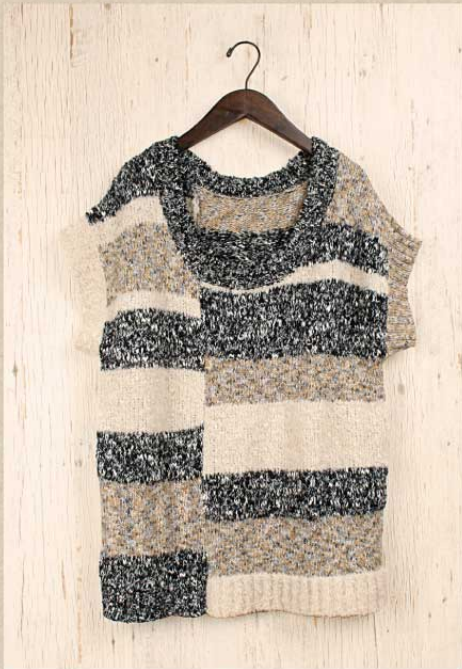
ブロックニット フレンチプルオーバー 120912-147

¥8,800(本体) ¥9,240(税込) acrylic 55% wool 20% polyester 18% nylon 7% 着丈 71cm