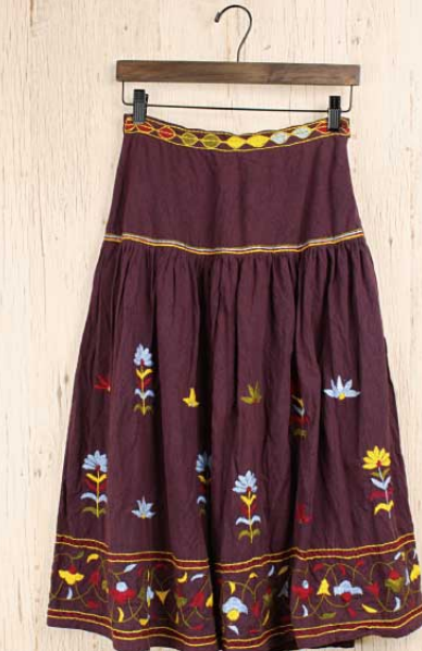
バルメール刺繍 スカート 〈パープル〉