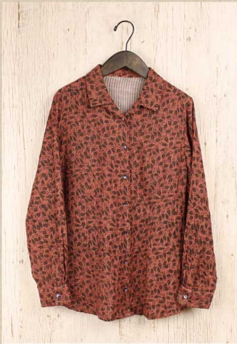
ダブルガーゼプリント オープンカラーシャツ