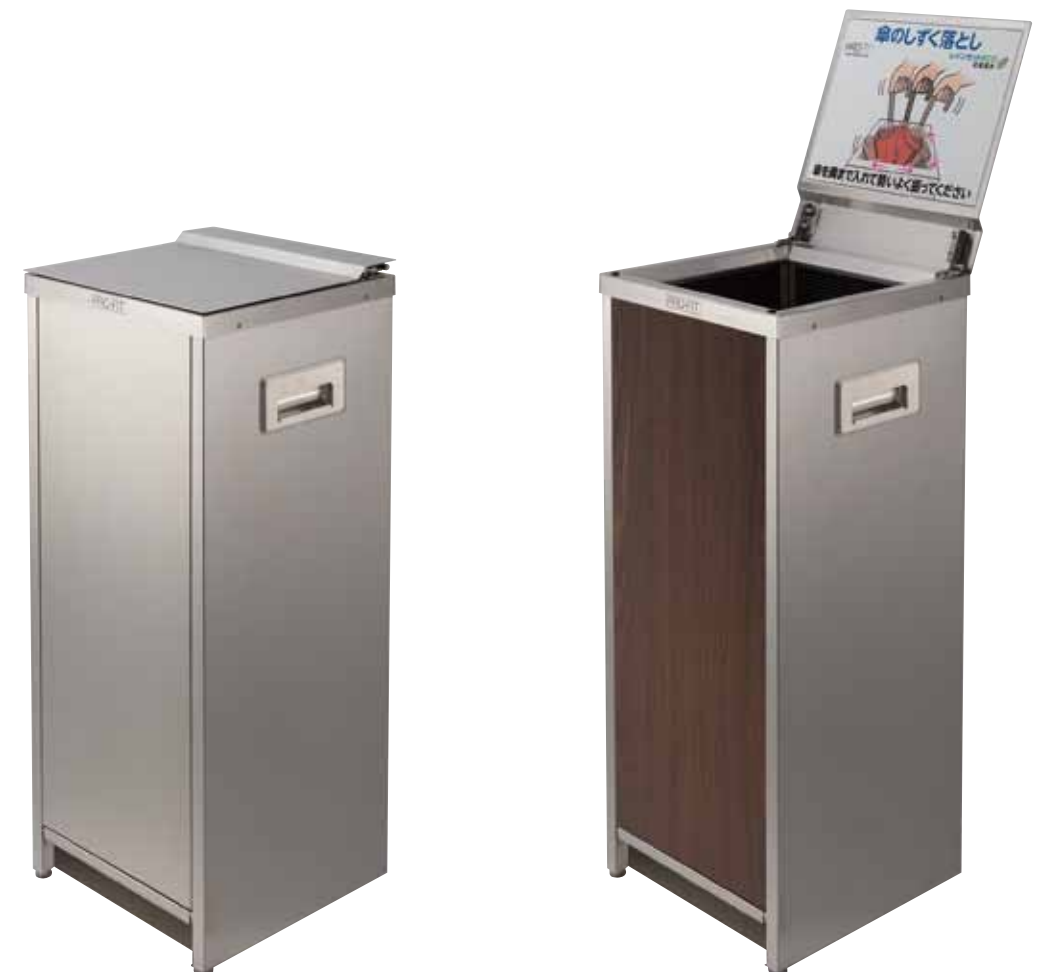
レインカットECO 4面はっすい(ヘアライン仕上)