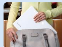
鞆からの出し入れもスムーズ！

dynabook RX73はフラットな形状なので、鞆にも入りやすく持ち運びもらくらくです。 ACアダプターも約140 g で超軽量。