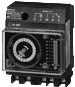
クォーツモータ式

カレンダータイプで曜日ごとのON・OFF設定が可能。 しかもクォーツ駆動による300時間の停電補償付。