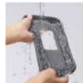
パッドは外して 水洗い可