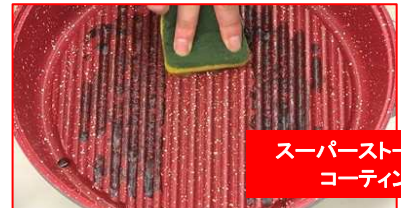
スーパーストーンコーティング