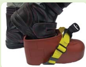
①バックルを開放した状態でオーバーシューズを履く。(※1)