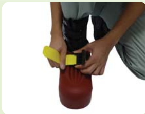
②固定ベルトを引っ張り密着させる。