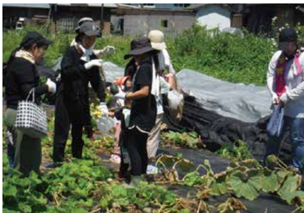
野菜の収穫を体験する参加者

参加者は最初に牛乳工場で受入から製造の流れについて説明を受けながら製造現場を見学しました。その後グリーンコープでも取り扱っていたでいる「飲むヨーグルト」の製造を見学