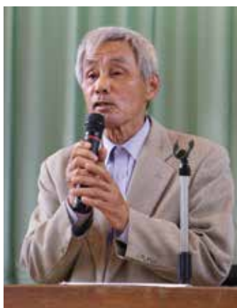
あいさつする玉麻組合長

6月30日(日)、下郷小学校体育館において第76回下郷農協通常総会が、組合員177名(正組合員実出席44名、委任状と書面議決133名)の出席で開催されました。