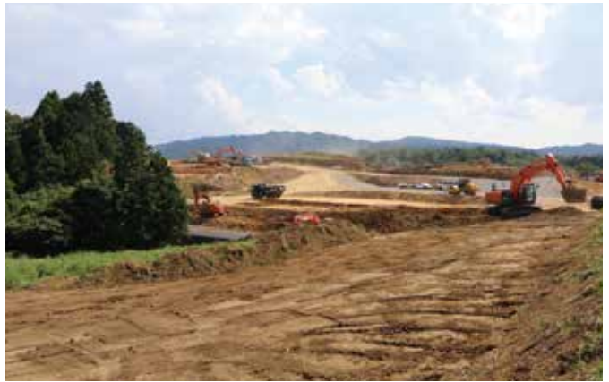
造成工事が進む新酪農場建設地

約2年間の工事期間を経て、この鎌城地区に1,000頭規模の新酪農場が完成し、地域農業の発展と持続可能な地域社会の創出が期待されています。