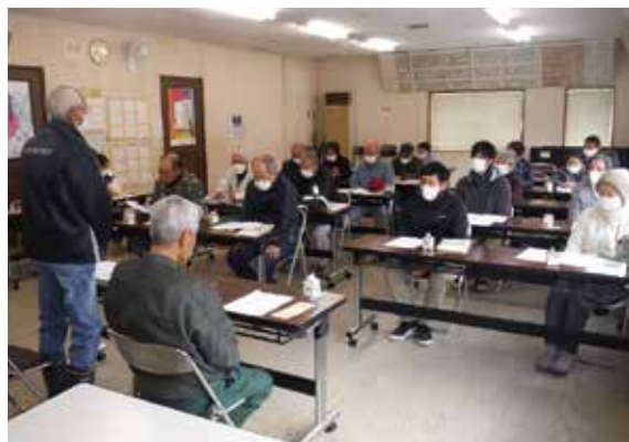
農協変改のなか、野菜作りを頑張ろうと開かれた総会