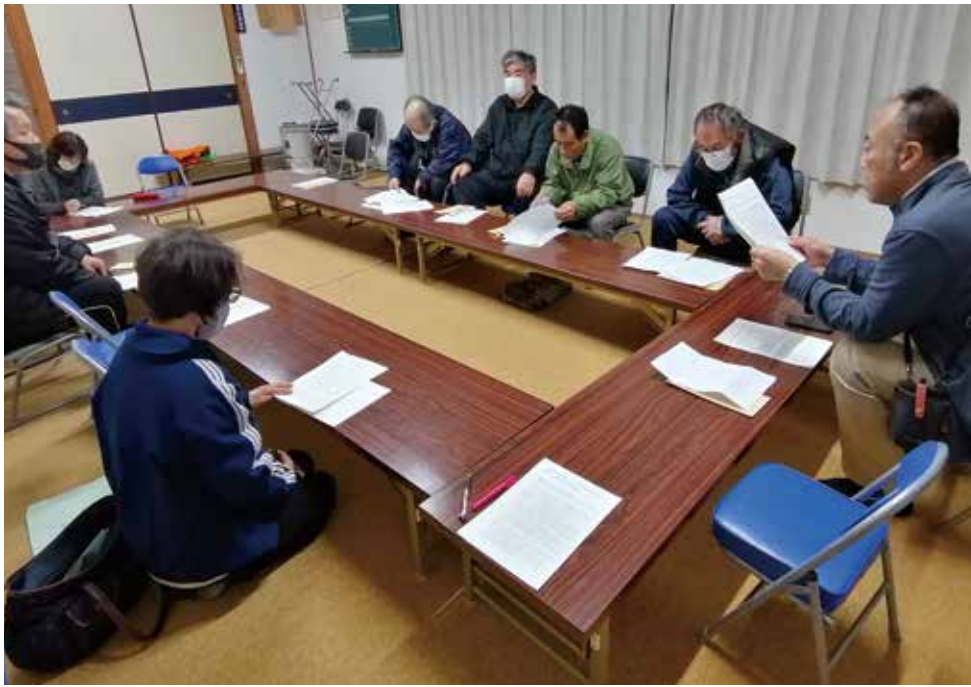
農協から決算見込みや事業計画について説明（金吉上集落）

↓2月18日、新酪農場建設に係る耶馬溪ファームの鎌城地区説明会は行われました。山浦集落での説明会開催については確認します。他の地区については、意見として持ち帰り、関係者間で検討します。なお、山国川漁業協同組合には、説明に伺っています。