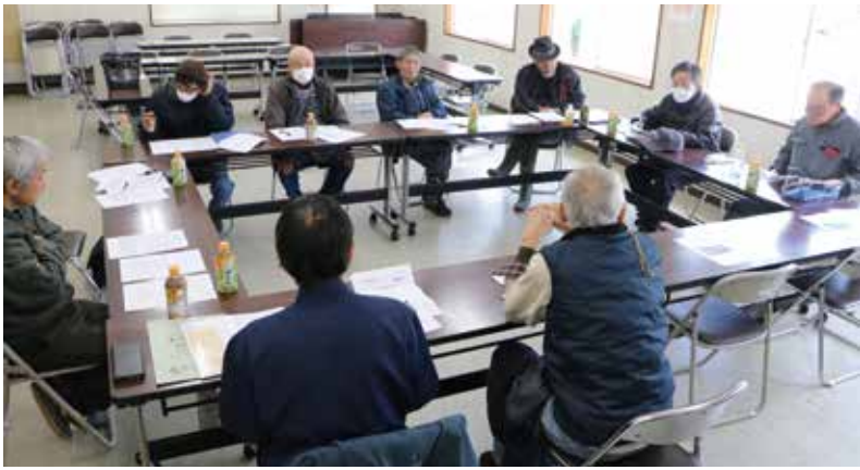
「生産者も販路拡大を」と協議した総会