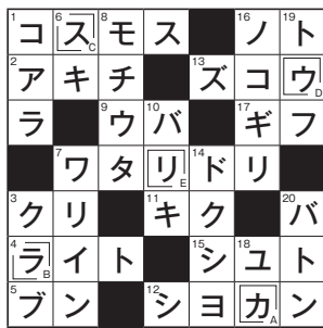
先月号のこたえ 「カラスウリ」