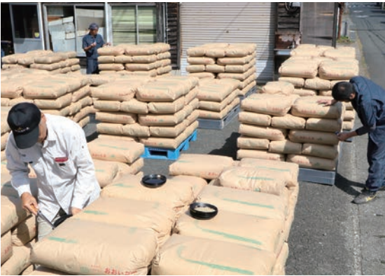
農産物検査で受入対応する農協職員ら

今年7月の豪雨災害や8・9月の猛暑と少雨、病害虫発生など大変厳しい栽培環境でしたが、高温障害に強い品種への作付け移行や肥培・水管理の徹底により、品質や収量が概ね向上した形となりました。