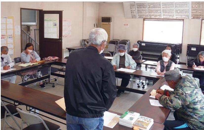
端境期の野菜不足解消についても話し合いました