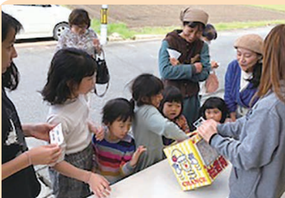
大抽選会を楽しむ家族づれ

半月前から2,000円以上お買い上げ毎に空くじなしの引換券を配布、抽選会当日は下郷農協のお肉詰合せや乳製品詰合せを引き当てようと、たくさんの方に楽しんで頂きました。