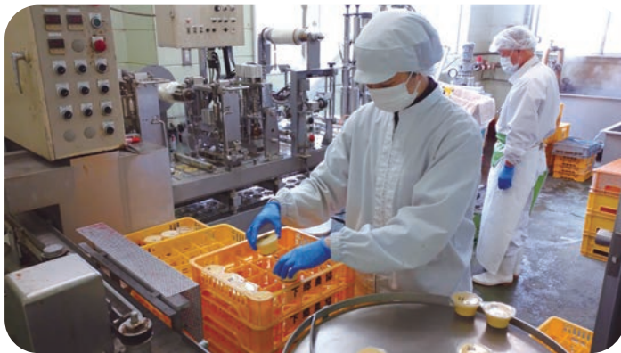
充填されたプリンをケースに詰める職員

耶馬溪牛乳と鶏卵を絶妙なバランスでじっくりブレンド、黒糖を使ったちょっと苦めな黒みつソースとも相性抜群です😊素朴な味わいのプリンをぜひ一度ご賞味ください♥♥