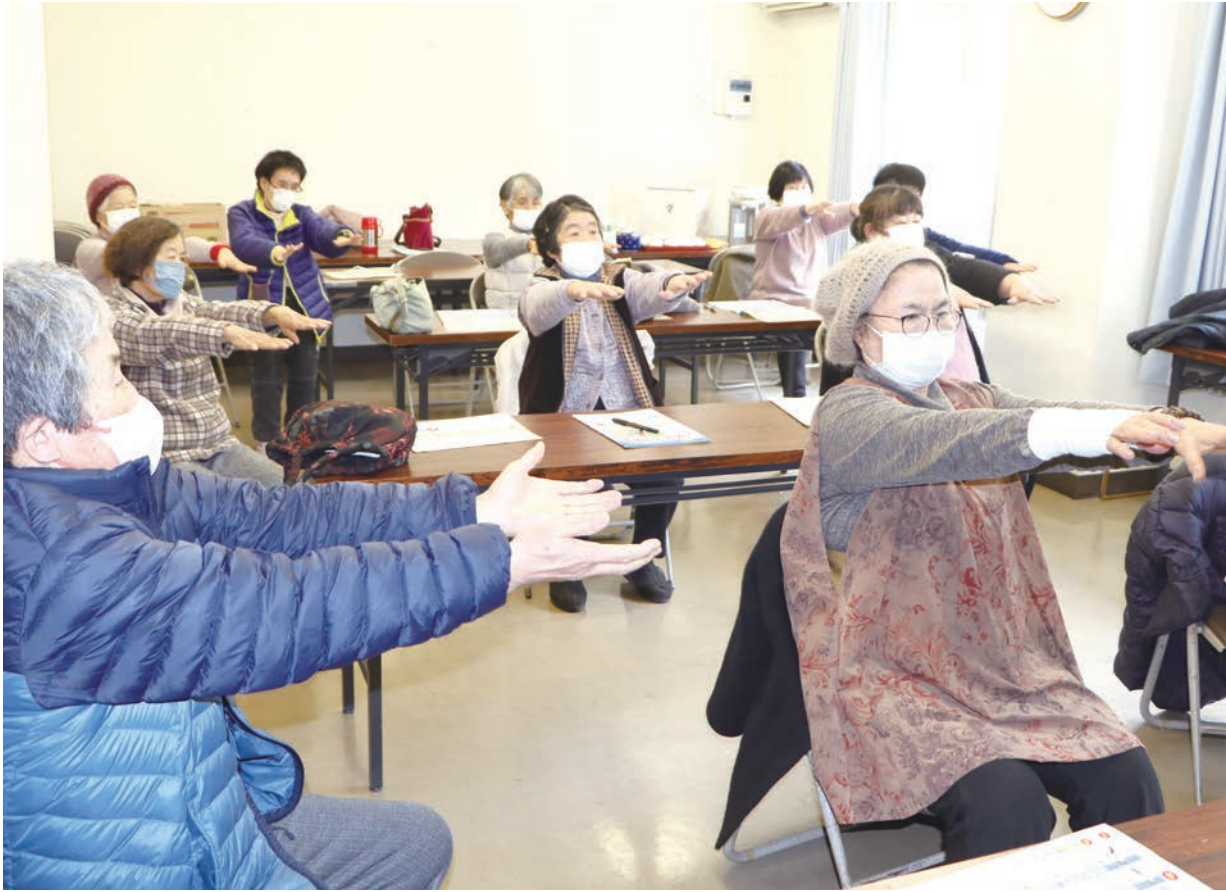
筋肉や関節を動かしながら体操する部員さん