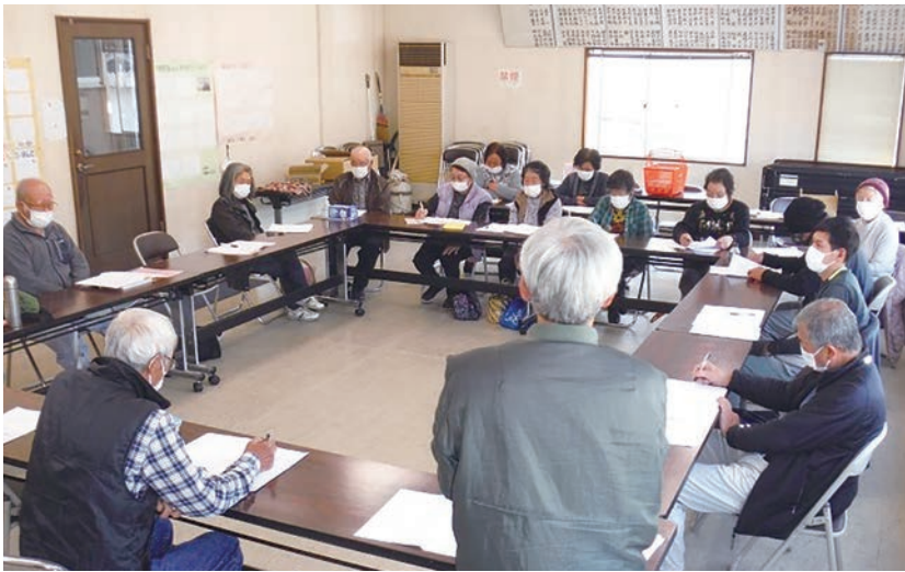
玉麻組合長から農協の状況と今後について説明を聞く組合員

拶で「品質の高い野菜を安定的に出荷できるように、意識して取り組んでいただきたい」と呼びかけました。 続いて来賓として下郷農協玉麻組合長から、現在の農協全体の状況と今後について説明していただきました。