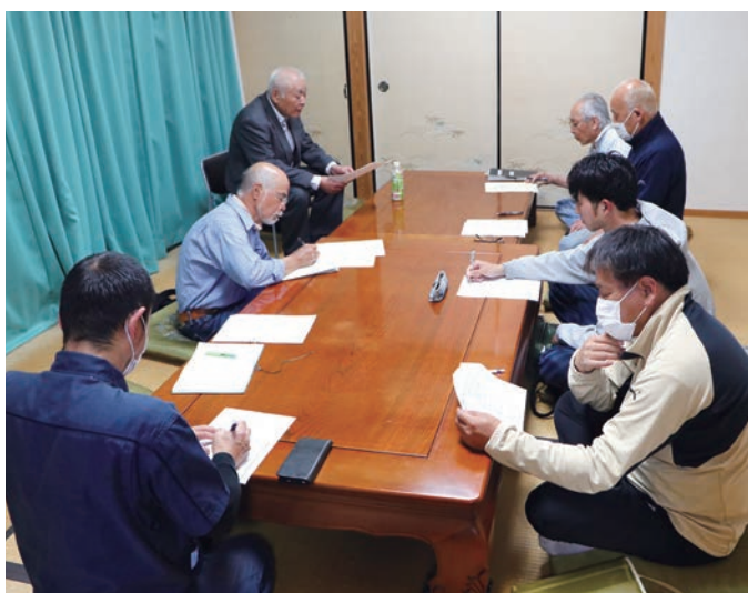
白土集落で行われた常会