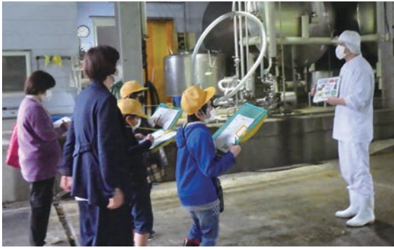
耶馬溪牛乳の製造工場を見学する児童たち

このまえはコーヒー牛にゆうは、おいしかったです。 きかいがすごかったです。 人がパックをいれることがすごかったです。(k)