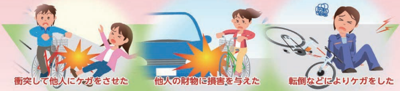
衝突して他人にケガをさせた

自転車は、その気軽さや便利さの裏にさまざまな危険が潜んでいます。 ご自身がケガをするだけでなく、歩行者にケガをさせたり、 他人の財物を壊して、高額な賠償金を請求されるケースもあります。