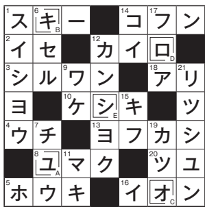
先月号のこたえ 「ユキオロシ」