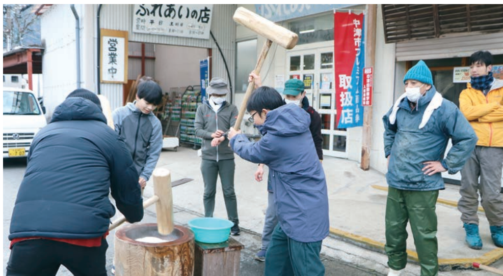
健康米生産の関係者が威勢よく餅つき

12月30日、購買ふれあいの店の年末大売出しに合わせ、健康米生産組合員らで恒例の餅つきを行っていただきました。収束の見えないコロナ禍でしたが、新たな年に向け年末売出しを盛り上げて頂きました。