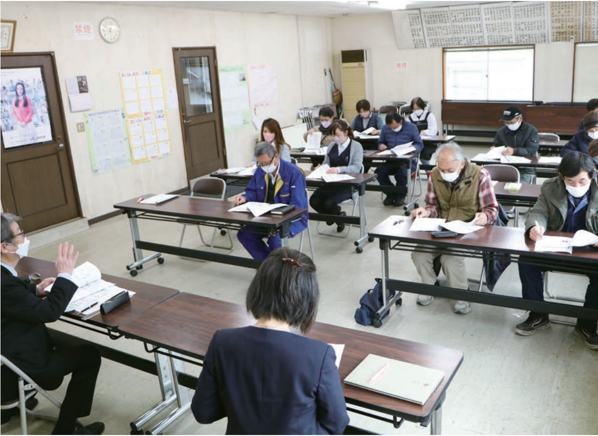
公認会計士・税理士からインボイス制度について学ぶ生産者ら

1月13日、農協本所会議室で公認会計士・税理士の講師2名を招き、生産者や役職員ら17名が参加して消費税インボイス制度の学習会を開催しました。