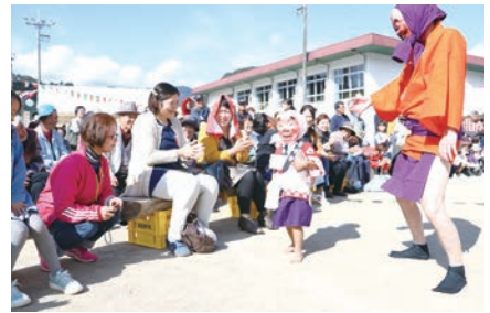
来年こそは交流の祭り開催を願って…