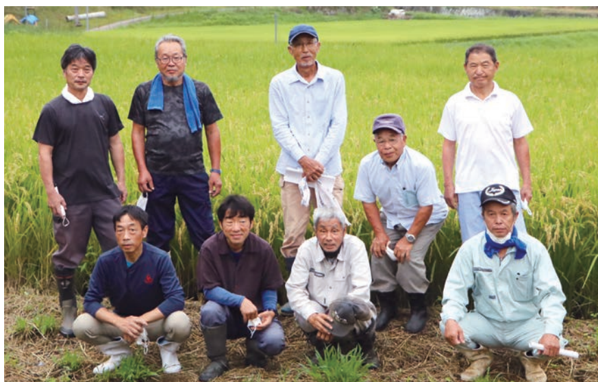
健康米生産組合の圃場巡りに参加した会員ら