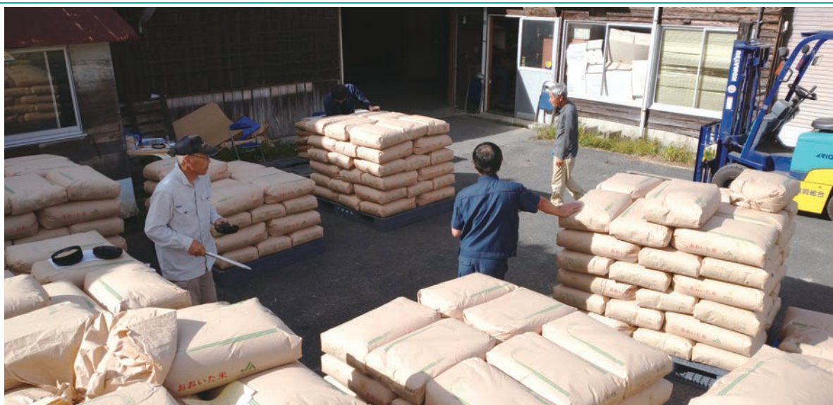
農産物検査で受入対応する農協職員ら