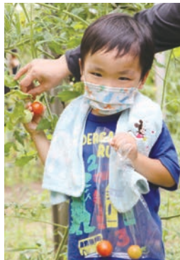
夏野菜の収穫体験を 楽しむ子どもたち