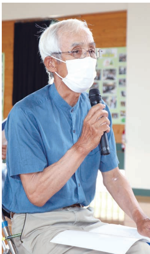
ネオニコチノイド系農薬の危険性について発言する組合員

譲渡に伴う長期10ヶ年計画6年が経過し、総会でご承認頂いた新たな5ヶ年計画の二年目の決算でした。