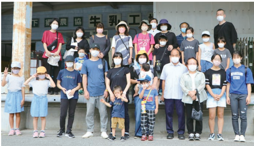
牛乳工場を見学後、農協職員と一緒に記念撮影