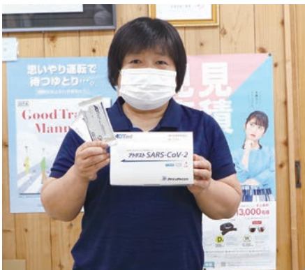
15分で判定できる抗原検査キット

また、同事業で「抗原検査簡易キット」（数量限定）も購入しましたので、ご希望の組合員は下郷農協（管理部）までお申し出下さい。