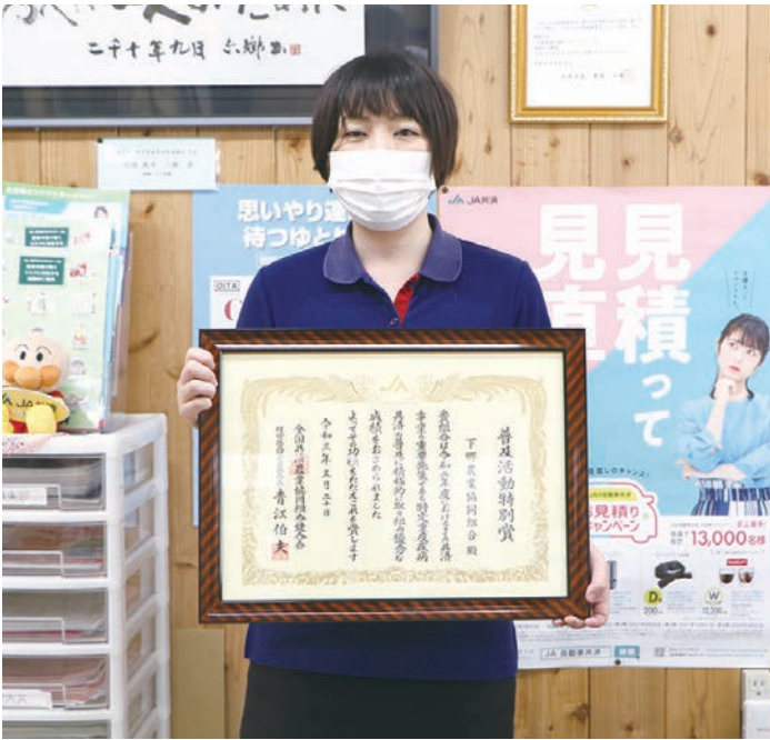
「普及活動特別賞」の表彰状を持つ共済担当の古賀職員