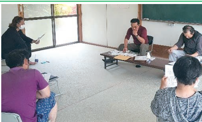
乳質向上と安定生産めざす（酪農組合総会）