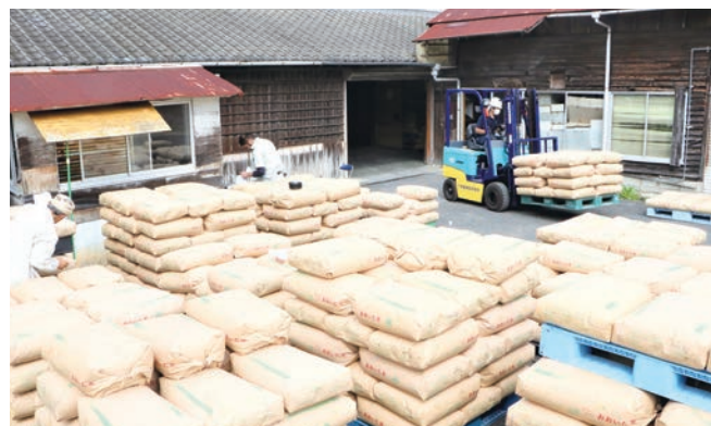
農産物検査で受入対応する農協職員ら