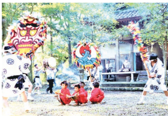
大うちわであおがれるかっぱ役の子ども達

9月21日、下郷地区のお伊勢山八幡宮で「かっぱ祭り」の榎山路楽が奉納され、五穀豊穡や新型コロナウイルス感染症拡大の収束など厄払いを祈願、約300年前からの地域伝統行事には、組合員や農協の役職員も参加していました。