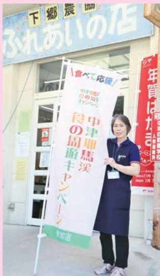
対象施設と参加店舗はこの旗が目印です！

コロナ感染拡大防止対策のうえ、中津・耶馬溪観光とふれあい店へのご来店をお待ちしています。