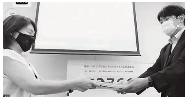
食農市民ネットらが農水省（右）に署名を提出

*署名用紙は農協ふれあいの店、日本消費者連盟HPからダウンロードできますし、オンライン署名も可能です。