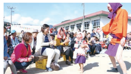
来年こそは交流の祭り開催を願って…