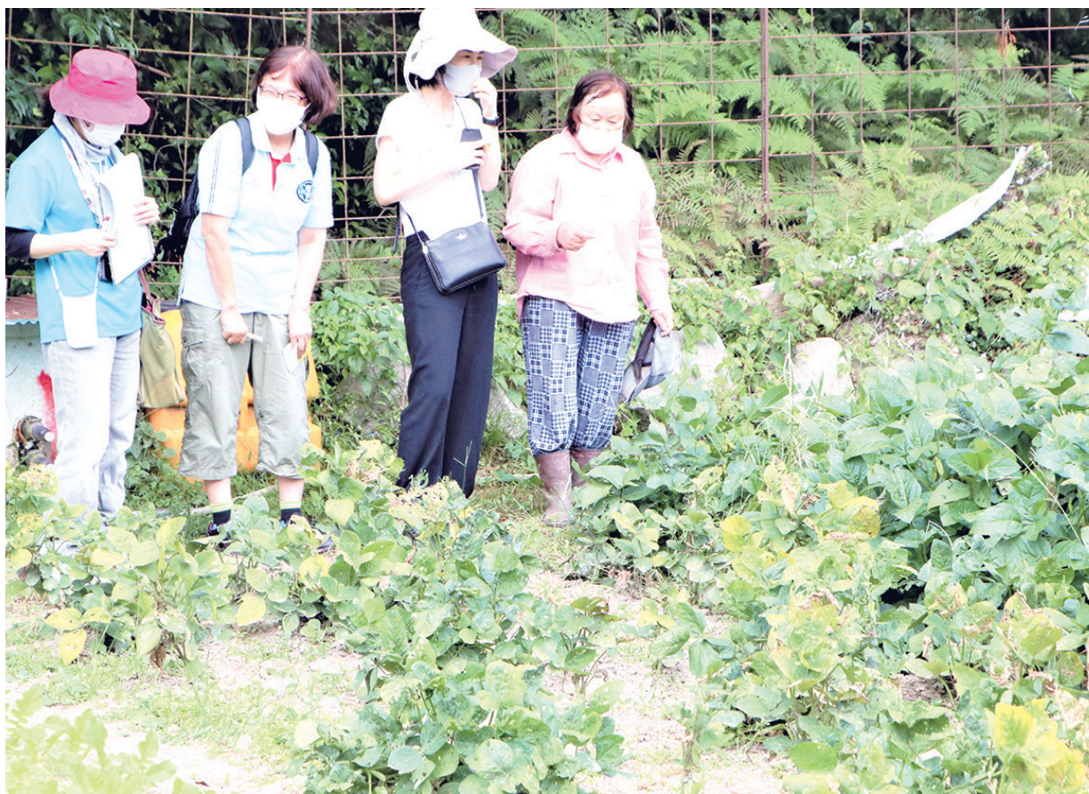
雨が少ない中での野菜生産状況の説明を聞く生協の委員さん

9月28日、グリーンコープ生協おいた商品おすすめ委員会の委員さんが産地交流に来られました。