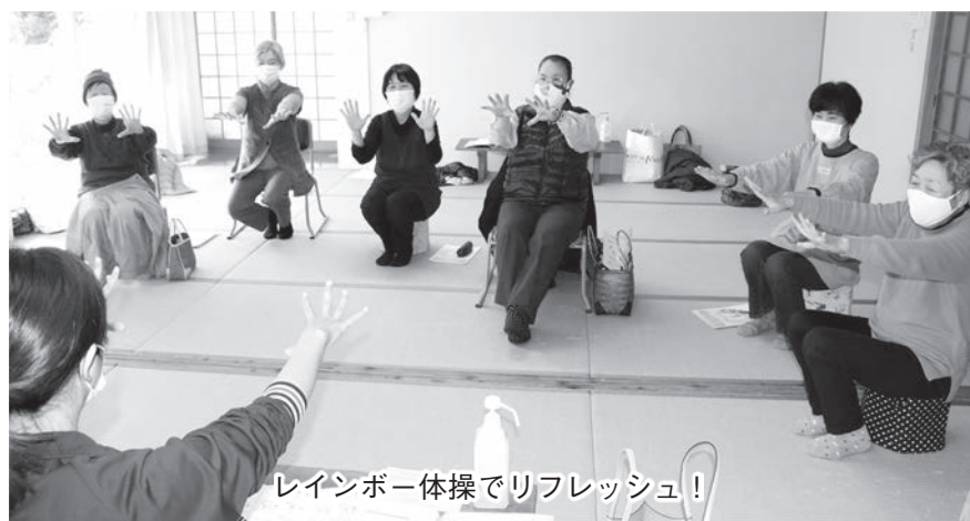
レインボー体操でリフレッシュ!

参加者からは自身の体験談も交えながら、体のことや病気についての質問が出され、皆さん真剣に先生の話に聞き入っていました。