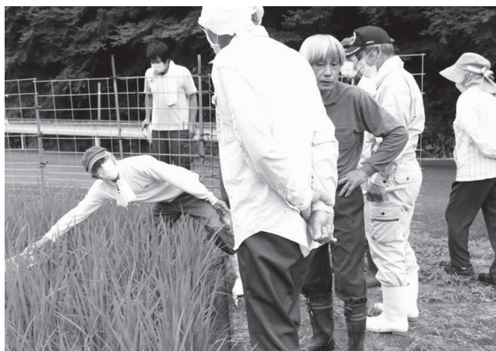
スケールを葉に当て施肥量を検討する生産者