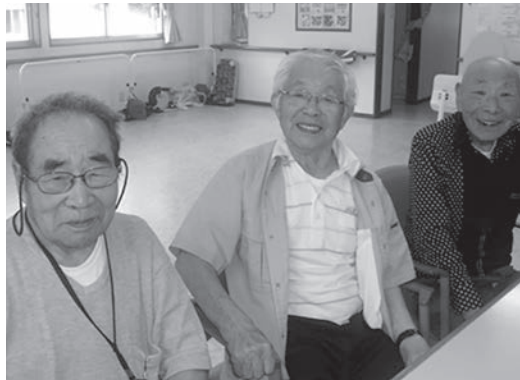
『元気村の男三人衆！』

今回はデイケア元気村の男三人衆をご紹介します。 利用日に3人が揃つのは週1回ですが、会つと昔なつかしい思い出話や今の社会経済についてなど、毎回、帰るのを忘れるくらい話が盛り上がっています。 これからも元気で、すてきな笑顔を見せてください。(^^)