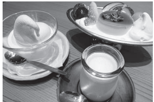
耶馬溪牛乳を使った新メニューのデザート