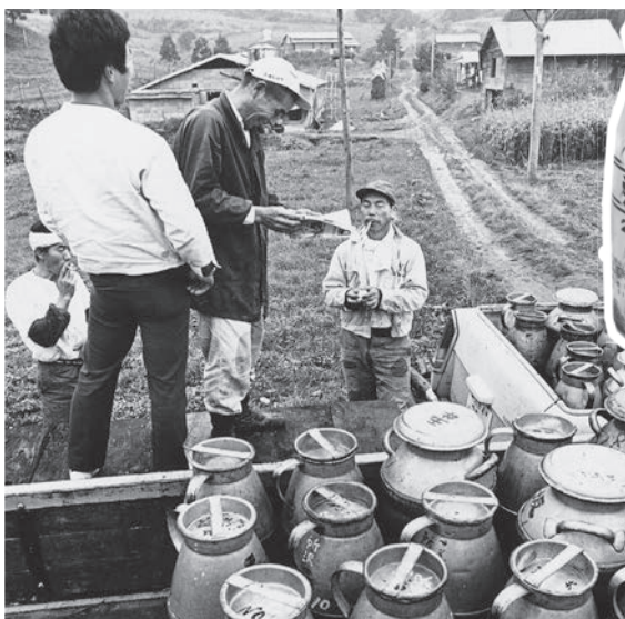
当時の産地での集乳風景