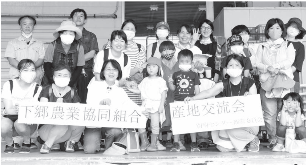
牛乳工場見学のあと皆で記念撮影

今年は長雨のため野菜が生育不良になっており収穫体験などは出来ませんでした。生産者の安心・安全な野菜作りの強い想いや栽培方法など実際に見聞きして頂いたことで、ご理解していただけたと感じています。