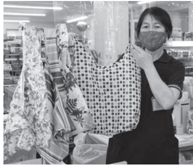
環境のためにエコバッグをどうぞ

1995年の容器包装リサイクル法制定、2006年の法改正等を契機にマイバッグの推奨とレジ袋の有料化（一枚5円と3円）を実施していますが、この機会に再度「地球にやさしい社会」の実現めざし、「環境のためにできる