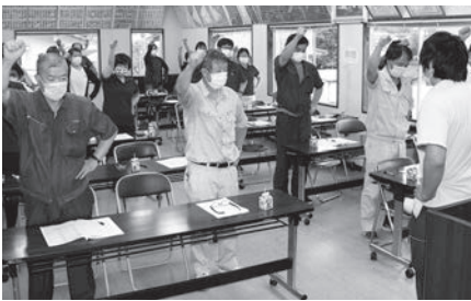
みんなで目標達成に向け「ガンバロー」

今年度も組合員へ「ひと・いえ・くるま」の総合保障をご提供いたしますので、宜しくお願い致します。