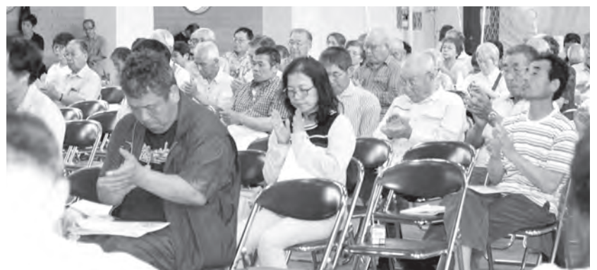
満場の拍手で「種子法の復活求める」特別決議を採択

生産者の減少や経済環境の影響による経営悪化など心配もありますが、生産者と膝を交えた協議も重ねながら、今年度のテーマである「再生産と経営継続に向けた決断と実践」を柱に、状況によって部門や商品など継続するのca止めるのかも決断しながら経営安定に努め、「消費者と提携し地域農業を守る」という理念の下、地域農業と地域