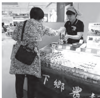
カフェオーレをすすめる職員

五月二十三～二十八日、バイヤーの目に留まったこだわりの逸品が並ぶ「第五十五回岩田屋定番コレクション」が福岡市の岩田屋本店で開催され、飲むヨーグルトやカフェオーレ等の商品で出店参加しました。また、耶馬溪酪農生産地・牛乳工場でのVTR取材と合わせて九州朝日放送「アサデス。九州山口」で生放送されました。開催期間中たくさんのお客さまに下郷農協の魅力ある商品を紹介することが出来ました。