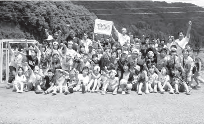
健康米生産者と北九州市門司区の「学童クラブすだち」の子ども達