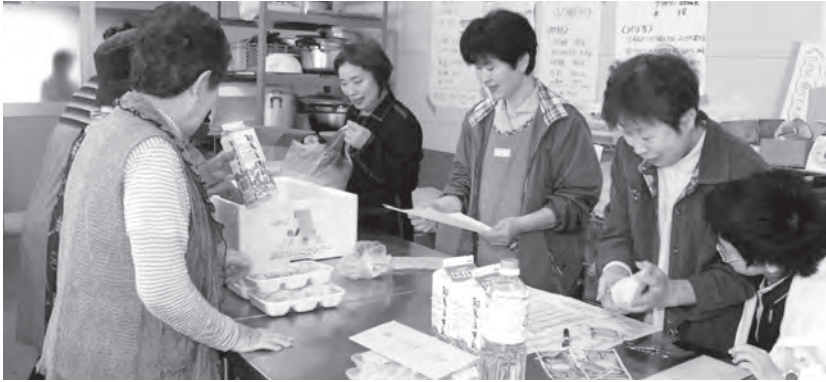
わいわい楽しく商品仕分けする部員たち