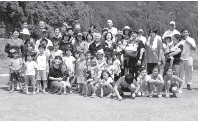
北九州市八幡西区の認定こども園ちいさいおうち共同保育園の園児とその保護者