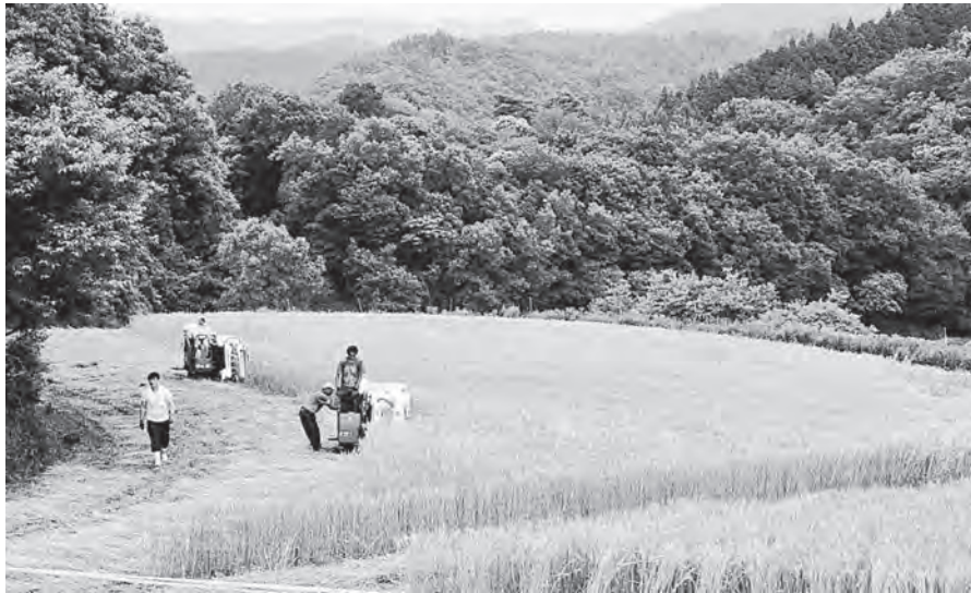
標高400mにある広大な麦畑