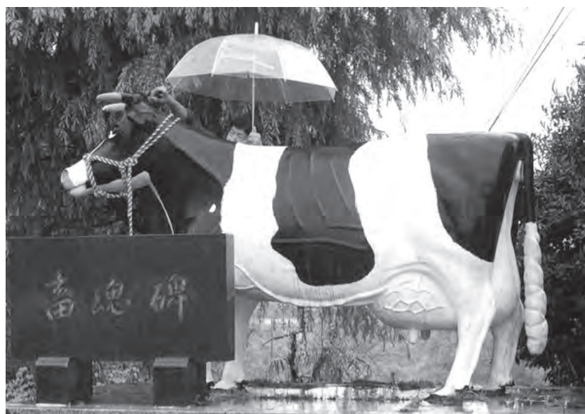
畜魂碑の乳牛像に清めのお酒をかける役員さん