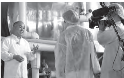
牛乳工場での撮影の様子

が並ぶことで知られる「岩田屋定番コレクション」(五月二十三日~二十八日の六日間開催)で下郷農協商品を販売、五月二十三日にその様子と合わせ放映されました。