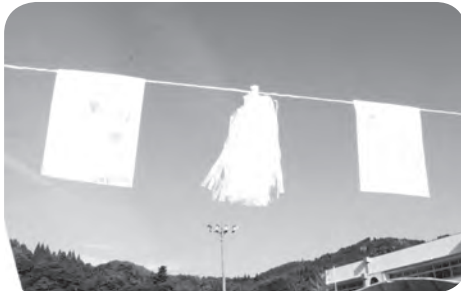
会場を飾った子どもたちが描いた万国旗