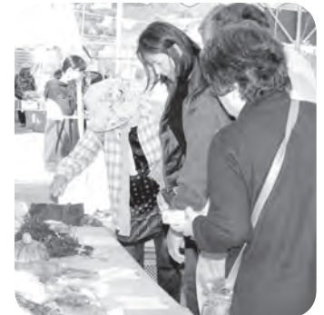
展示品を見る来場者