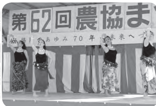
中津市如水を中心に活動する「フラリノ」