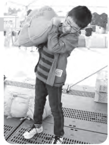
「力自慢の俵上げ」に挑戦