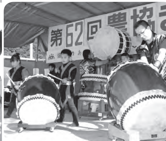
勇壮な演奏を披露する「上毛龍神太鼓」