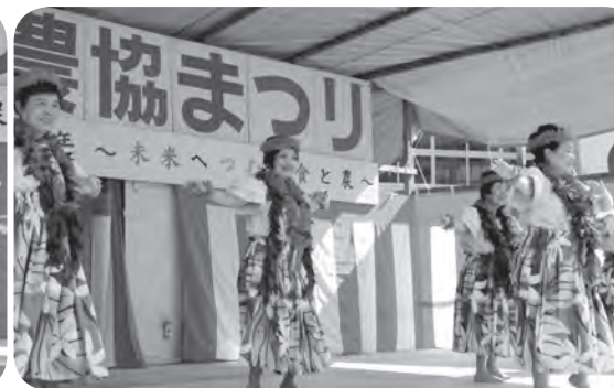
産直消費者のフラダンス