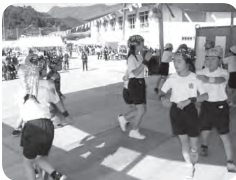
元気に踊る下郷小児童たち