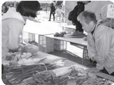
丹精込めて作った農産物展示コーナー