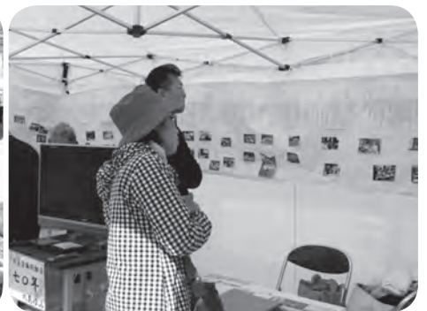
創立70周年展のパネルを見る来場者