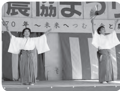
優雅な舞いの「舞踊溪扇会」