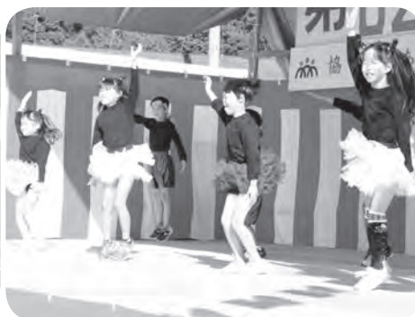
初出演のキュート&元気キッズ