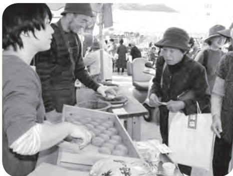
樋桶の郷の焼もち