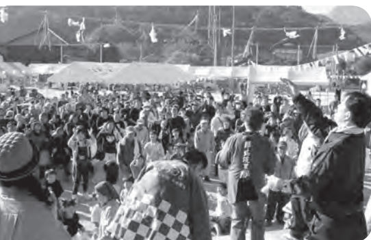
フィナーレのもちまき