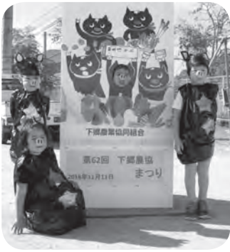
初登場!インスタ映え!?クロブタンの顔抜きパネル