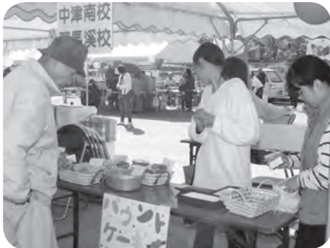
農協食材を使ったパウンドケーキ (中津南高耶馬溪校)