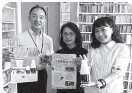
なかつ6次産業推奨品の「飲むヨーグルトS-1」をノースエフエムでPR

飲むヨーグルトは中津市のふるさと納税の返礼品にも選ばれています。中津市を代表する商品として、もっともっと全国の皆さんにこのヨーグルトを知って飲んでもらえたらいいなと思いました。