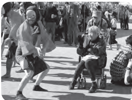
会場を沸かせた耶馬溪ひょっこ衆