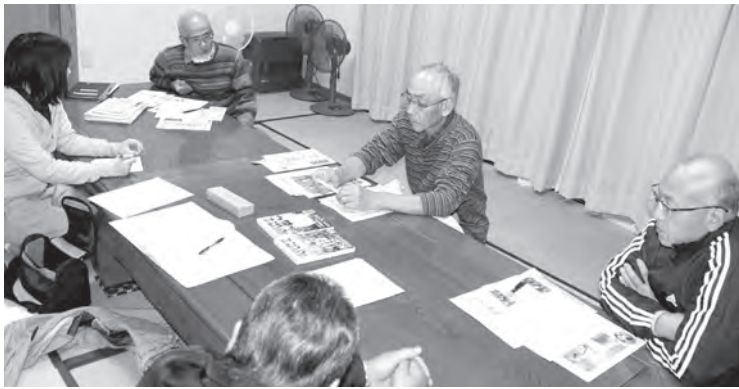
樋山路地区の白土集落常会の様子

展示コーナーやインスタ映えを狙ったクロブタンの顔抜きパネル、子供向けのぬいぐるみ(着ぐるみ)・射的ゲームなどを取り入れました。更に生産者と消費者・地域の皆さんが集い交流のできる祭となる様、新たな企画にも挑戦したいと思います。