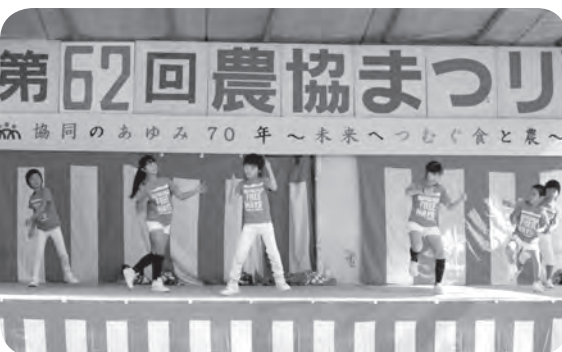
切れのあるダンスを披露するアグリキャッツ