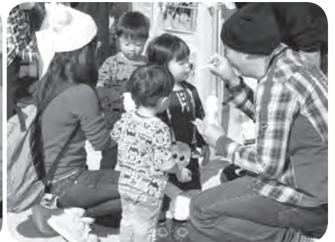
大好評のソフトクリーム