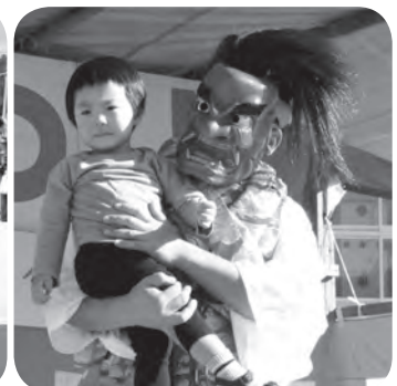
鬼なんか怖くない!!