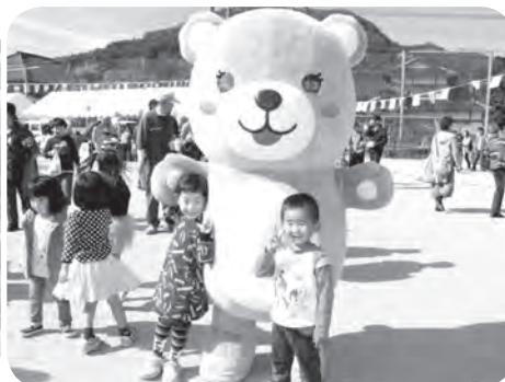
出沒！子どもに人気のピンククマ