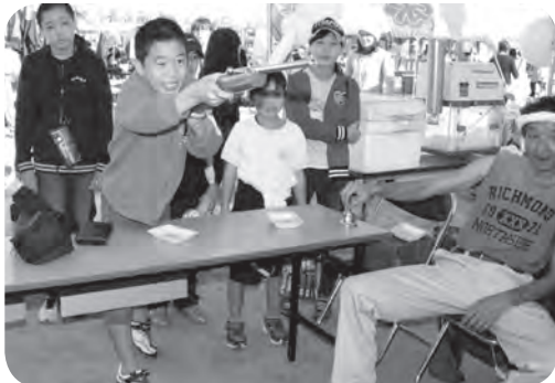
子どもに人気の射的コーナー (農協労組)