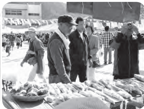
おいしい自然薯はいかが...