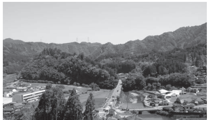
お伊勢山・下郷中心部にあり、存在感十分である

大久保村にあり。祭神、天照皇大神に坐して、大久保、金吉、島、宮園、樋山路の五箇村にて祭り、扱、此の金吉の抜郷に伊福と云ふがあるに據りて熟考ふるに、姓氏録に、伊福部宿禰尾張連同祖火明命之後也、と見え、古史傳に、「式なる津國島下郡新屋に坐す天照御魂神社、また、尾張國神社帳なる海部郡新屋神社などを、里人は天照大神といえど天照國照彦火明神なり」と、委曲に辨へられたるを以て按ふに、此地なる大神宮もかの伊福部の遠祖火明命にて、往昔は天照御魂神と云ひけむを、天照と申すに因りて大神宮と思ひ混へたるには非ざるか。云々