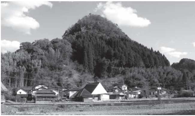
伊福の城山・中世の山城であろうか

この飛躍し過ぎたような説ではあるが、渡邊重春氏が「後人尚よく考へてよ」と結んでいるところについて筆者は反応し、勝手に使命感をもってしまったのであるが、はたして「伊福」と「金吉」の地名の由来に近づくことができるのか、次号から本格的な考察をはじめよう。