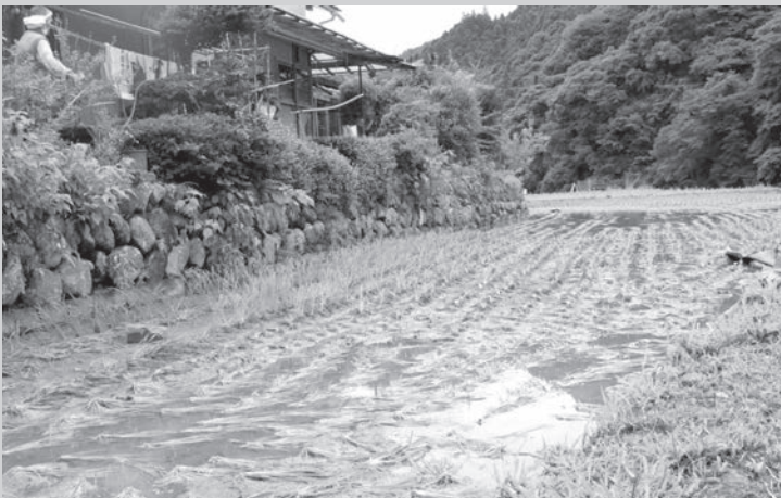
表土が流され稲根が浮いた河川沿いの水田

当農協は5年前、二度にわたる豪雨により甚大な被害を受けましたが、関係者の皆様の温かいご支援ご協力を頂き、いち早く復旧することが出来ました。