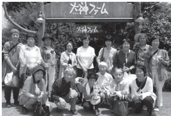
大神ファームでキャンドル作りに挑戦

ハーブ園に到着後、最初にハーブオイルを入れたキャンドル作りに挑戦しました。ガラスのグラスの底に貝殻や色とりどりの小石や砂を敷き詰め、溶かしたロウを流し入れ、好みのハーブオイルをたらして完成です。ロウが冷えて固まるまで、ハ