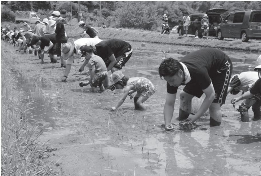
泥んこになりながら田植えを楽しむ園児ら