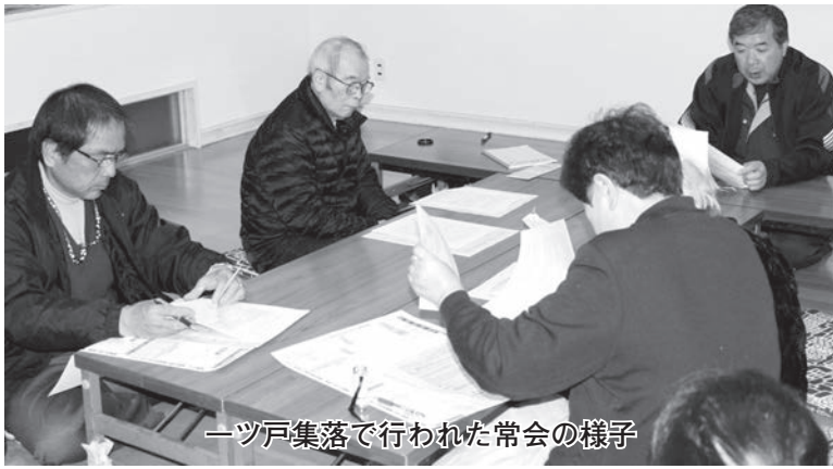
一ツ戸集落で行われた常会の様子

舗を構える計画はありません。不便となりますが引き続きのご愛顧をお願い致します。また、先に案内の送迎車利用をお気軽にぜひ活用下さい。