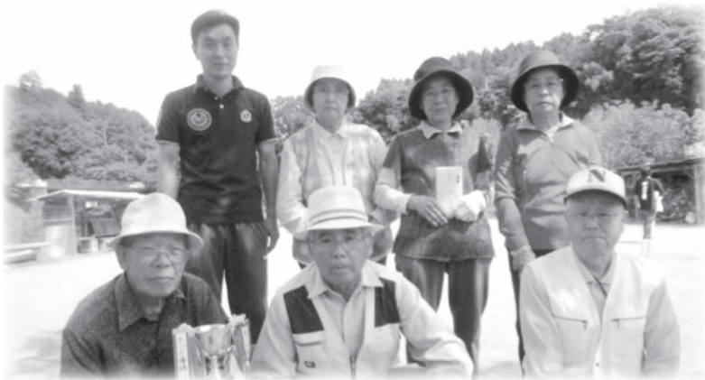
優勝 樋山路チーム

なお結果は次の通りです。 優勝 樋山路チーム 二位 大島チーム 三位 伊福Aチーム 参加された皆様、有難うございました。 なお、その後大分で開催のスポーツ大会は、組合長杯で優勝した樋山路チームのメンバーを中心に参加し健闘しました。