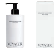
レイニーデイ イン ニューヨーク ボディローション 300ml