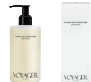
レイニーデイ イン ニューヨーク ボディウォッシュ 300ml