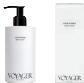
ラブ イン パリ ボディローション 300ml 定価: 各¥3,680(¥4,048税込)