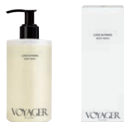
ラブ イン パリ ボディウォッシュ 300ml