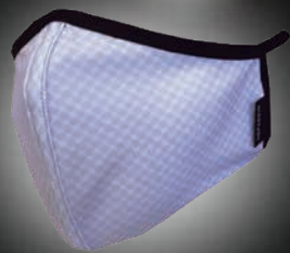
ヘバスキん4D ストレッチクールマスク ● ホワイト 1枚 定価:¥3,200(税別)