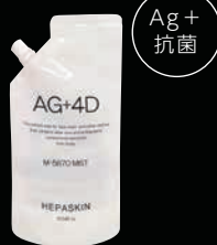
ヘバスキん AG+4D M-5670 ミスト

テラヘルツ人工鉱石を配合した特殊生地です。 テラヘルツ波を放射することで、放熱・遮熱の同時冷却を実現し、その冷感が持続します。 夏場でもマスクが蒸れにくく、マスクストレスを軽減、熱中症予防などの効果が期待できる高性能マスクです。