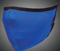
ヘバスキん4D ストレッチクールマスク ● ブルー 1枚 定価:¥3,200(税別)