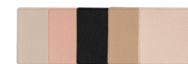
TAU-#600-1 コースター 角型(10枚入) ¥3,300