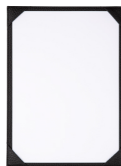
TAU-103 コーナーポケット仕様(1ページ仕様) ¥2,100