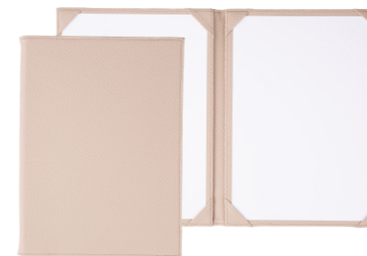
TAU-101 コーナーポケット仕様(2ページ仕様) ¥3,500