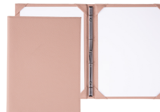
TAU-101B コーナーポケット+ スリムバインダー仕様(2ページ仕様) ¥4,950