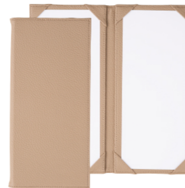
TAU-102 コーナーポケット仕様(2ページ仕様) ¥3,200