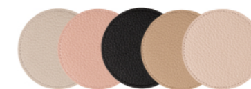
TAU-#600-1 コースター 丸型(10枚入) ¥3,300