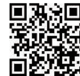
起震車実験の動画あります