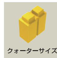
クォーターサイズ