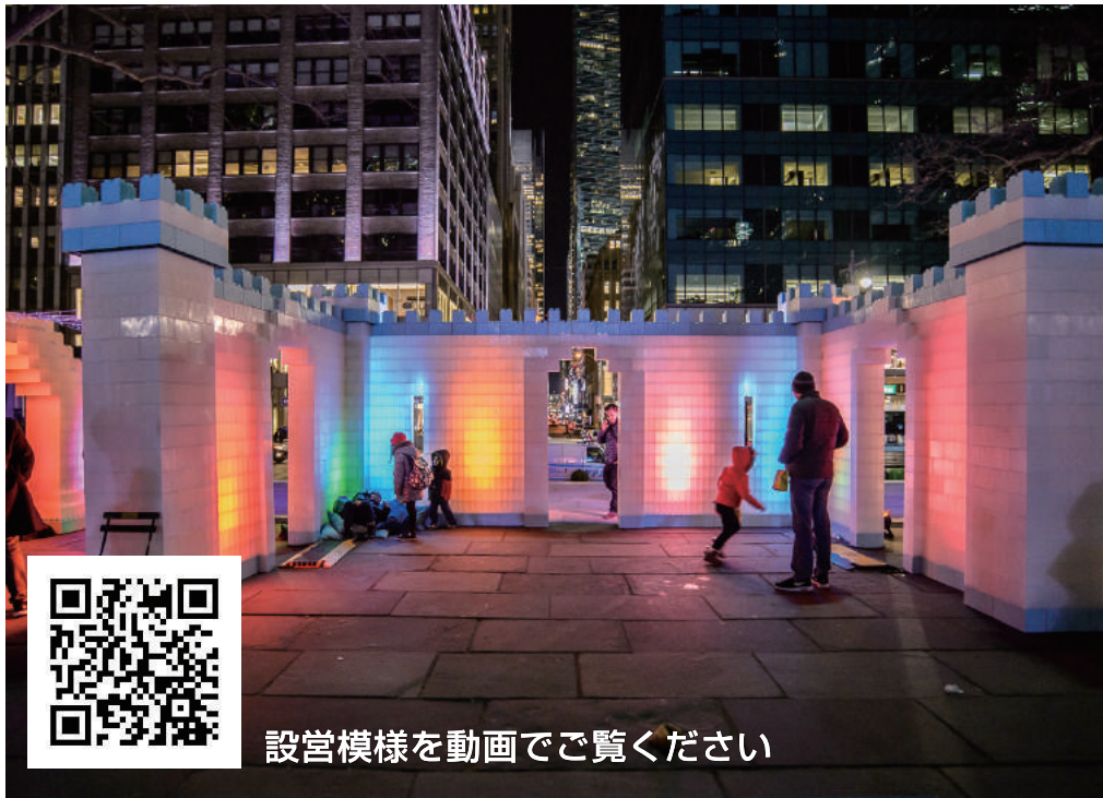
設営模様を動画でご覧ください