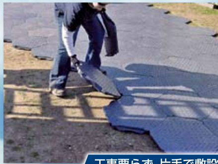
工事要らず、片手で敷設