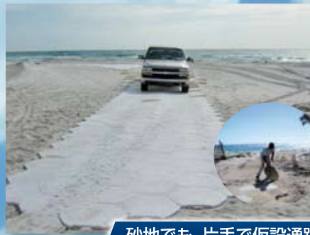
砂地でも、片手で仮設通路