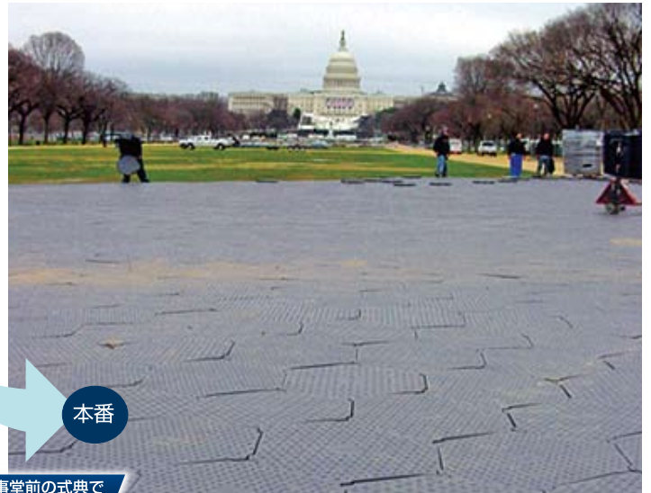
アメリカ国会議事堂前の式典で