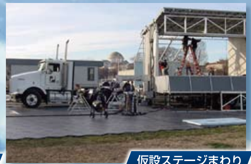
仮設ステージまわり