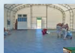
アメリカ軍野営テントのフロアリングや作業場にも活用されています